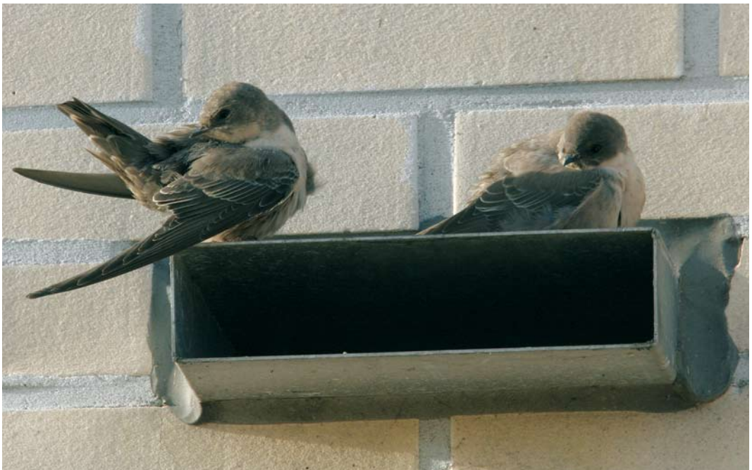
422 Rotszwaluwen / Eurasian Crag Martins Ptyonoprogne rupestris , eerste-winter, Hoorn, Noord-Holland, 18 november 2006

STAART Bovenstaart donkergrijs, vooral van boven contrasterend met stuit. Meerdere lichte vlakjes aanwezig op staart, op bovenstaart goed zichtbaar, niet zo goed op onderstaart.