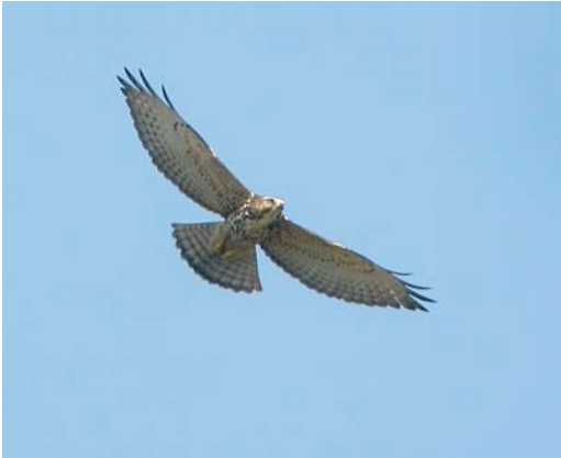
436 Broad-winged Hawk / Breedvleugelbuizerd Buteo platypterus , Cardel, Mexico, 27 October 2006