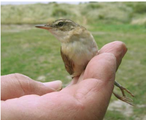
492 Veldrietzanger / Paddyfield Warbler Acrocephalus agricola , adult, Kroons Polders, Vlieland, Friesland, 21 augustus 2007 (Marinka Schippers)