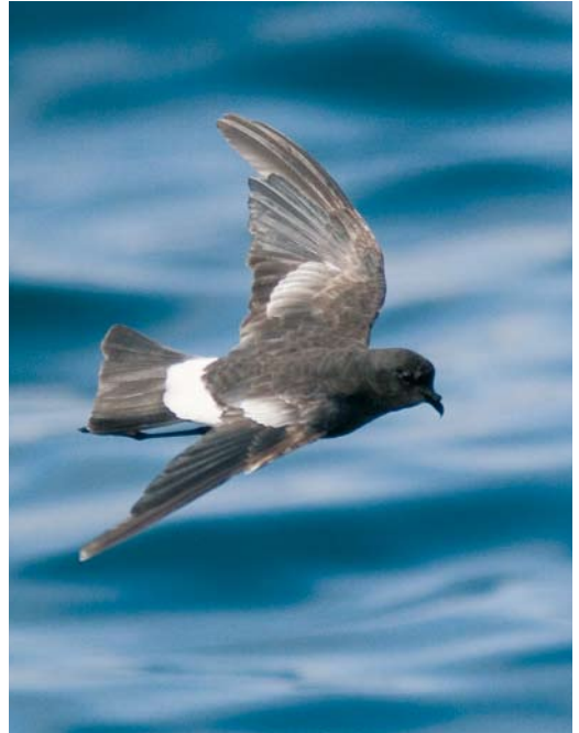
441 Atlantic Yellow-nosed Albatross / Atlantische Geelneusalbatros Thalassarche chlorohynchos, immature, with Greylag Goose / Grauwe Gans Anser anser, Messingham, Lincolnshire, England, 3 July 2007 cf Dutch Birding 29: 242, 2007 442-443 Wilson's Storm-petrel / Wilsons Stormvogeltje Oceanites oceanicus, c 39 km south off Vestmannaeyjar, Iceland, 11 August 2007