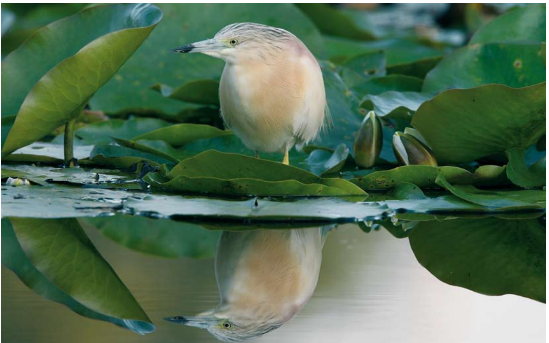
471 Ralreiger / Squacco Heron Ardeola ralloides , adult, Julianadorp, Noord-Holland, 5 augustus 2007 (Hans Brinks)