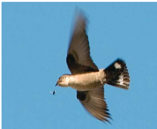
423-424 Rotszwaluw / Eurasian Crag Martin Ptyonoprogne rupestris , eerste-winter, Hoorn, Noord-Holland, 18 november 2006 (Roland Jansen)

GEDRAG Gemakkelijke vlucht met kantelen en draaien, afgewisseld met korte vleugelslagen gevolgd door korte glijvluchten. Na ontmoeting met Sperwer wat rustiger vliegend met rechttere vlucht, afgewisseld met korte glijvluchten. Tijdens waarneming staart regelmatig wijd uitgespreid.