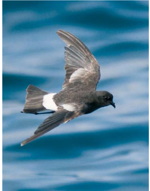
441 Atlantic Yellow-nosed Albatross / Atlantische Geelneusalbatros Thalassarche chlorohynchos, immature, with Greylag Goose / Grauwe Gans Anser anser, Messingham, Lincolnshire, England, 3 July 2007 cf Dutch Birding 29: 242, 2007 442-443 Wilson's Storm-petrel / Wilsons Stormvogeltje Oceanites oceanicus, c 39 km south off Vestmannaeyjar, Iceland, 11 August 2007