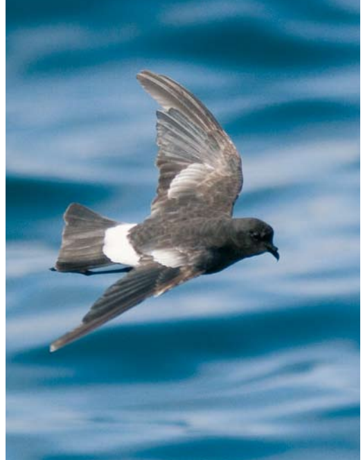
441 Atlantic Yellow-nosed Albatross / Atlantische Geelneusalbatros Thalassarche chlorohynchos, immature, with Greylag Goose / Grauwe Gans Anser anser, Messingham, Lincolnshire, England, 3 July 2007 cf Dutch Birding 29: 242, 2007 442-443 Wilson's Storm-petrel / Wilsons Stormvogeltje Oceanites oceanicus, c 39 km south off Vestmannaeyjar, Iceland, 11 August 2007