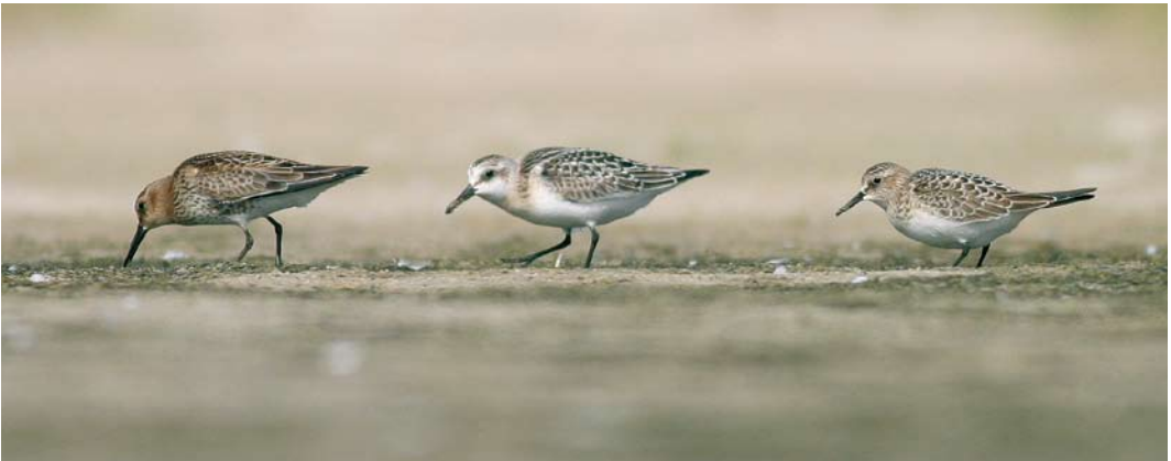
459 Sharp-tailed Sandpiper / Siberische Strandloper Calidris acuminata , adult, Rockanje, Zuid-Holland, Netherlands, 14 July 2007 ( Luuk Punt ) 460 Greater Sand Plover / Woestijnplevier Charadrius leschenaultii , Groote Keeten, Noord-Holland, Netherlands, 2 August 2007 ( Harm Niesen ) 461 Baird's Sandpiper / Bairds Strandloper Calidris bairdii (right), with Dunlin / Bonte Strandloper C. alpina (left) and Sanderling / Drieteenstrandloper C. alba , juveniles, Grenen, Skagen, Nordjylland, Denmark, 1 September 2007 ( Søren Kristoffersen )

4 September (juvenile), at Ballycotton, Cork, Ireland, on 2-3 September, and at Garður on 14 September (juvenile and sixth for Iceland). In Scotland, a Solitary Sandpiper Tringa solitaria was photographed on St Kilda, Outer Hebrides, on 27-28 August. Wilson's Phalaropes Phalaropus tricolor were present, for instance, in Schleswig-Holstein at Beltringharder Koog and Rickelsbull Koog on 4-7 and 18-22 August (adult winter), in England in Durham, North Yorkshire, and Buckinghamshire on 15-26 August (adult), in Wexford from 28 August to 2 September (juvenile), at Stanpit Marsh, Dorset, England, from 6 September, and at Belfast Lough, Antrim, Northern Ireland, from 8 September (juvenile).