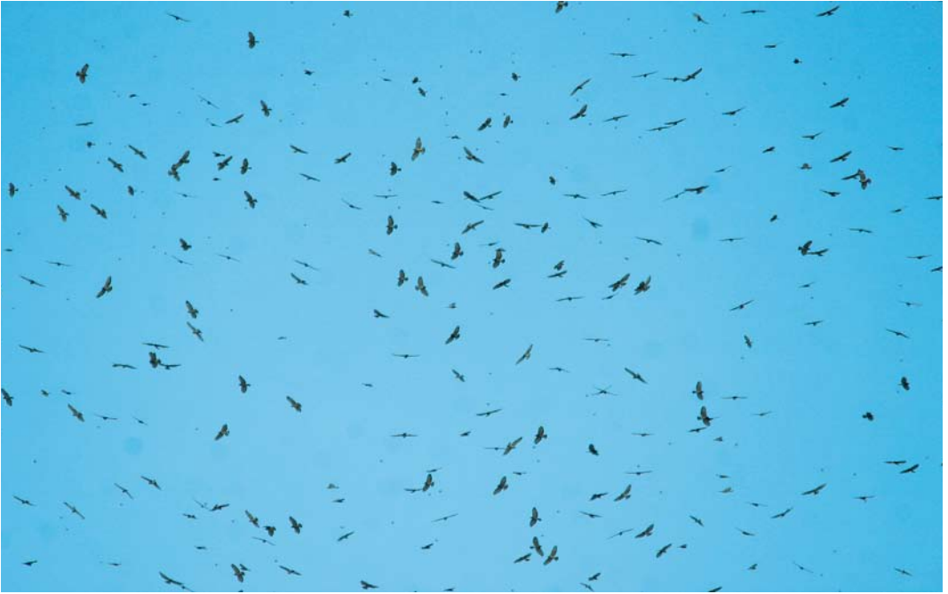
431-432 Broad-winged Hawks / Breedvleugelbuizerds Buteo platypterus , Veracruz, Mexico, 1 October 2004