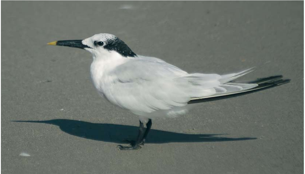
407 American Sandwich Tern / Amerikaanse Grote Stern Sterna sandvicensis acullavida , adult-winter, Florida, USA, 2 November 2005. Primaries are moulting, with two to three old worn and blackish outer primaries remaining. New fresh primaries are key to separating adult-winter acullavida and nominate sandvicensis . P7 (longest new primary) has insufficient white along fringe and at tip for sandvicensis and this, together with very black rear crown feathers with only tiny amount of white, enables identification. Bill, while slightly decurved, is also quite deep based. This bird would probably look clearly smaller alongside nominate sandvicensis .

pears to hold true. Therefore, the value placed on this difference to the identification process is high. However, it may only be obvious (and diagnostic) on fresh, newly grown feathers. The effects of wear will make this difference less apparent on older, darker outer primaries as the white fringes and tips wear off, so an evaluation of the age of the feathers based on their overall appearance, combined with knowledge of moult patterns and time of year, is crucial.