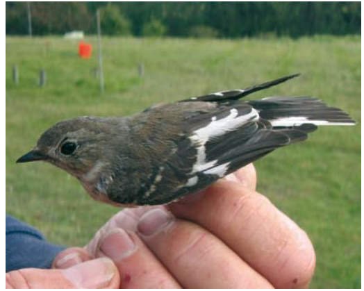
494-495 Withalsvliegenvanger / Collared Flycatcher Ficedula albicollis , eerstejaars, Meijndel, Wassenaar, Zuid-Holland, 14 september 2007

PADDYFIELD WARBLERS On 21 August 2007, one adult female and two first-year Paddyfield Warblers Acrocephalus agricola were trapped together in one mistnet at Kroons Polders, Vlieland, Friesland. The adult was a female with a clear brood patch. On 28 August, a third first-year was trapped in another mistnet at the same site. If accepted, these birds represent the 19th and 20th record (19th to 22nd individual) and, even more interestingly, probably indicate the first breeding record for the Netherlands.