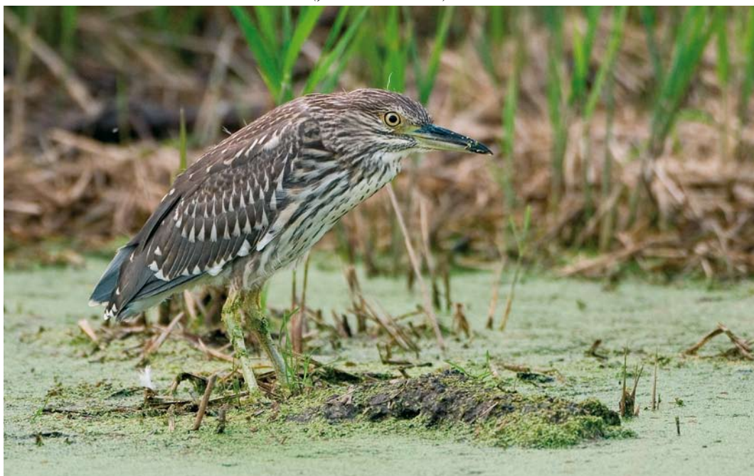
475 Kwak / Black-crowned Night Heron Nycticorax nycticorax , juveniel, Woerden, Utrecht, augustus 2007