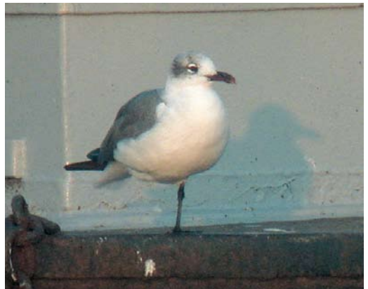
415 Laughing Gull / Lachmeeuw Larus atricilla , adult ('Atze'), Luzern, Luzern, Switzerland, 30 October 2006 ( Bernard Volet ) 416 Laughing Gull / Lachmeeuw Larus atricilla , adult ('Atze'), Zwillbrocker Venn, Nordrhein-Westfalen, Germany, April 2002 ( Martin Gottschling ) 417 Laughing Gull / Lachmeeuw Larus atricilla , adult ('Atze'), Blanes, Girona, Spain, 21 January 2007 ( Ferran López ) 418 Laughing Gull / Lachmeeuw Larus atricilla , adult ('Atze'), Blanes, Girona, Spain, 17 January 2007 ( Ricard Gutiérrez ) 419 Laughing Gull / Lachmeeuw Larus atricilla , adult ('Atze'), Duiven, Gelderland, Netherlands, 25 August 2007 ( Sjaak Schilperoort )