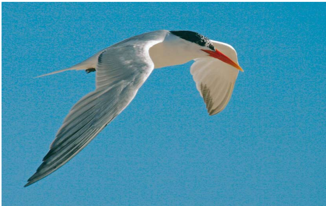
444-445 Elegant Tern / Sierlijke Stern Sterna elegans , adult, Banc d'Arguin, Gironde, France, 8 August 2007