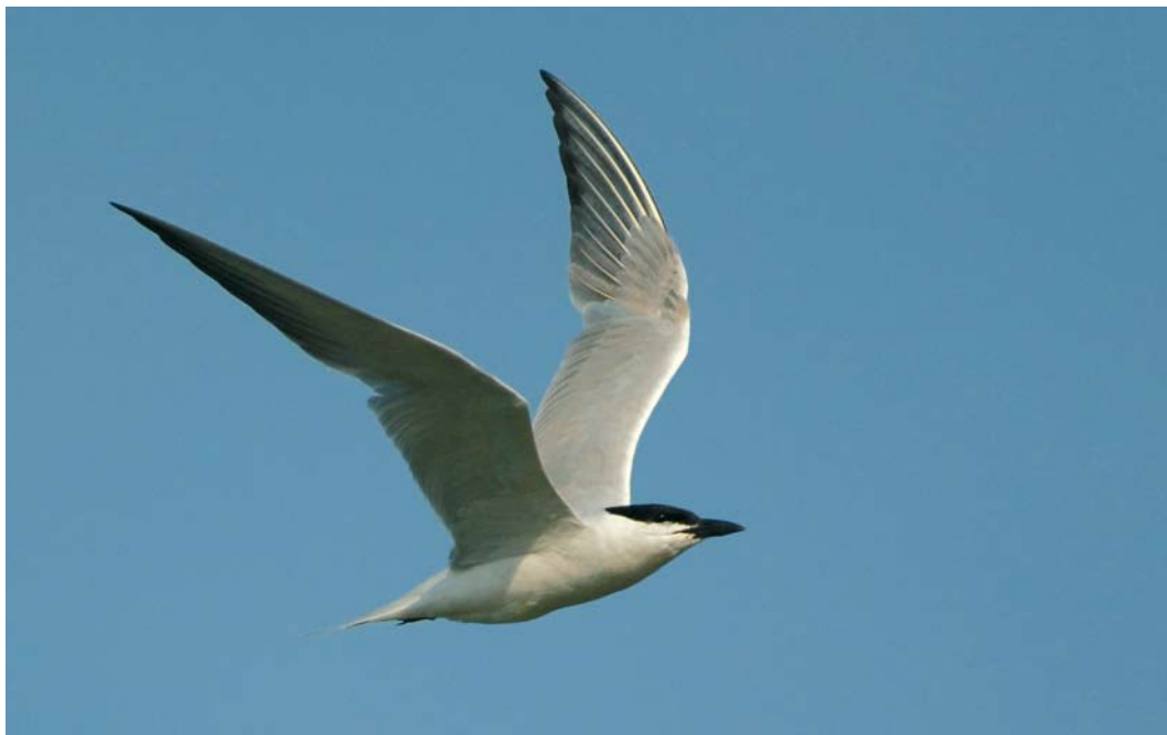
474 Lachstern / Gull-billed Tern Gelochelidon nilotica , adult, 't Zand, Noord-Holland, 1 augustus 2007 (Harm Niesen)