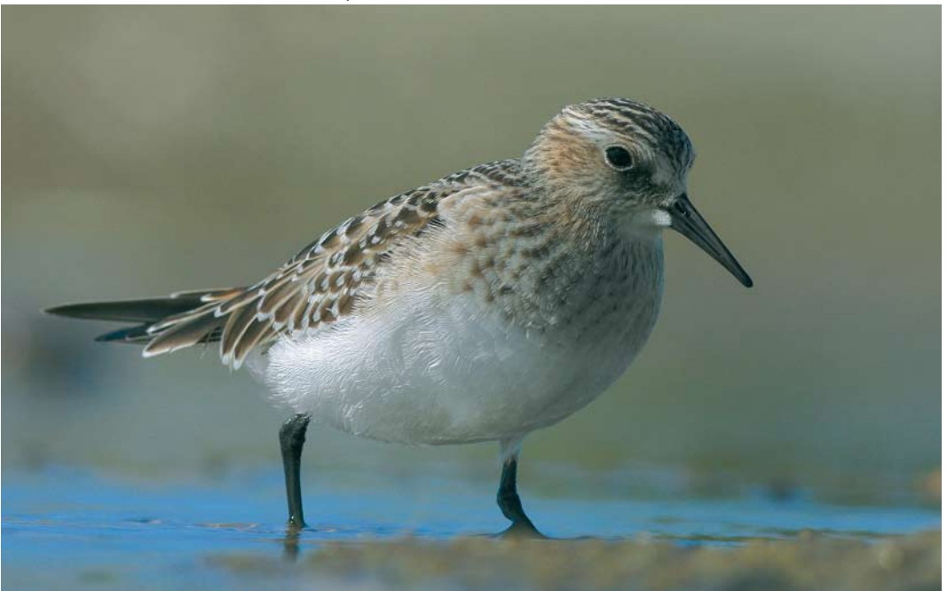
451 Baird's Sandpiper / Bairds Strandloper Calidris bairdii , juvenile, Grenen, Skagen, Nordjylland, Denmark, 4 September 2007