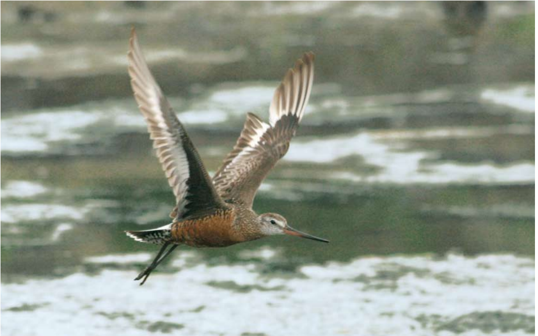
448-449 Hudsonian Godwit / Rode Grutto Limosa haemastica , adult male, Cabo da Praia, Terceira, Azores, 25 July 2007 (Peter Alfrey & Simon Buckell)