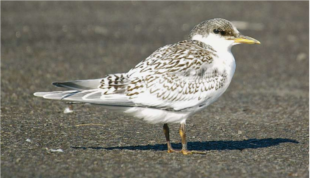
396 Sandwich Tern / Grote Stern Sterna sandvicensis sandvicensis , juvenile, Portrush, Antrim, Northern Ireland, 29 July 2007 ( Derek Charles ). Classic well-marked juvenile nominate sandvicensis with coarse 'U' and 'V' shaped internal marks extensively over mantle, scapulars and especially wing-coverts. Crown mottled dark and tertials strongly variegated black and white. Bare parts of fresh juveniles can show yellow, quite strikingly so on this individual, but overall identification is straightforward. 397 Sandwich Tern / Grote Stern Sterna sandvicensis sandvicensis , juvenile, Portrush, Antrim, Northern Ireland, 29 July 2007 ( Derek Charles ). Example of paler, less well-marked nominate sandvicensis . Coarse patterning is sufficiently obvious on mantle and scapulars but wing-coverts are at paler end of spectrum. Variegated innermost tertials partially hide plainer outer tertials, of which pattern is closer to that of American Sandwich Tern S s acullavida .