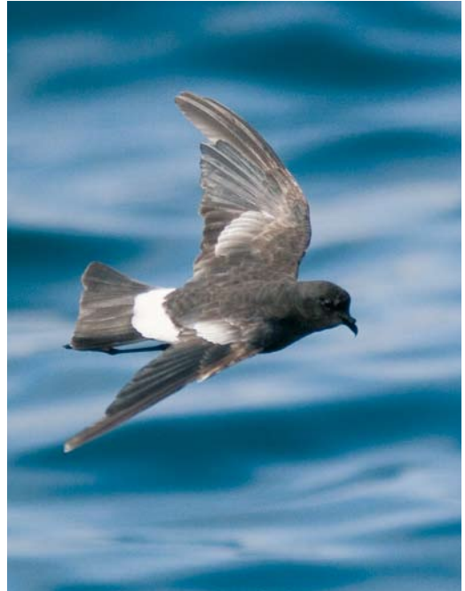
441 Atlantic Yellow-nosed Albatross / Atlantische Geelneusalbatros Thalassarche chlorohynchos, immature, with Greylag Goose / Grauwe Gans Anser anser, Messingham, Lincolnshire, England, 3 July 2007 cf Dutch Birding 29: 242, 2007 442-443 Wilson's Storm-petrel / Wilsons Stormvogeltje Oceanites oceanicus, c 39 km south off Vestmannaeyjar, Iceland, 11 August 2007