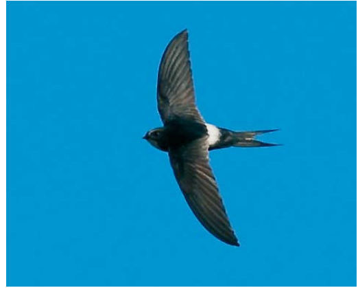
464-465 White-rumped Swift / Kaffergierzwaluw Apus caffer , Algarve, Portugal, 20 May 2007