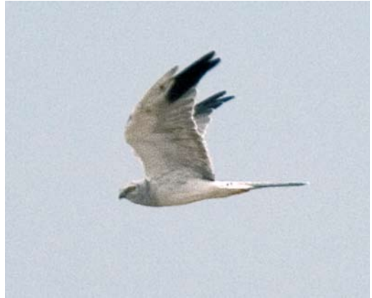
487 Steppiekiekendief / Pallid Harrier Circus macrourus , mannetje, Clermont, Cléron-Castillon, Hainaut, 31 augustus 2007 (Vincent Legrand)

mannetje bij Clermont, Hainaut. De waarneming raakte helaas pas echt bekend op de laatste dag van zijn verblijf. Op 4 augustus trok de eerste Grauwe Kiekendief C. pygargus van het najaar over Relegem-Asse. Tussen 13 en 24 augustus volgden nog 16 waarnemingen op Vlaamse bodem waarvan 10 exemplaren op 23 augustus. Waalse gegevens werden niet vermeld omwille van de broedvogelstatus. Op 14 juli vloog een Schreeuwend Aquila pomarina laag over Zwijndrecht, Oost-Vlaanderen. Wellicht was dit de vogel die reeds op 9 juli als 'kleine arend' werd gemeld bij Hoevenen, Antwerpen. Op 1 juli foerageerde een Visarend Pandion haliaetus boven het meer van Virelles. Vanaf 11 juli kwam de trek echt op gang en er volgden nog c 109 exemplaren. Op 21 augustus trok een onvolwassen mannetje Roodpootvalk Falco vespertinus langs Martouzin, Namur, en op 23 augustus vloog een juveniele langs Knokke, West-Vlaanderen. Pleisterende juveniele verschenen bij Burdinne, Namur, van 18 tot 21 augustus en bij Kalken, Oost-Vlaanderen, vanaf 30 augustus.