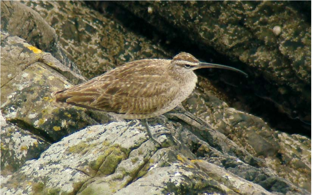
450 Hudsonian Whimbrel / Amerikaanse Regenwulp Numenius hudsonicus , adult, Fair Isle, Shetland, Scotland, 30 August 2007