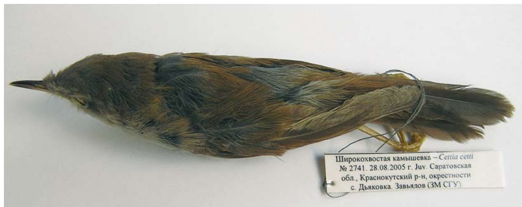
430 Cetti's Warbler / Cetti's Zanger Cettia cetti orientalis , first-year (collected at Diakovka, Krasnyi Kut district, Saratov region, Russia, on 28 August 2005), Zoological Museum of Saratov State University, Saratov, Russia, August 2006

from the first location highlighted the questions about the species' status and distribution in the Saratov region, and it was decided that additional studies were required. To this goal, more than 20 expeditions by Saratov State University (biological department) and A. N. Severtsov Institute for Ecology and Evolution RAS (Saratov branch) to the extreme south-east of the Saratov region have been carried out in 1995-2006. The majority of these expeditions have not been successful, indicating that the species is rather rare, or absent in some years. In some cases, however, the species' presence in floodland sites was confirmed by singing individuals though no birds