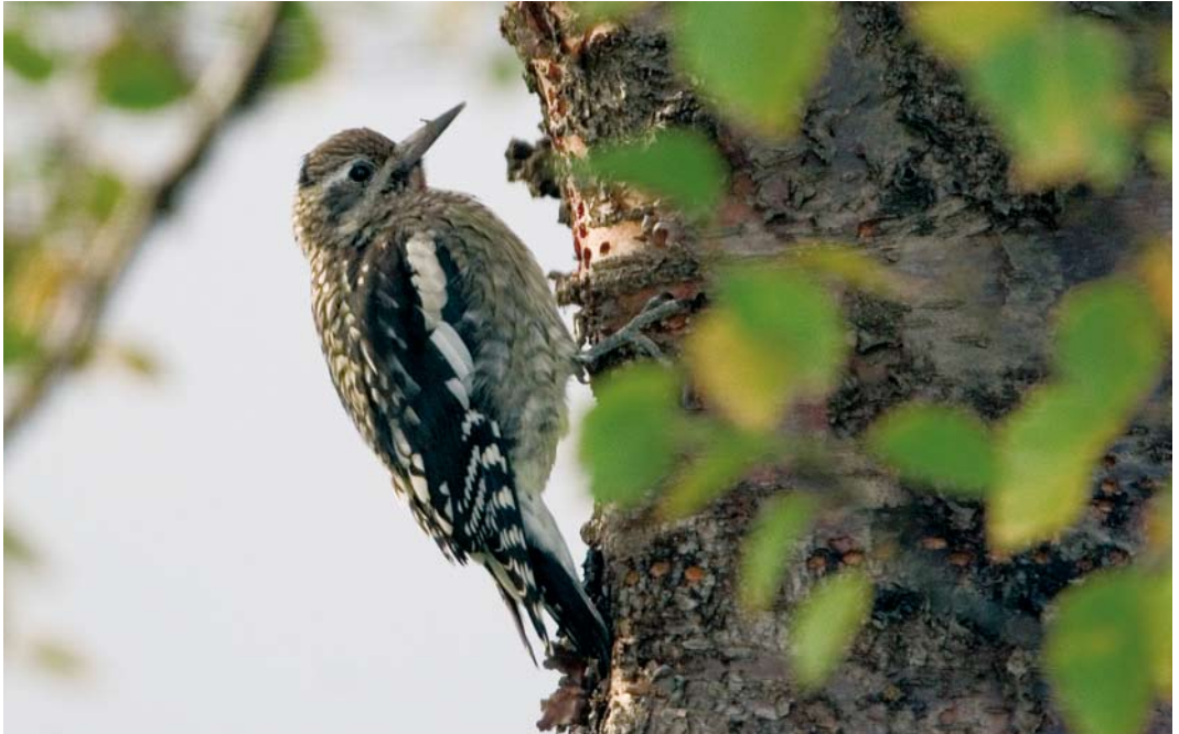
551 Yellow-bellied Sapsucker / Geelbuiksapspecht Sphyrapicus varius , first-year male, Selfoss, Iceland, 8 October 2007