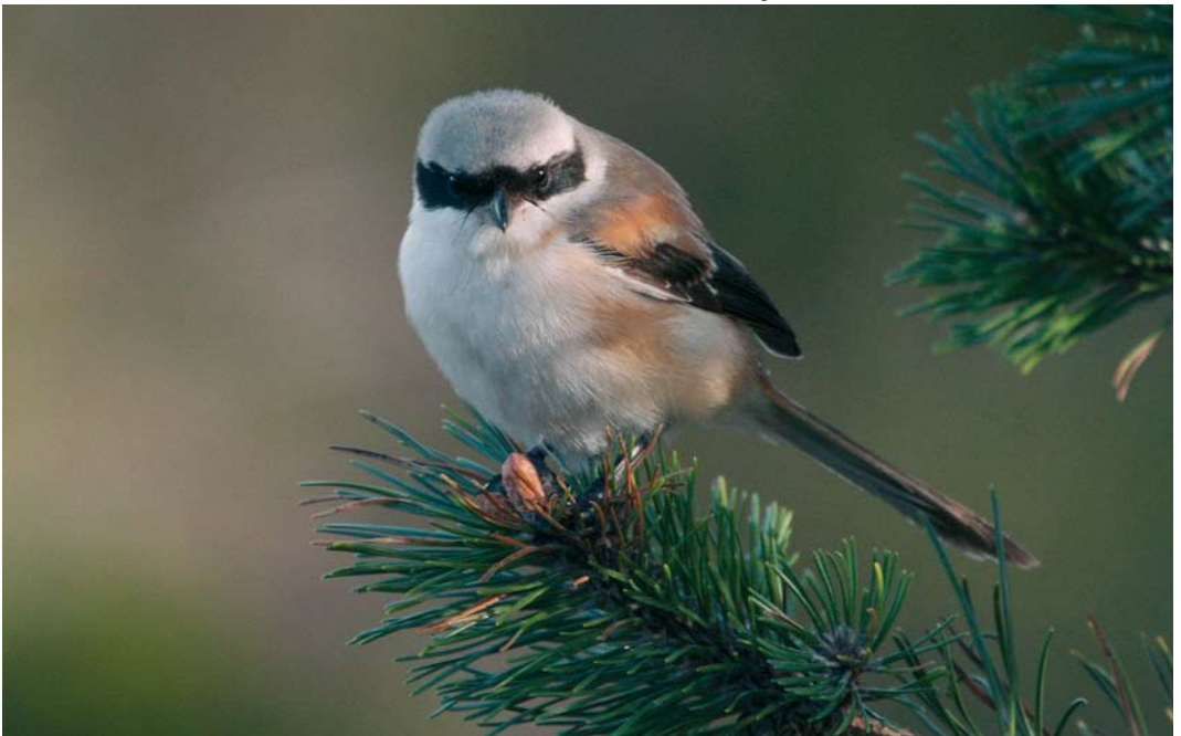
564 Long-tailed Shrike / Langstaartklauwier Lanius schach , first-year male, Skallingen, Blåvand, Vestjylland, Denmark, 17 October 2007