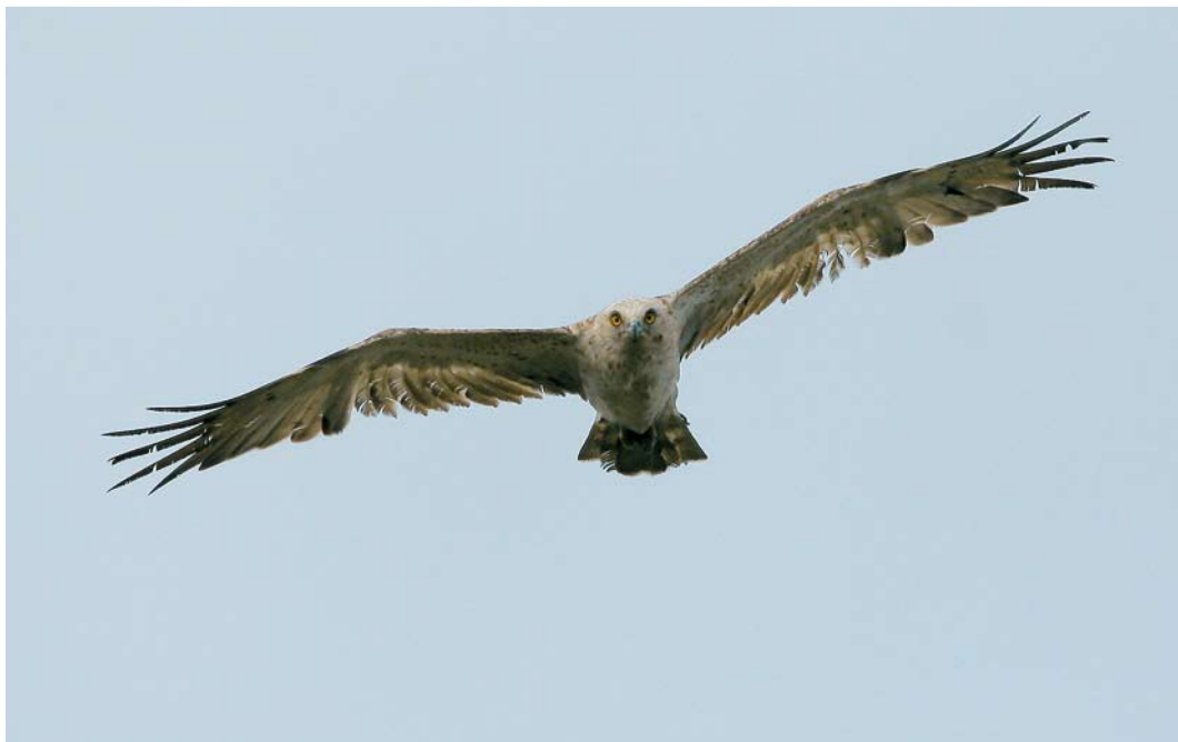
501 Short-toed Eagle / Slangenarend Circaetus gallicus , Meijndel, Zuid-Holland, 4 September 2006 (Renée de Kleijn & George Pieterse)