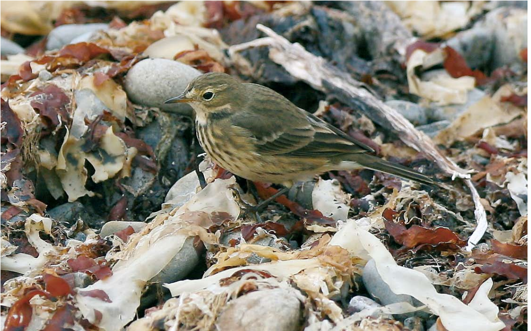
561 American Buff-bellied Pipit / Amerikaanse Waterpieper Anthus rubescens rubescens , Liscannor, Clare, Ireland, 8 October 2007 (Michael Davis)