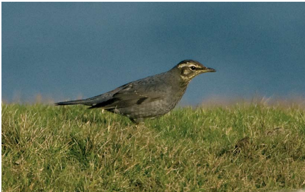
565 Siberian Thrush / Siberische Lijster Zosterorhiza sibirica , immature male, Hametoun, Foula, Shetland, Scotland, 28 September 2007