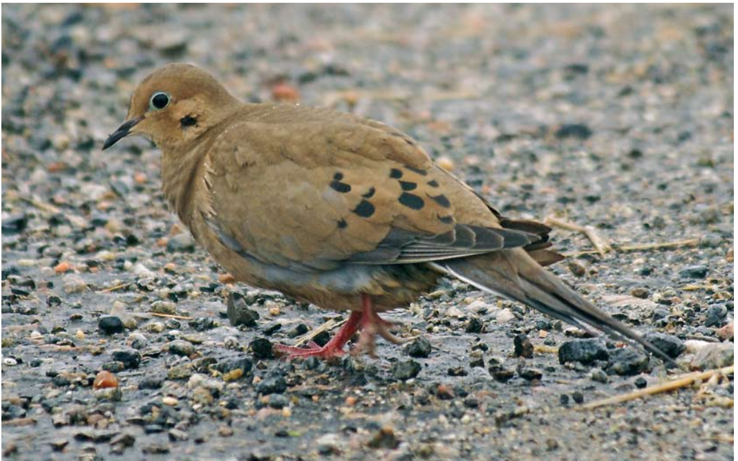
554 American Mourning Dove / Treurduif Zenaida macroura , Carnach, North Uist, Outer Hebrides, Scotland, 1 November 2007