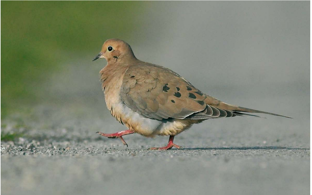
553 American Mourning Dove / Treurduif Zenaida macroura , Inishboffin, Galway, Ireland, 6 November 2007 (Tom McGeehan)