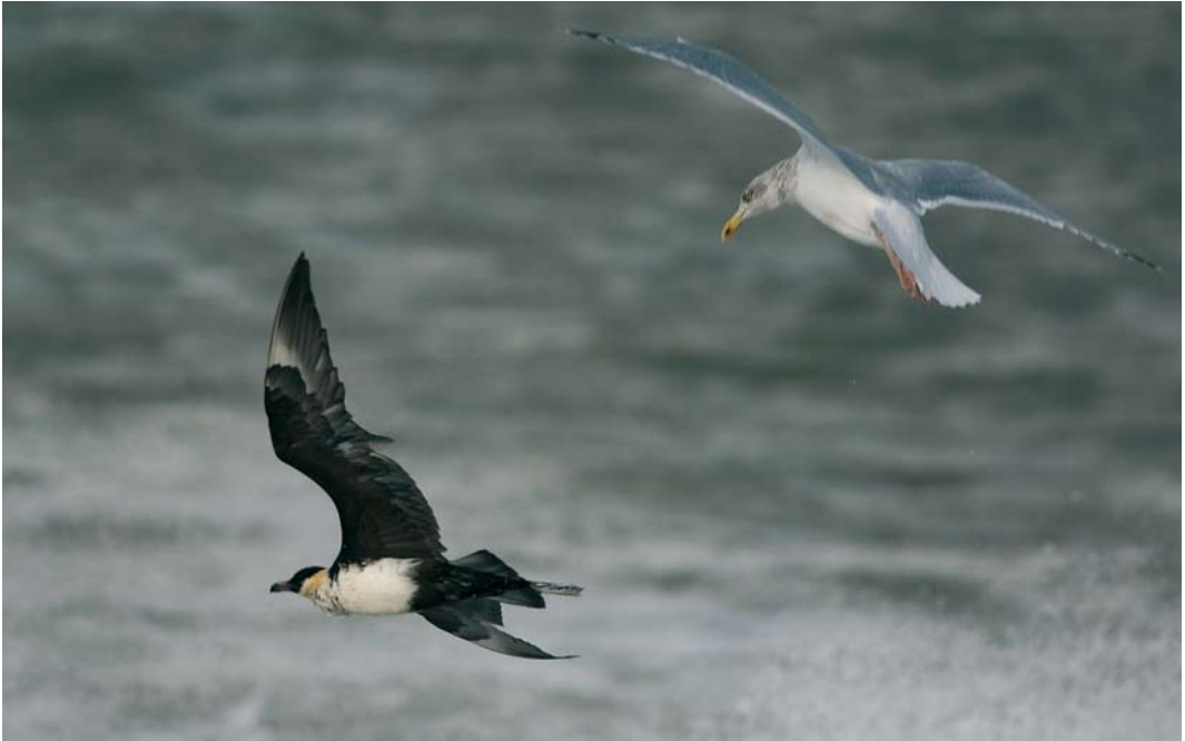
618 Middelste Jager / Pomarine Jaeger Stercorarius pomarinus , adult, met Zilvermeeuw / European Herring Gull Larus argentatus , adult, Maasvlakte, Zuid-Holland, 9 november 2007 ( Hans Gebuis )