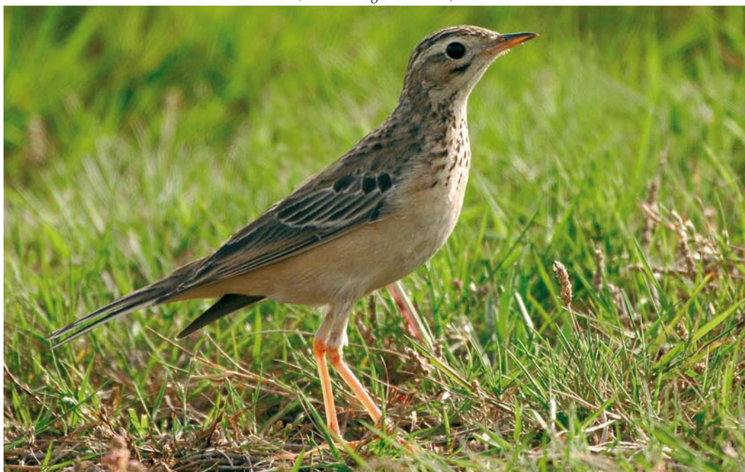
566 Blyth's Pipit / Mongoolse Pieper Anthus godlewskii , first-year, Tresco, Scilly, England, 17 October 2007