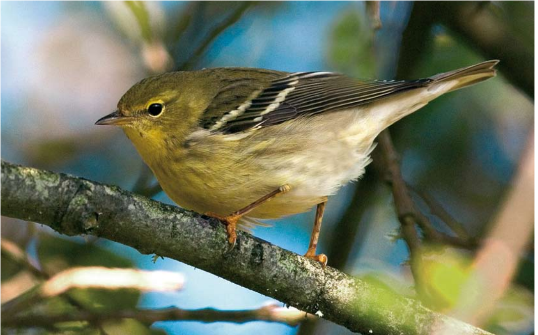
571 Blackpoll Warbler / Zwartkopzanger Dendroica striata , Port Hellick, St Mary's, Scilly, England, 19 October 2007