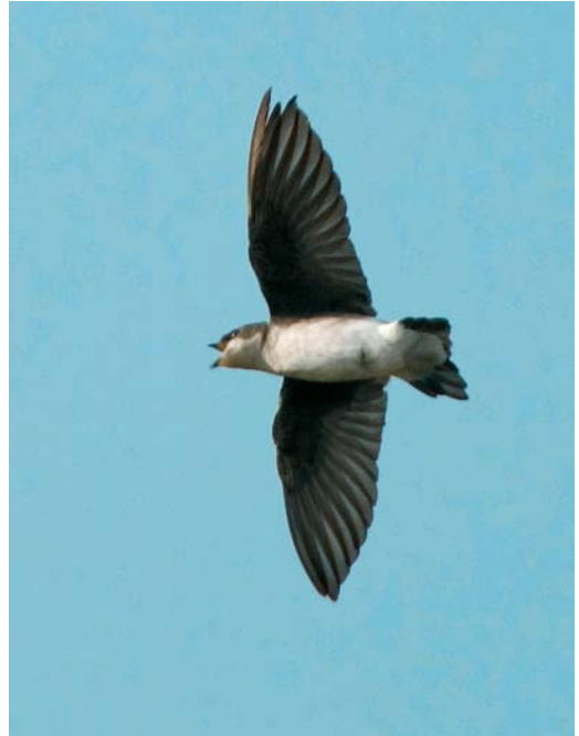
541 Green Heron / Groene Reiger Butorides virescens , adult, Berre l'Étang, Bouches-du-Rhône, France, 3 November 2007 (Amine Flitti) 542 Tree Swallow / Boomzwaluw Tachycineta bicolor , Corvo, Azores, 14 October 2007 (Vincent Legrand) 543 Sandhill Crane / Canadese Kraanvogel Grus canadensis , Nuuk, Greenland, 5 October 2007 (Carsten Egevang)