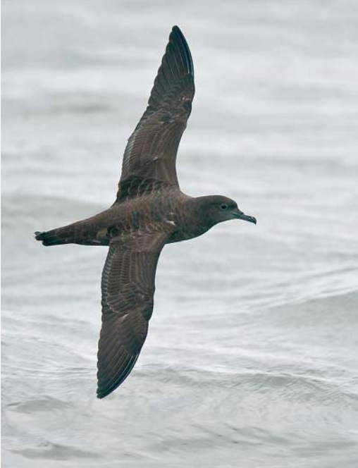
587 Grauwe Pijlstormvogel / Sooty Shearwater Puffinus griseus , Noordzee bij Hoek van Holland, Zuid-Holland, 29 september 2007 (Remco Gulien)