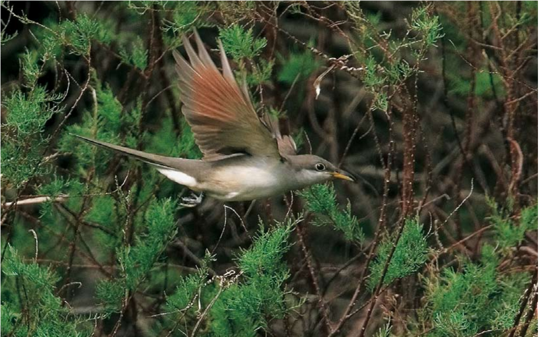
555 Yellow-billed Cuckoo / Geelsnavelkoekoek Coccyzus americanus , Corvo, Azores, 24 October 2007