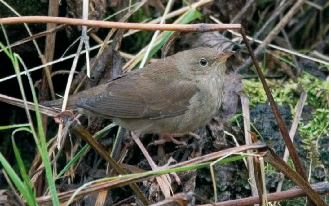
567 River Warbler / Krekelzanger Locustella fluviatilis , Vík, Mýrdalur, Iceland, 11 October 2007