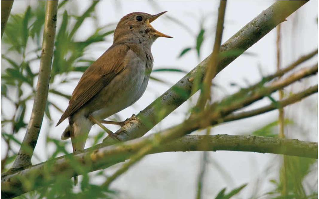
523 Thrush Nightingale / Noordse Nachtegaal Luscinia luscinia , Kessenich, Limburg, 15 May 2006 524 Paddyfield Warbler / Velddrietzanger Acrocephalus agricola , Meijendel, Zuid-Holland, 14 October 2006 525 Collared Flycatcher / Withalsvliegenvanger Ficedula albicollis , adult male, Ginkel-Noord, Gelderland, 5 June 2006