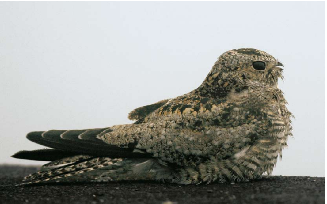
552 Common Nighthawk / Amerikaanse Nachtzwaluw Chordeiles minor , Corvo, Azores, 25 October 2007