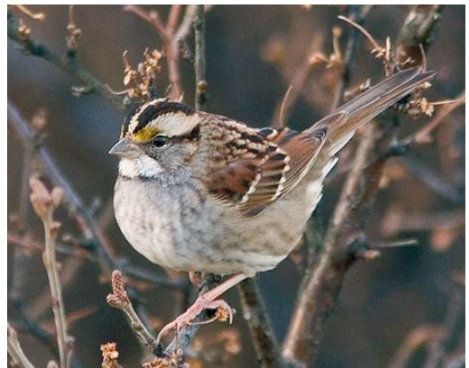
573 Scarlet Tanager / Zwartvleugeltangare Piranga olivacea , Corvo, Azores, 20 October 2007 (Vincent Legrand) 574 Grey-cheeked Thrush / Grijswangdwerglijster Catharus minimus , Poco d'Aqua, Corvo, Azores, 22 October 2007 (Vincent Legrand) 575 White's Thrush / Goudlijster Zoothera aurea , Sumburgh, Shetland, Scotland, 13 October 2007 (Hugh Harrop) 576 Red-flanked Bluetail / Blauwstaart Tarsiger cyanurus , first-year male, Linosa, Sicilia, Italy, 21 October 2007 (Igor Maierano) 577 Yellow-browed Bunting / Geelbrauwgors Emberiza chrysophrys , Gambell, Alaska, USA, 15 September 2007 (Paul Mayer) 578 White-throated Sparrow / Witkeelgors Zonotrichia albicollis , Höfn, Iceland, 13 November 2007 (Yann Kolbeinsson)