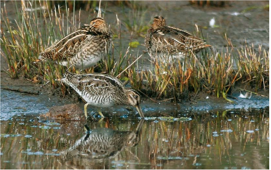
539 Wilson's Snipe / Amerikaanse Watersnip Gallinago delicata , with Common Snipes / Watersnippen G. gallinago , Lower Moors, St Mary's, Scilly, England, 11 October 2007