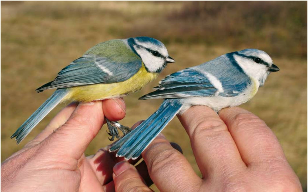
621 'Pleskes Mees' / 'Pleske's Tit' Cyanistes cyanus x caeruleus , met Pimpelmees / European Blue Tit C caeruleus , Castricum, Noord-Holland, 15 november 2007

Deze vangst betreft het tweede geval van 'Pleskes Mees' in Nederland. Op 9 november 1968 werd het eerste exemplaar gevangen op de Bremerbergdijk, Flevoland (Limosa 42: 201-205, 1969). In Dutch Birding 16: 232-234, 1994, werd een overzicht gegeven van vangsten en waarnemingen van 'Pleskes Mees' in Europa; dit werd aangevuld met een oud geval in België in decem-