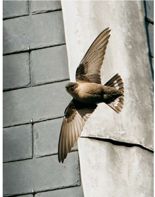
503 Black-winged Pratincole / Steppeworkstaartplevier Pratincola nordmanni , Eemnes, Utrecht, 17 October 2006 ( Michel Veldt ) 504 Eurasian Crag Martin / Rotszwaluw Ptyonoprogne rupestris , Hoorn, Noord-Holland, 18 November 2006 ( Roland Jansen ) 505 Solitary Sandpiper / Amerikaanse Bosruiter Tringa solitaria solitaria , Wissenkerke, Zeeland, 15 May 2006 ( Patrick Palmen )