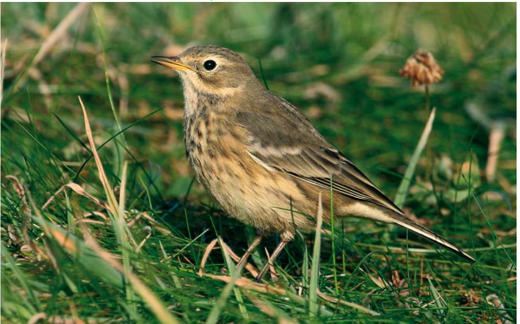
562 American Buff-bellied Pipit / Amerikaanse Waterpieper Anthus rubescens rubescens , Ouessant, Finistère, France, 26 September 2007 (Aurélien Audevard)