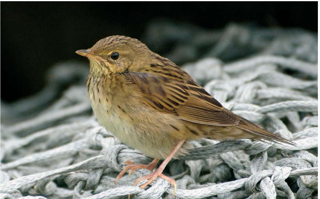
568 Lanceolated Warbler / Kleine Sprinkhaanzanger Locustella lanceolata , Fair Isle, Shetland, Scotland, 3 October 2007