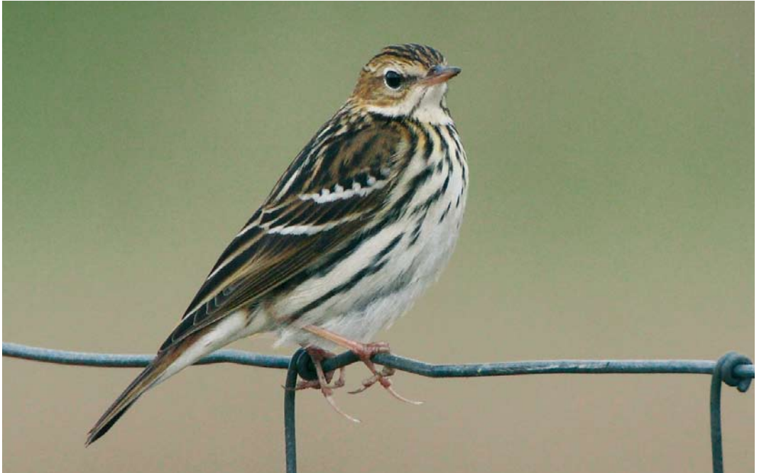
559 Pechora Pipit / Petsjorapieper Anthus gustavi , Toab, Shetland, Scotland, 13 October 2007