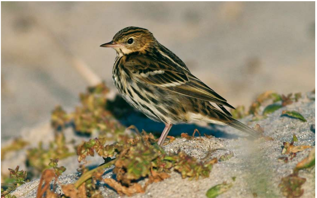
560 Pechora Pipit / Petsjorapieper Anthus gustavi , Helgoland, Schleswig-Holstein, Germany, 4 October 2007