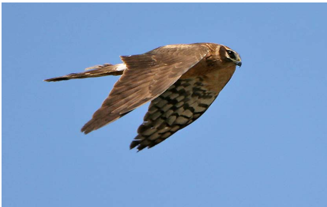
502 Pallid Harrier / Steppekiekendief Circus macrourus , second calendar-year female, De Cocksdoop, Texel, Noord-Holland, 12 May 2006