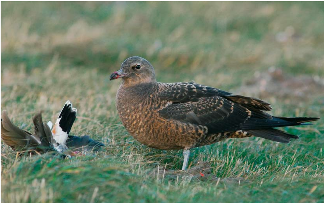
619 Middelste Jager / Pomarine Jaeger Stercorarius pomarinus , juveniel, Eemshaven, Groningen, 10 november 2007 ( Roef Mulder )