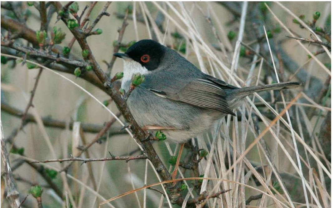
527 Sardinian Warbler / Kleine Zwartkop Sylvia melanocephala , male, Hargen aan Zee, Noord-Holland, 27 April 2006