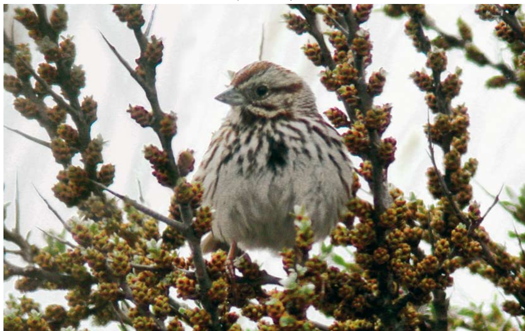
535 Song Sparrow / Zanggors Melospiza melodia , Kabellaarsbank, Zuid-Holland, 30 April 2006