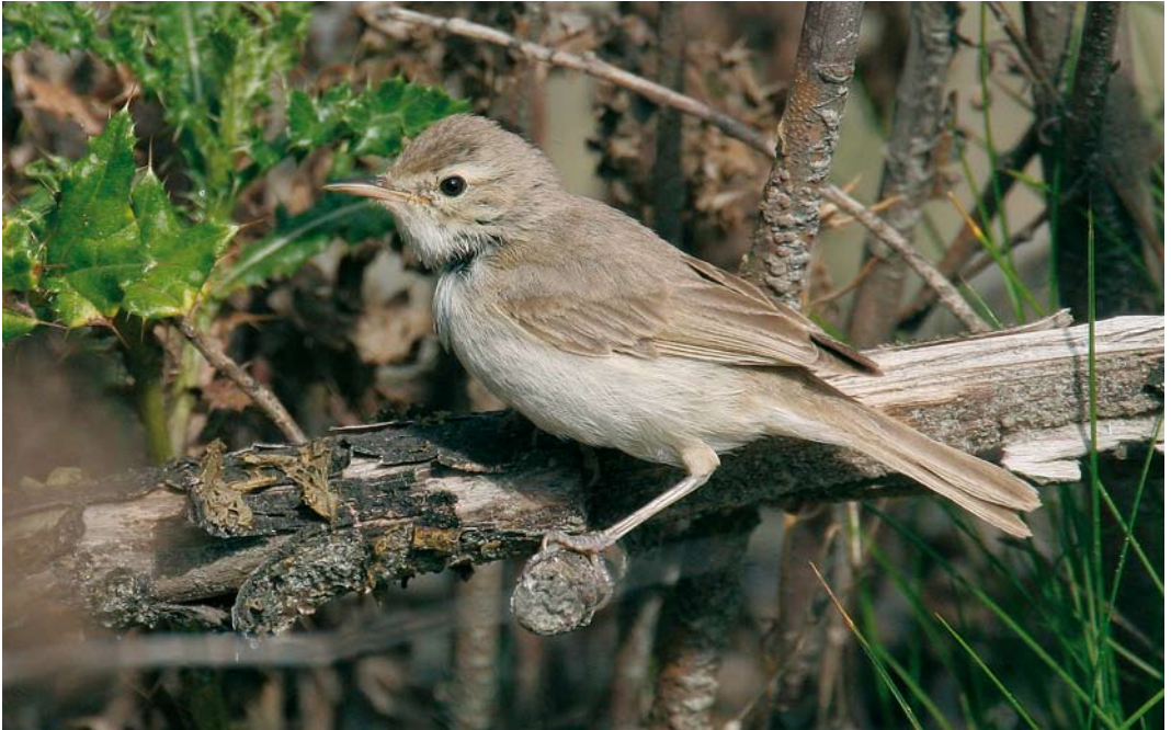
526 Booted Warbler / Kleine Spotvogel Acrocephalus caligatus , Maasvlakte, Zuid-Holland, 9 October 2006