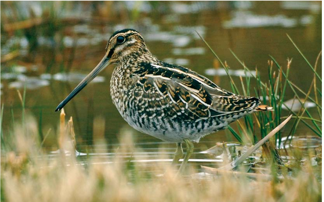
540 Wilson's Snipe / Amerikaanse Watersnip Gallinago delicata , Lower Moors, St Mary's, Scilly, England, 12 October 2007