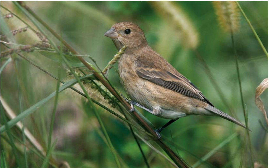
572 Indigo Bunting / Indigogors Passerina cyanea , Ribeira de Ponte, Corvo, Azores, 22 October 2007