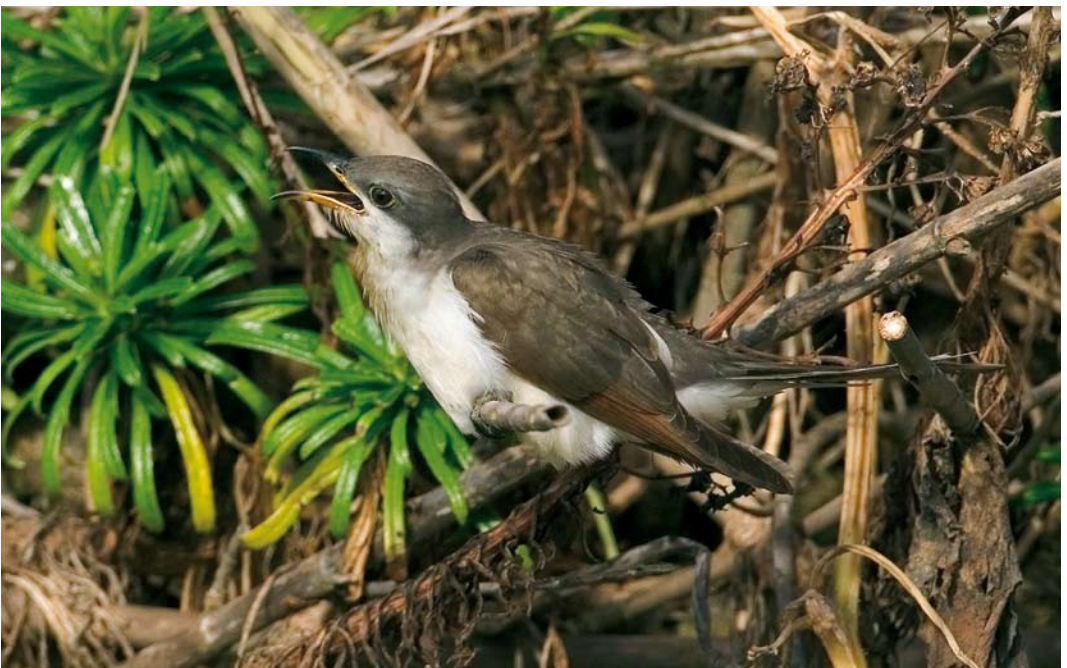
556 Yellow-billed Cuckoo / Geelsnavelkoekoek Coccyzus americanus , Corvo, Azores, 26 October 2007 (Rafael Armada)