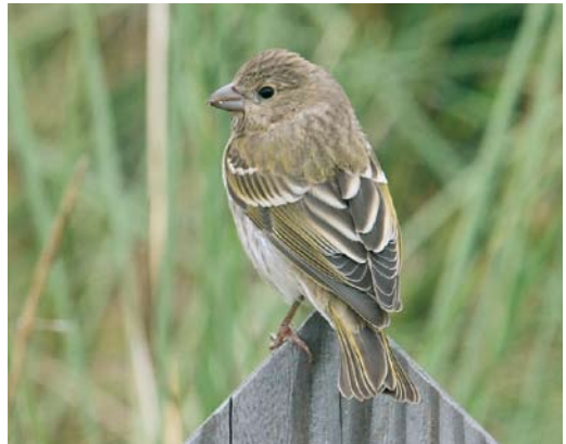
596 Grote Kruisbek / Parrot Crossbill Loxia pytyopsittacus , Vlieland, Friesland, 12 oktober 2007 ( Han Zevenhuizen ) 597 Siberische Boompieper / Olive-backed Pipit Anthus hodgsoni , Terschelling, Friesland, 13 oktober 2007 ( Rudy Offereins ) 598 Bruine Boszanger / Dusky Warbler Phylloscopus fuscatus , Vlieland, Friesland, 13 oktober 2007 ( Marc Guyt/Agami ) 599 Aziatische Roodborsttapuit / Siberian Stonechat Saxicola maurus , Texel, Noord-Holland, 20 oktober 2007 ( Eric Menkveld ) 600 Bosgors / Rustic Bunting Emberiza rustica , Vlieland, Friesland, 7 oktober 2007 ( Arnold Wijker ) 601 Roodmus / Common Rosefinch Carpodacus erythrinus , Vlieland, Friesland, 30 september 2007 ( Han Zevenhuizen )