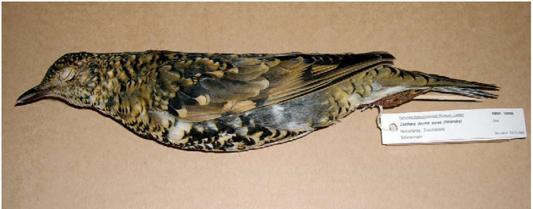
520 Subalpine Warbler / Baardgrasmus Sylvia cantillans , male, Maasvlakte, Zuid-Holland, 11 May 2006 521 Eastern Subalpine Warbler / Oostelijke Baardgrasmus Sylvia cantillans albistriata , male, De Uithof, Den Haag, Zuid-Holland, 28 May 2004 522 White's Thrush / Goudlijster Zoothera aurea (found dead at Scheveningen, Zuid-Holland, on 29 October 2005), Nationaal Natuurhistorisch Museum - Naturalis, Leiden, Zuid-Holland, 23 October 2007

photographed, sound-recorded (E van Saane, P van der Wielen, A B van den Berg et al; The Sound Approach archives; van den Berg et al 2006; Dutch Birding 28: 186, plate 263, 2006); 22 April, Flevocentrale, Lelystad , Flevoland, male, photographed, sound-recorded, videoed (A Vink, D Groenendijk, W Janssen et al; van den Berg et al 2006; Dutch Birding 28: 193, plate 274, 2006).