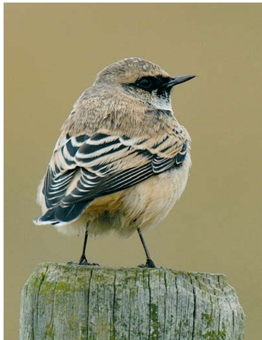
602 Roodkopklauwier / Woodchat Shrike Lanius senator , eerstejaars, Posthuis, Vlieland, Friesland, 7 oktober 2007 603-604 Bonte Tapuit / Pied Wheatear Oenanthe pleschanka , De Cocksdorp, Texel, Noord-Holland, 3 oktober 2007