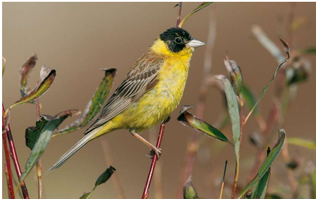
534 Black-headed Bunting / Zwartkopgors Emberiza melanocephala , male, Brouwersdam, Zeeland, 17 October 2006