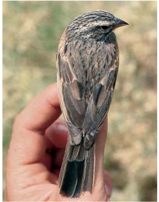
16 Striated Bunting / Gestreepte Gors Emberiza striolata , female, Eilat, Israel, April 1990 ( Hadoram Shirihi ). Same bird as in plate 14 and 18.