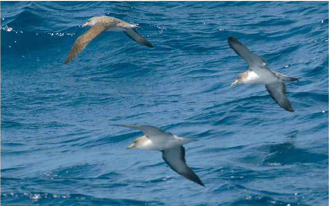
45 Cory's Shearwaters / Kuhls Pijlstormvogels Calonectris borealis , Madeira, 20 October 2006