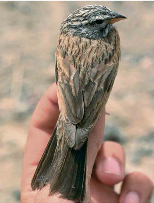
15 Striated Bunting / Gestreepte Gors Emberiza striolata , male, Eilat, Israel, April 1990. Same bird as in plate 13 and 17.