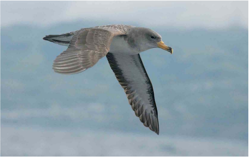
44 Cory's Shearwater / Kuhls Pijlstormvogel Calonectris borealis , São Miguel, Azores, 17 October 2006. Note pale scaling on upperwing and dark markings of under primary coverts.