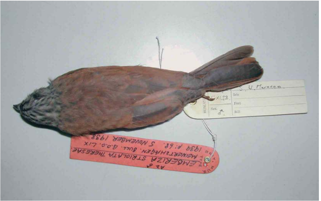
9-10 Male (holotype) of Emberiza sahari theresae , dorsal and ventral views (collected at Andja, south-western Morocco, in November 1938), Natural History Museum, Tring, England, March 2005