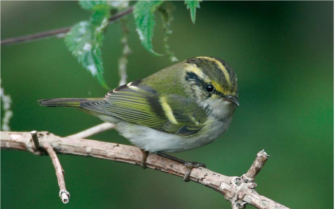
609 Pallas' Boszanger / Pallas's Leaf Warbler Phylloscopus proregulus , Zeebrugge, West-Vlaanderen, 21 oktober 2007