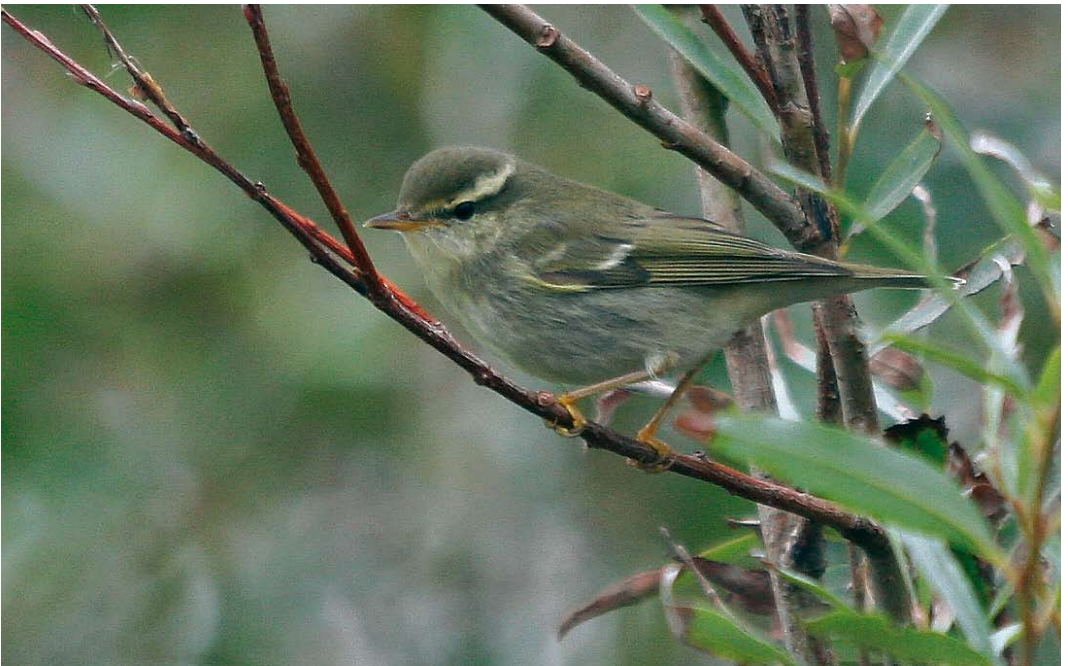
610 Noordse Boszanger / Arctic Warbler Phylloscopus borealis , Raversijde, West-Vlaanderen, 3 oktober 2007 (Johan Buckens)