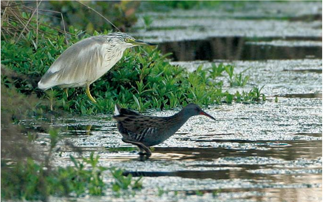
585 Ralreiger / Squacco Heron Ardeola ralloides , met Waterral / Water Rail Rallus aquaticus , Willeskop, Utrecht, 23 oktober 2007 586 Grote Aalscholver / Atlantic Great Cormorant Phalacrocorax carbo carbo (onder), met Aalscholver / Continental Great Cormorant P c sinensis , IJmuiden, Noord-Holland, 27 september 2007