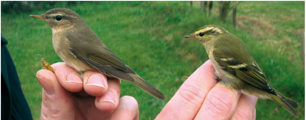
606 Kleine Spotvogel / Booted Warbler Acrocephalus caligatus , Maasvlakte, Zuid-Holland, 15 september 2007 607 Kroonboszanger / Eastern Crowned Warbler Phylloscopus coronatus , Katwijk aan Zee, Zuid-Holland, 5 oktober 2007 608 Bruine Boszanger / Dusky Warbler Phylloscopus fuscatus en Bladkoning / Yellow-browed Warbler P inornatus , Meijendel, Zuid-Holland, 13 oktober 2007

september elders, barstte de doortrek los op 30 september met op die dag al negen exemplaren. In de eerste twee weken van oktober volgden er c 240 (!), met bijvoorbeeld alleen al 18 op 14 oktober op Vlieland. Tot 22 september volgden er nog eens ruim 60 en daarna tot het eind van de maand nog enkelingen. Vlieland was hét eiland van de phylloscopen dit najaar met van 26 tot 29 oktober ook nog een Humes Bladkoning P humei bij Lange Paal en op 13 oktober een Raddes Boszanger P schwarzi bij Bomenland. Op 14 oktober werd op Schiermonnikoog een Raddes gevangen die op 17 oktober nogmaals in het net hing. Op 29 september was er een vroege melding van een Bruine Boszanger P fuscatus op Vlieland. Er volgden exemplaren op 7 en 8 oktober bij de Eemshaven; op 13 oktober in Meijendel, Zuid-Holland, en één op Vlieland (op 50 m van de eerder gemelde Raddes Boszanger); op 17 oktober bij Dishoek, Zeeland; op 19 en 21 vangsten op (alweer) Vlieland; op