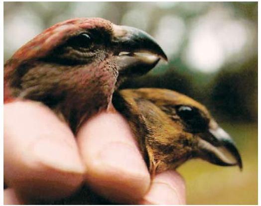
528 Daurian Shrike / Daurische Klauwier Lanius isabellinus , adult female, Maasvlakte, Zuid-Holland, 27 August 2006 529 Daurian Shrike / Daurische Klauwier Lanius isabellinus , adult male, Den Hoorn, Texel, Noord-Holland, 26 September 2006 530 Purple-backed Starling / Daurische Spreeuw Sturnus sturninus , first-winter male, Oost-Vlieland, Vlieland, Friesland, 12 October 2005 531 Purple-backed Starling / Daurische Spreeuw Sturnus sturninus , first-winter male, Oost-Vlieland, Vlieland, Friesland, 12 October 2005 532 Arctic Redpoll / Witstuitbarmsijs Carduelis hornemanni , IJmuiden, Noord-Holland, 27 January 2006 533 Parrot Crossbill / Grote Kruisbek Loxia pytyopsittacus , male (left), with Common Crossbill / Kruisbek L. curvirostra , Tongeren, Gelderland, 12 February 2006