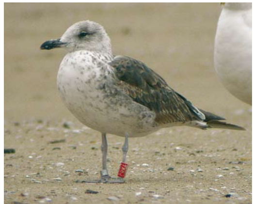
506 Squacco Heron / Ralreiger Ardeola ralloides , Lentevreugd, Wassenaar, Zuid-Holland, 19 June 2006 507 Slender-billed Gull / Dunbekmeeuw Larus genei , Enkhuizen, Noord-Holland, 6 May 2006 508 Greater Sand Plover / Woestijnplevier Charadrius leschenaultii , first-winter, IJmuiden, Noord-Holland, 4 August 2006 509 Baltic Gull / Baltische Mantelmeeuw Larus fuscus fuscus , first-summer, Erasmusgracht, Amsterdam, Noord-Holland, 25 June 2005

The bird at Amstelmeer represents the third October record. The species has been recorded annually since 1999, best years being 2001 (six) and 2004 (five).