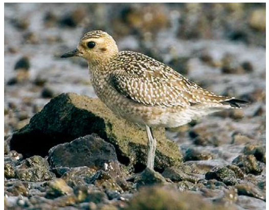
545 American Black Tern / Amerikaanse Zwarte Stern Chlidonias niger surinamensis , Rashane Turlough, Galway, Ireland, 2 September 2007 ( Michael Davis ) 546 White-winged Tern / Witvleugelstern Chlidonias leucopterus , juvenile, Ponta Delgada, São Miguel, Azores, 9 October 2007 ( Dominic Mitchell ) 547 Semipalmated Sandpiper / Grijze Strandloper Calidris pusilla , Vistula mouth, Gdąnsk, Poland, 30 September 2007 ( Zbyszek Kajzer ) 548 Western Sandpiper / Alaskastrandloper Calidris mauri and Semipalmated Sandpiper / Grijze Strandloper C. pusilla , Lagoa Azul, São Miguel, Azores, 15 October 2007 ( Dominic Mitchell ) 549 Sharp-tailed Sandpiper / Siberische Strandloper Calidris acuminata , Ballycotton, Cork, Ireland, 5 October 2007 ( Paul & Andrea Kelly/irishbirdimages.com ) 550 Pacific Golden Plover / Aziatische Goudplevier Pluvialis fulva , Cabo da Praia, Terceira, Azores, 30 October 2007 ( Rafael Armada )