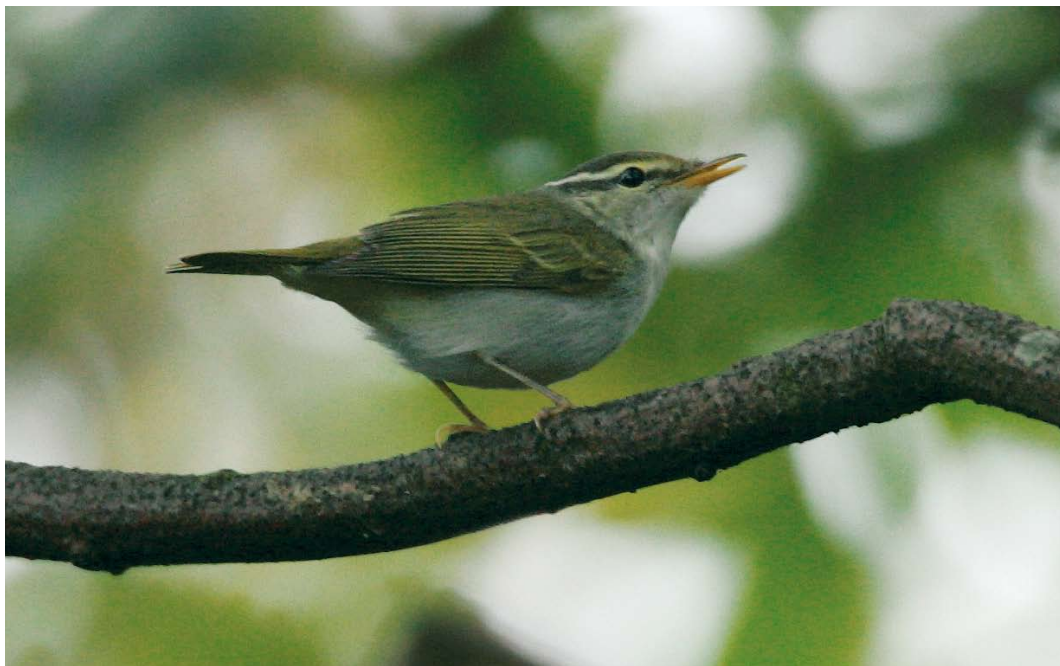
612 Kroonboszanger / Eastern Crowned Warbler Phylloscopus coronatus , Katwijk aan Zee, Zuid-Holland, 5 oktober 2007