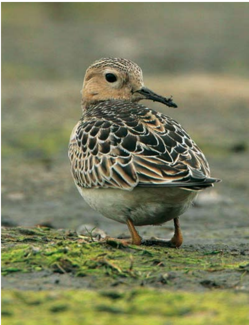
588 Blonde Ruiters / Buff-breasted Sandpiper Tryngites subruficollis , Petten, Noord-Holland, 8 oktober 2007 (Michel Veldt)