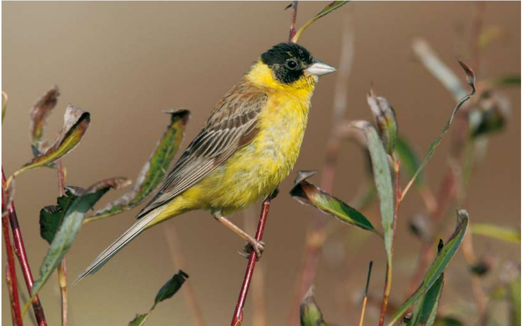
534 Black-headed Bunting / Zwartkopgors Emberiza melanocephala , male, Brouwersdam, Zeeland, 17 October 2006