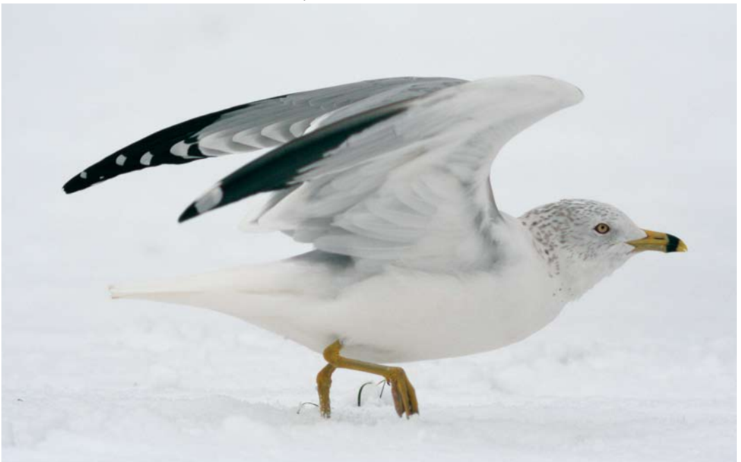
500 Ring-billed Gull / Ringsnavelmeeuw Larus delawarensis , adult, Tiel, Gelderland, 3 March 2006