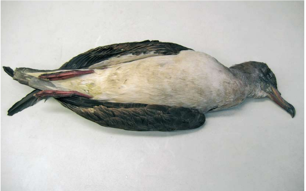
499 Cory's Shearwater / Kuhls Pijlstormvogel Calonectris borealis (found at Lith, Noord-Brabant, on 10 July 2006), Wageningen, Gelderland, 14 October 2006 (Wouter van Gestel)