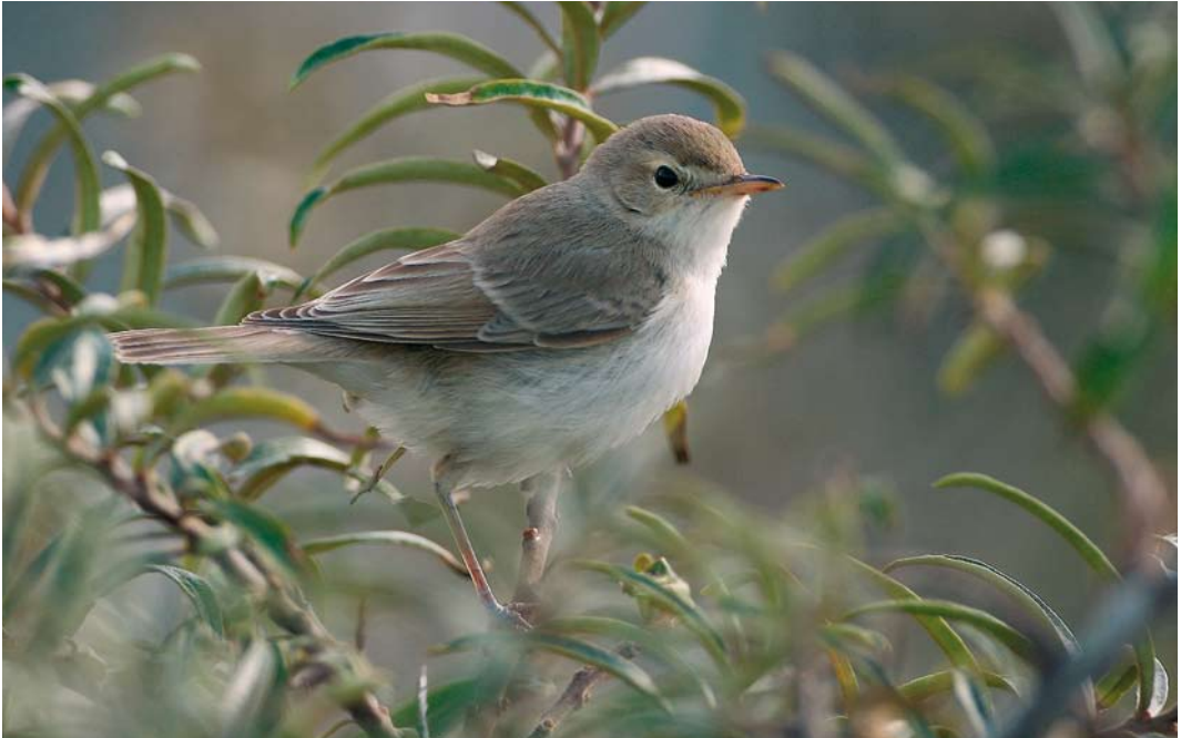
605 Kleine Spotvogel / Booted Warbler Acrocephalus caligatus , Maasvlakte, Zuid-Holland, 15 september 2007 (Christiaan Giljam)