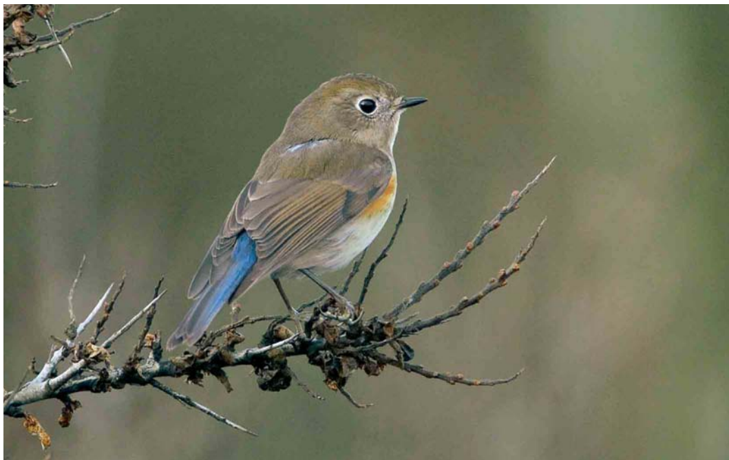
101 Blauwstaart / Red-flanked Bluetail Tarsiger cyanurus , eerste-winter mannetje, Zandvoort, Zuid-Holland, 8 januari 2007 ( Christiaan Giljam )