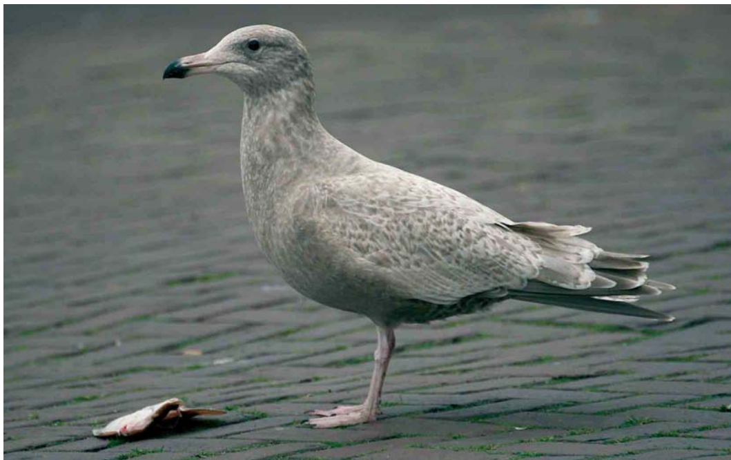
81 Hybride Grote Burgemeester x Zilvermeeuw / hybrid Glaucous x European Herring Gull Larus hyperboreus x argentatus , eerste-winter, IJmuiden, Noord-Holland, 28 december 2006 (Mars Muusse)