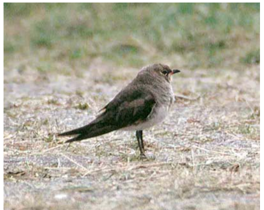
25 Oosterse Vorkstaartplevier / Oriental Pratincole Glareola maldivarum , Doniaburen, Friesland, 2 augustus 1997 26-27 Oosterse Vorkstaartplevier / Oriental Pratincole Glareola maldivarum , Doniaburen, Friesland, 2 augustus 1997 28-29 Oosterse Vorkstaartplevier / Oriental Pratincole Glareola maldivarum , Doniaburen, Friesland, 2 augustus 1997 30 Oosterse Vorkstaartplevier / Oriental Pratincole Glareola maldivarum , Doniaburen, Friesland, 1 augustus 1997