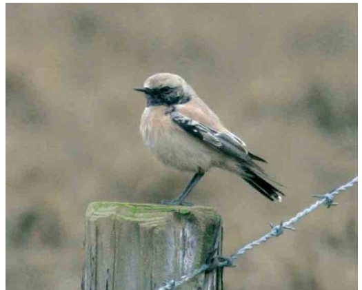
87 Bruine Boszanger / Dusky Warbler Phylloscopus fuscatus , Castricum, Noord-Holland, 26 november 2006 ( Jan Visser ) 88 Siberische Tjiftjaf / Siberian Chiffchaff Phylloscopus collybita tristis , Huizen, Noord-Holland, 6 december 2006 ( Edwin Winkel ) 89-90 Woestijntapuit / Desert Wheatear Oenanthe deserti , mannetje, De Cocksdorp, Texel, Noord-Holland, 28 december 2006 ( Gertjan van Veldhuisen )

zwaluw Delichon urbicum op 10 december in het Verdronken land van Saeftinge, Zeeland. Maar het bleef niet bij deze drie soorten want op 5 november werden twee Rotszwaluwen Ptyonoprogne rupestris gezien bij IJburg, Noord-Holland. Indien aanvaard zouden dit wel eens de eerste twee voor Nederland kunnen zijn. Hierna werden er nog eens twee gezien op 7 november bij Westenschouwen, Zeeland, en van 14 tot 24 november waren er maximaal twee aanwezig in Hoorn, Noord-Holland, die na een wat moeizame aanloop uiteindelijk door veel vogelaars werden bekeken. Tot slot trok op 29 november nog een bijzonder late Roodstuitzwaluw Cecropis daurica over Kamperhoek, Flevoland. De doortrek van Grote Piepers Anthus richardi leverde tot 28 november nog 11 exemplaren op. Met c 60 vanaf 2 november waren Pestvogels Bombycilla garrulus aan de schaarse kant. Een Waterspreeuw Cinclus cinclus was op 9 december aanwezig langs de Hierdensche Beek, Gelderland. Een