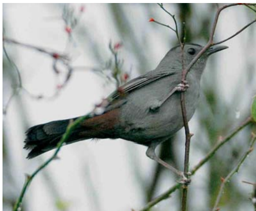
100 Katvogel / Grey Catbird Dumetella carolinensis , Kallo, Oost-Vlaanderen, 16 december 2006 (Patrick Beirens)

At present, Bugun Liocichla is only known from the type locality. Although this site has been visited frequently by ornithologists and birdwatchers, it is amazing that this liocichla with its colourful plumage and distinctive vocalizations remained unknown for so long. This may well indicate that the population, even at Eaglenest Wildlife Sanctuary, is very small. ANDRÉ J VAN LOON