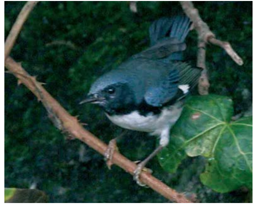
76 Black-throated Blue Warbler / Blauwe Zwartkeelzanger Dendroica caerulescens , first-winter male, Corvo, Azores, 28 October 2006 cf Dutch Birding 28: 389, 2006

on 12-30 December. The first for Switzerland turned up at Kreuzlingen, Thurgau, on 4 January.