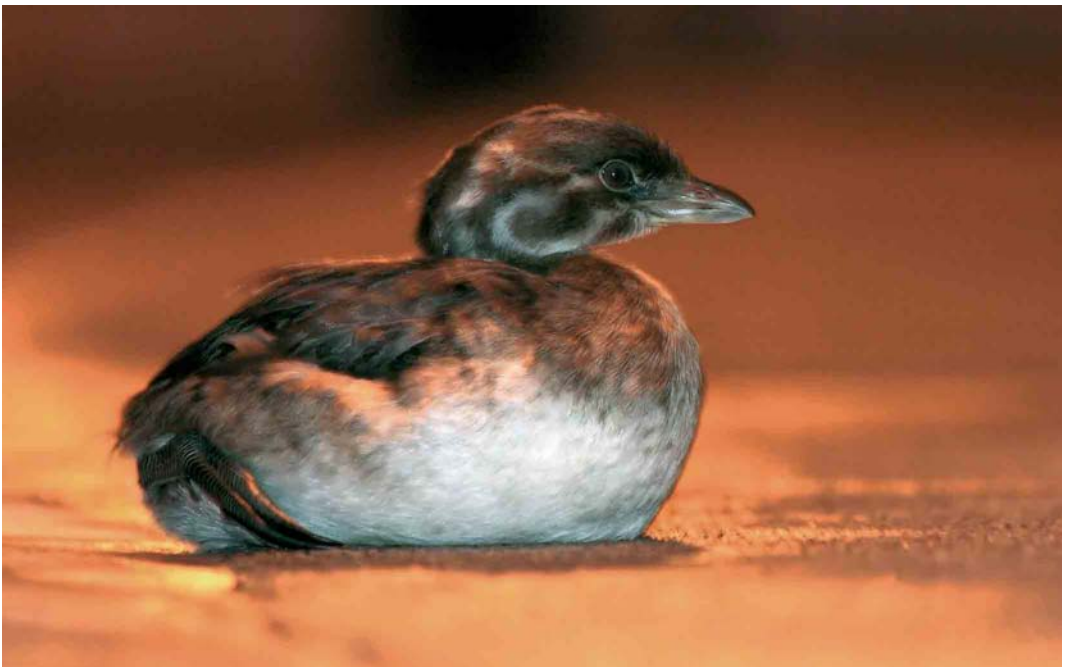
48 Pied-billed Grebe / Dikbekfuut Podilymbus podiceps , first-year, resting on the middle of a road at night, Corvo, Azores, 29 October 2006 cf Dutch Birding 28: 389, 2006