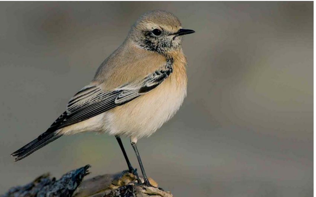
69 Desert Wheatear / Woestijntapuit Oenanthe deserti , Principina a mare, Toscana, Italy, 10 December 2006