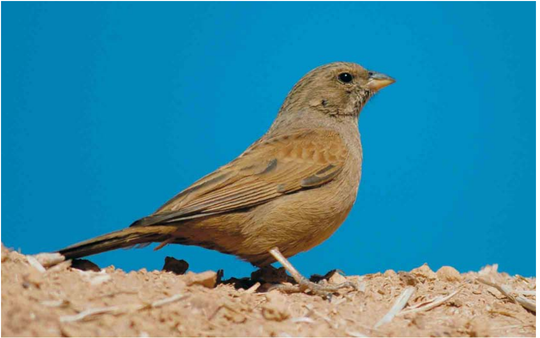
19 House Bunting / Huisgors Emberiza sahari , female, Boumalne Dadès, Dadès-Draa, Morocco, 1 April 2006 (Arnoud B van den Berg)