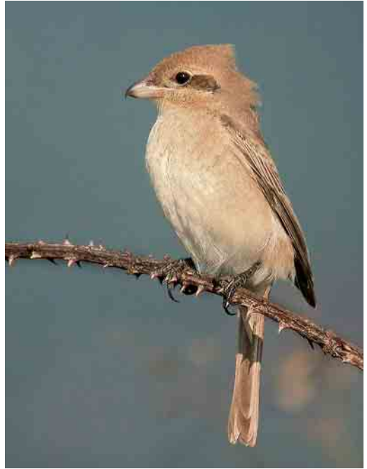
63 Chimney Swift / Schoorsteengierzwaluw Chaetura pelagica , Corvo, Azores, 29 October 2006 (Vincent Legrand) 64 Daurian Shrike / Daurische Klauwier Lanius isabellinus , first-year, Rouxique, Pontevedra, Galicia, Spain, 1 November 2006 (Daniel López Velasco) 65 Black-throated Blue Warbler / Blauwe Zwartkeelzanger Dendroica caerulescens , first-winter female, Corvo, Azores, 24 October 2006 (Vincent Legrand) cf Dutch Birding 28: 389, 2006