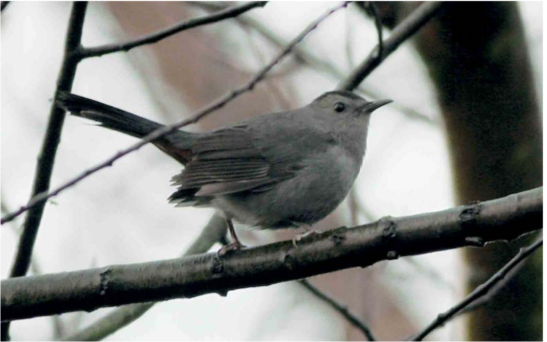
98 Katvogel / Grey Catbird Dumetella carolinensis , Kallo, Oost-Vlaanderen, 16 december 2006 (Vincent Legrand)