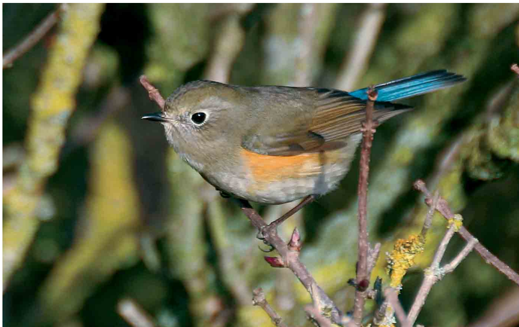
102 Blauwstaart / Red-flanked Bluetail Tarsiger cyanurus , eerste-winter mannetje, Zandvoort, Zuid-Holland, 8 januari 2007 ( Willem Pompert )