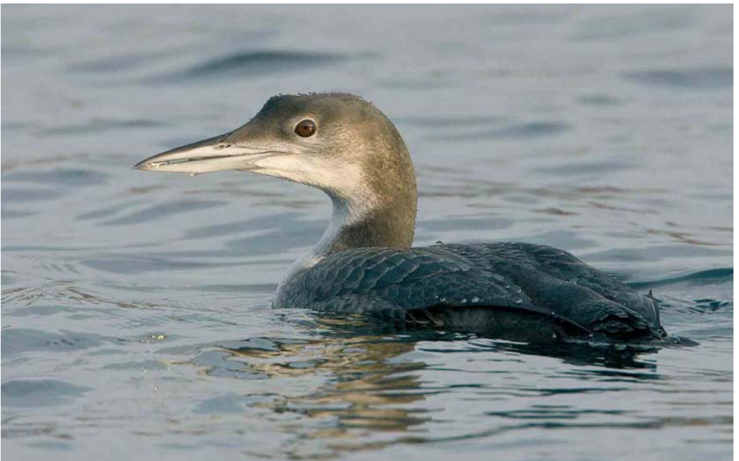
78 Ijsduiker / Great Northern Loon Gavia immer , juveniel, Westkapelle, Zeeland, 29 december 2006