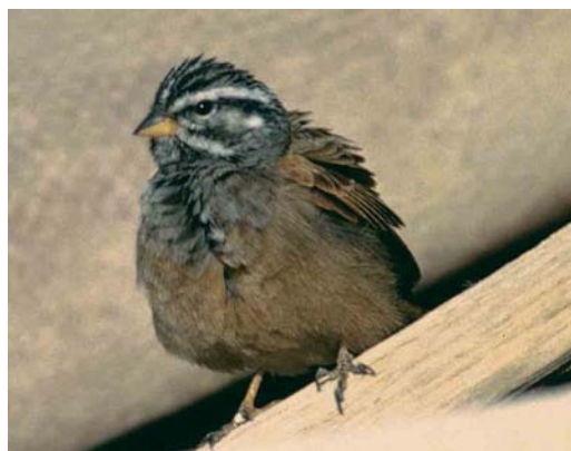
21 House Bunting / Huisgors Emberiza sahari , male, Boumalne Dadès, Dadès-Draa, Morocco, 1 April 2006 ( Arnoud B van den Berg ) 22 House Bunting / Huisgors Emberiza sahari , male, Tamri, Haha, Morocco, 1 October 2006 ( Arnoud B van den Berg ) 23 Striated Bunting / Gestreepte Gors Emberiza striolata , adult male, Eilat, Israel, January 1990 ( Hadoram Shirihai ) 24 Striated Bunting / Gestreepte Gors Emberiza striolata , adult male, Eilat, Israel, January 1990 ( Hadoram Shirihai )

purported 'hybrid' specimens are, in fact, perfectly diagnosable as members of the striolata group. Even if some of these intergrades (unexamined by us) really can be considered such, their localized occurrence and relatively stable characters might be treated as equally strong evidence of secondary contact between two species that have already diverged (cf Wiley 1981).