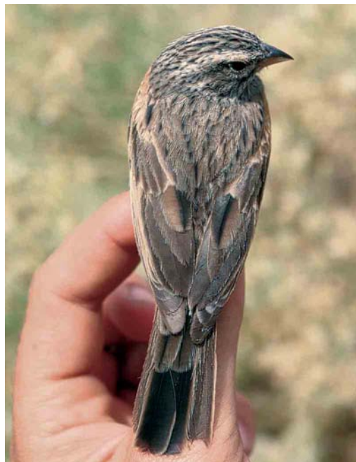
16 Striated Bunting / Gestreepte Gors Emberiza striolata , female, Eilat, Israel, April 1990. Same bird as in plate 14 and 18.