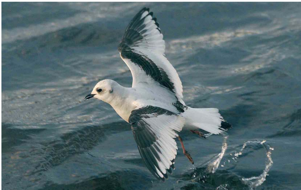
51 Ross's Gull / Ross' Meeuw Rhodostethia rosea , first-winter, Loch Caolisport, Argyll, Scotland, 30 December 2006