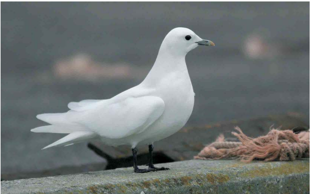
50 Ivory Gull / Ivoormeeuw Pagophila eburnea , adult, Langø Havn, Lolland, Denmark, 30 December 2006 ( Chris van Rijswijk )