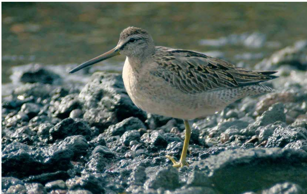
61 Short-billed Dowitcher / Kleine Grijze Snip Limnodromus griseus , first-year, Lajes do Pico, Pico, Azores, 2 November 2006 ( Frédéric Jiguet ) cf Dutch Birding 28: 389, 2006