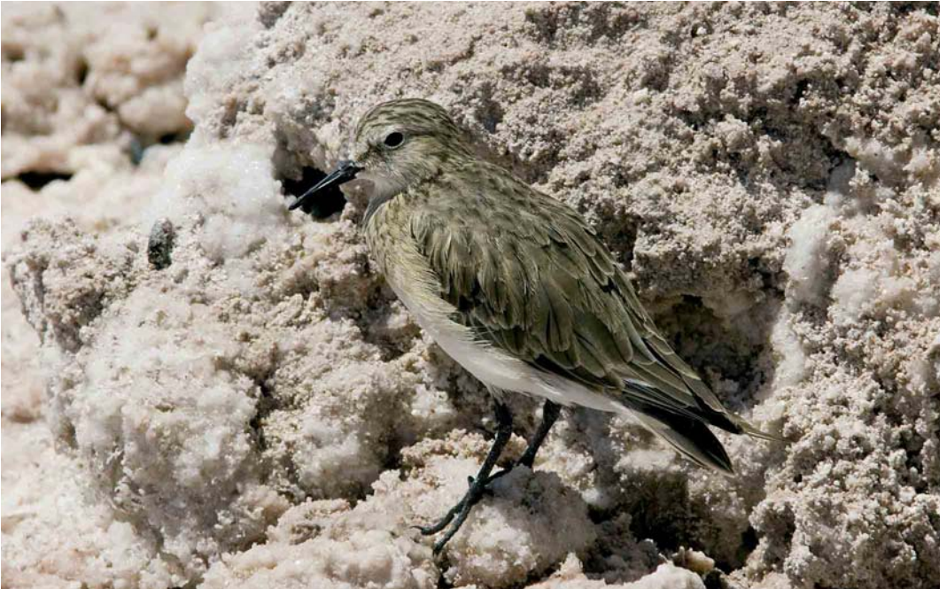
46 Baird's Sandpiper / Bairds Strandloper Calidris bairdii, San Pedro de Atacama, Chile, 25 January 2005