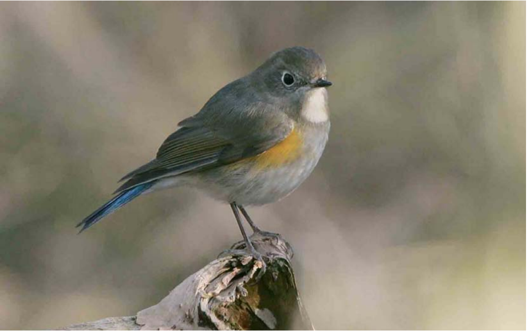
68 Red-flanked Bluetail / Blauwstaart Tarsiger cyanurus , first-winter male, Zandvoort, Zuid-Holland, Netherlands, 14 January 2007