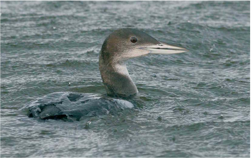
77 Ijsduiker / Great Northern Loon Gavia immer , juveniel, Harderhaven, Flevoland, 16 december 2006 (Michel Veldt)