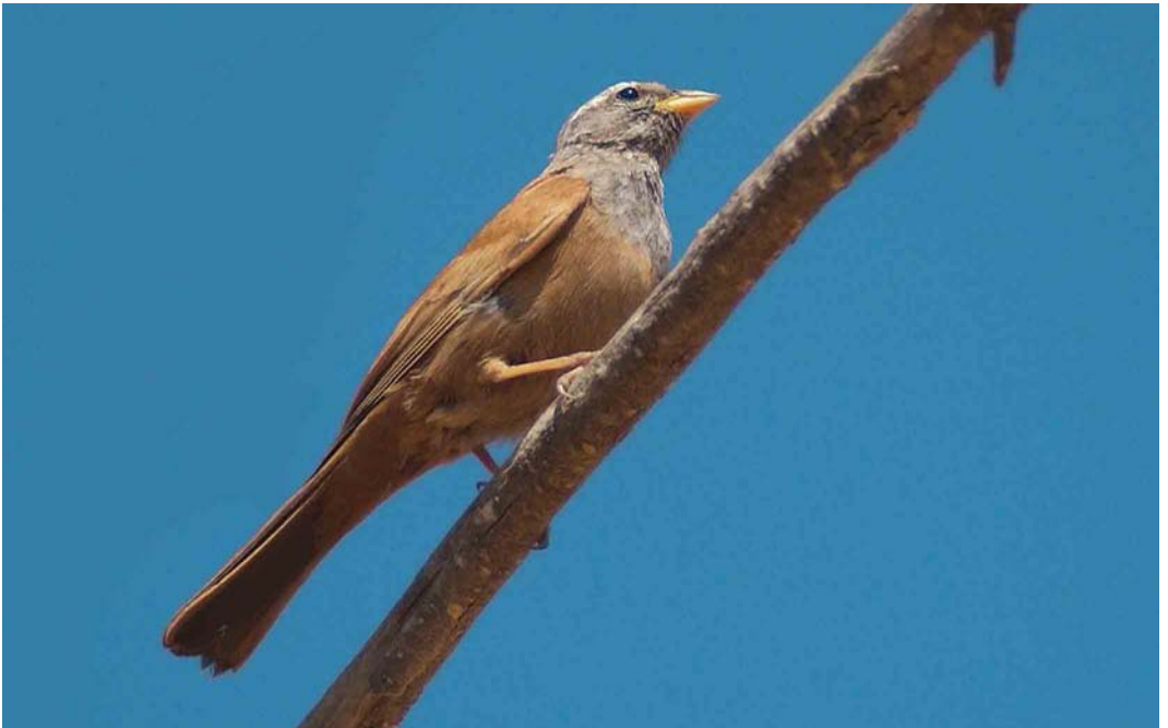
20 House Bunting / Huisgors Emberiza sahari , male, Arram, Gabès, Tunisia, 1 May 2005 (René Pop)