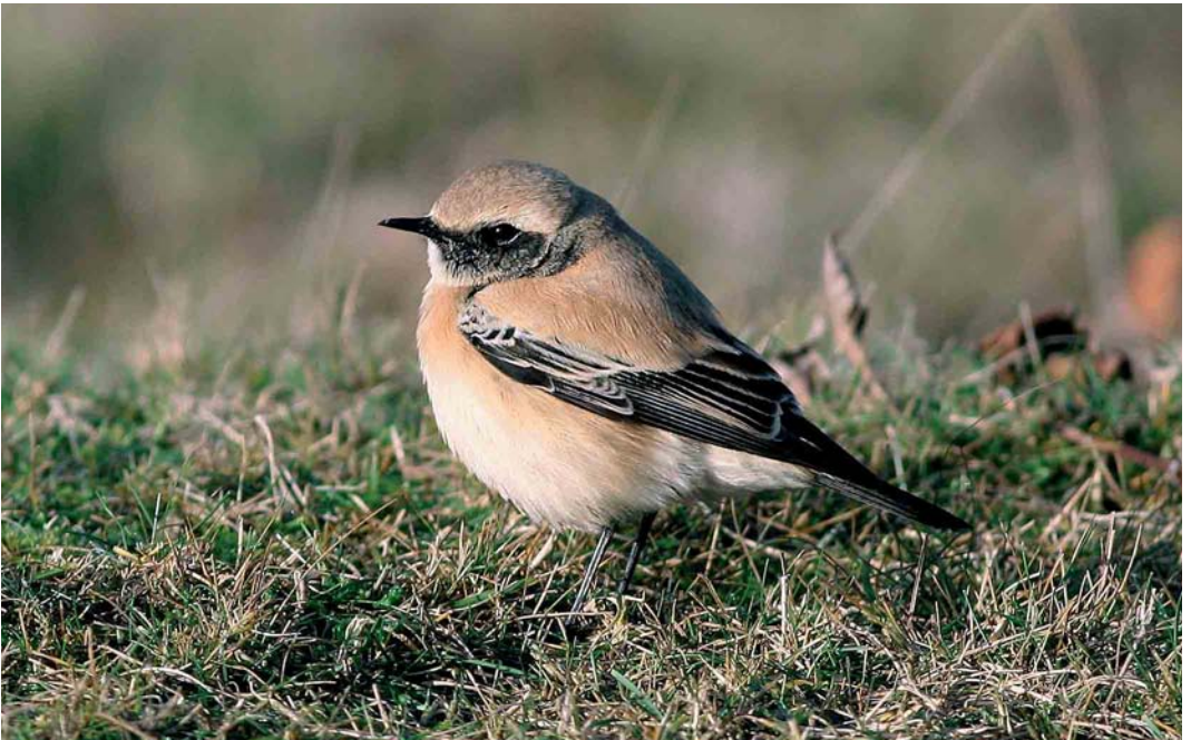
99 Woestijntapuit / Desert Wheatear Oenanthe deserti , mannetje, Het Zwin, West-Vlaanderen, 9 december 2006