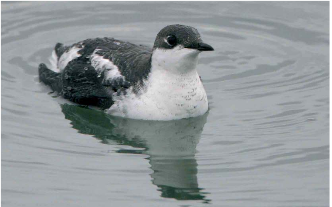
47 Long-billed Murrelet / Aziatische Marmeralk Brachyramphus perdix , Porumbacu de Jos, Transylvania, Romania, 23 December 2006 (János Oláh)