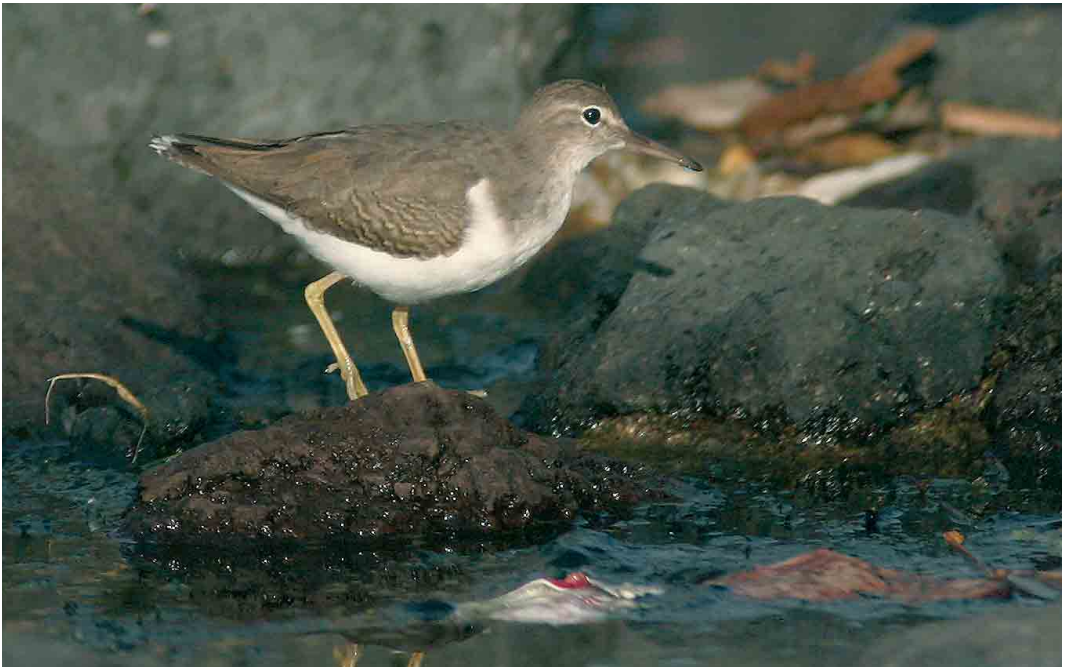
60 Spotted Sandpiper / Amerikaanse Oeverloper Actitis macularius , Madalena, Pico, Azores, 2 November 2006 (Frédéric Jiguet) cf Dutch Birding 28: 389, 2006