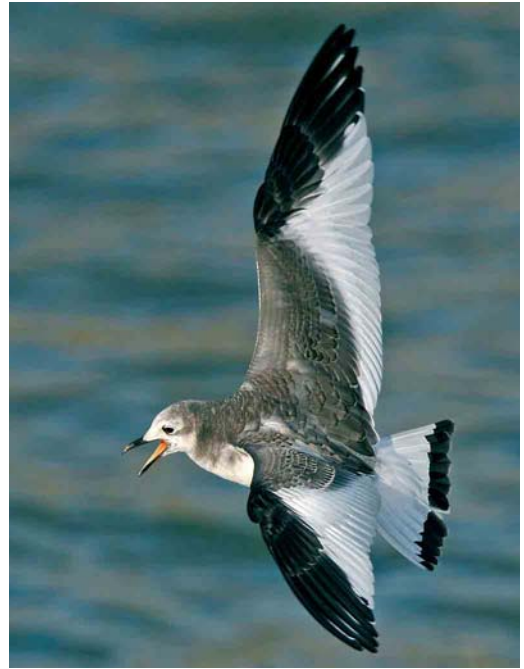
97 Vorkstaartmeeuw / Sabine's Gull Larus sabini , juveniel, Oostende, West-Vlaanderen, 18 november 2006 (Kris De Rouck)

WOUWEN TOT ALKEN Een late Zwarte Wouw Milvus migrans vloog op 16 november over de Dender tussen Pamel, Vlaams-Brabant, en Okegem, Oost-Vlaanderen. In Vlaanderen werden tussen 11 november en 9 december nog op zes plaatsen Rode Wouwen Milvus waargenomen. In Wallonië waren er in totaal acht waarnemingen waaronder concentraties van zeven bij Ramecroix, Liège, op 8 november en negen boven het stort van Habay-la-Neuve, Luxembourg, op 9 december. Er werden Ruigpootbuizerds Buteo lagopus gezien in Lommel-Neerpelt op 1 november en 28 december; Wijtschate, West-Vlaanderen, op 2 november; en in Kalmthout, Antwerpen, op 31 december. De laatste Visarenden Pandion haliaetus vlogen over Lommel op 1 november; over Ingooigem, West-Vlaanderen, op 9 november; en over Tessenderlo, Limburg, op 12 november. Op 5 december werd een wel erg late Kwartel Coturnix coturnix opgestoten bij Petegem, Oost-Vlaanderen. Tijdens de eerste decade van november werden in Wallonië enkele 10-tallen Kraanvogels Grus grus opgemerkt. Op 11 november trokken er c 500 over Butchenbach, Liège; 2000 over Robertville, Liège; en 1300 over Rodt, Liège. Op 20 november was er een eerste waarneming in Vlaanderen met zes over Genk-Bokrijk, Limburg. Tussen 27 november en 2 december was er dan de lang verwachte trek golf met