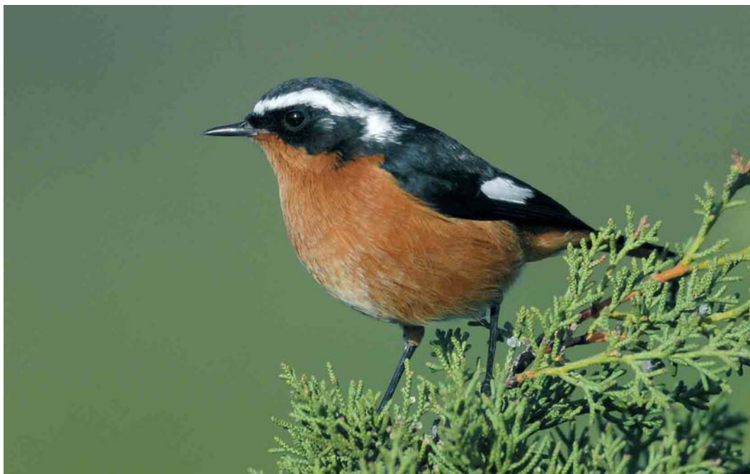
70 Moussier's Redstart / Diademroodstaart Phoenicurus moussieri , male, Cabo de São Vicente, Algarve, Portugal, 15 December 2006 (Ray Tipper)

Red-throated Pipit A cervinus wintered at Rogerstown, Dublin, from 24 December to at least 6 January. If accepted, a Rock Pipit A petrosus photographed at Nesebr, Burgas, on 6 November will be the first for Bulgaria. A Common Bulbul Pycnonotus barbatus west of Fuengirola, Málaga, from the second week of January was the third for Spain. A first-winter Grey Catbird Dumetella carolinensis near Kallo, Oost-Vlaanderen, on 15-16 December was the first for Belgium (and c seventh for the WP).