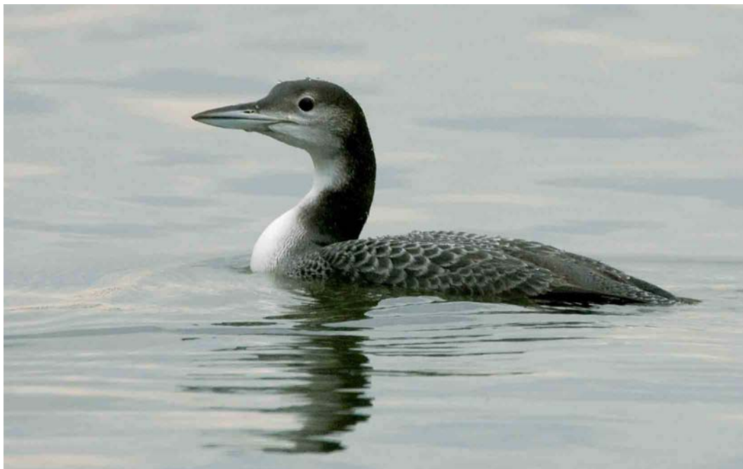
79 Ijsduiker / Great Northern Loon Gavia immer , juveniel, Asselt, Limburg, 27 november 2006 ( Otto Plantema )