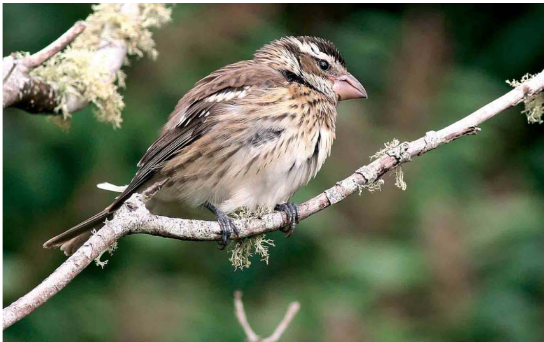
66 Rose-breasted Grosbeak / Roodborstkardinaal Pheucticus ludovicianus , Corvo, Azores, 24 October 2006 cf Dutch Birding 28: 390, 2006