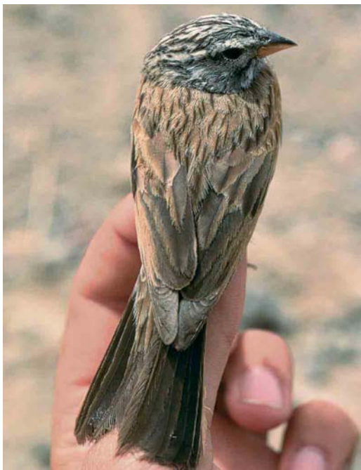
15 Striated Bunting / Gestreepte Gors Emberiza striolata , male, Eilat, Israel, April 1990 ( Hadoram Shirihai ). Same bird as in plate 13 and 17.