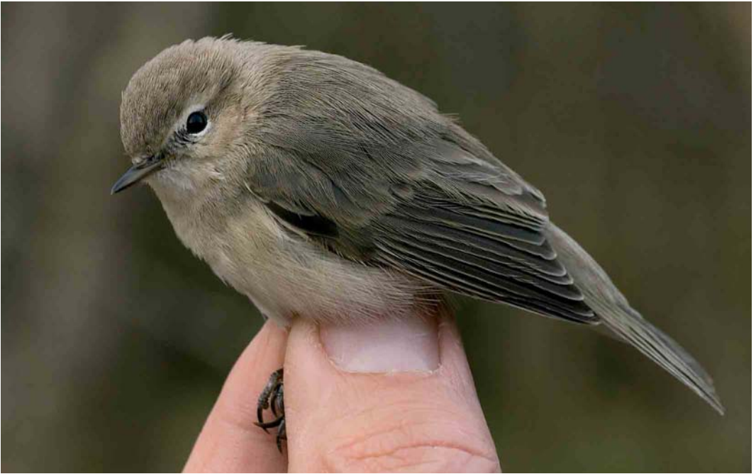
94 Siberische Tjiftjaf / Siberian Chiffchaff Phylloscopus collybita tristis , Groene Glop, Schiermonnikoog, Friesland, 18 november 2006 ( Han Bouwmeester ) 95 Dwerggors / Little Bunting Emberiza pusilla , Katwijk, Zuid-Holland, 28 december 2006 ( Michel Veldt ) 96 Dwerggors / Little Bunting Emberiza pusilla , Katwijk, Zuid-Holland, 27 december 2006 ( Ies Meulmeester )