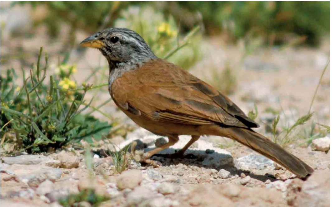
2 House Bunting / Huisgors Emberiza sahari , adult male, Talioulène, Central Anti-Atlas, Morocco, 5 April 2006