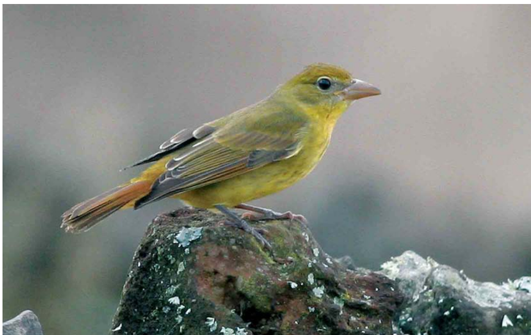
67 Summer Tanager / Zomertangare Piranga rubra , first-year, Corvo, Azores, 28 October 2006 cf Dutch Birding 28: 390, 2006