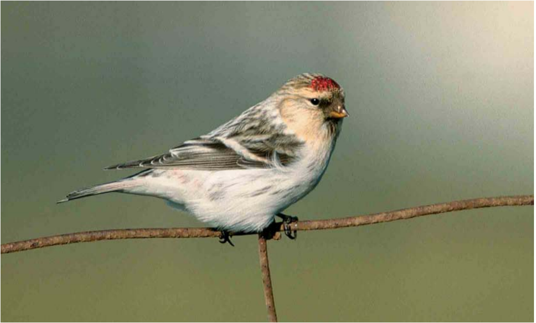
32-33 Groenlandse Witsluitbarmsijs / Hornemann's Redpoll Carduelis hornemanni hornemanni , Huisduinen, Noord-Holland, 15 oktober 2003 (Arnoud B van den Berg). Let op witte totaalindruk, gelijkmatig koudgrijs gestreepte witte bovendelen, zeer geringe hoeveelheid roze op stuit, geringe streping op flank, staartpenen met afgeronde toppen en scherp begrensde witte randen, en snavel met iets gebold culmen / note white overall impression, uniform frosty-grey streaking on white upperparts, very small amount of pink on rump, small amount of streaking on flank, tail-feathers with rounded tips and sharply demarcated white edges, and thick bill with slightly rounded culmen