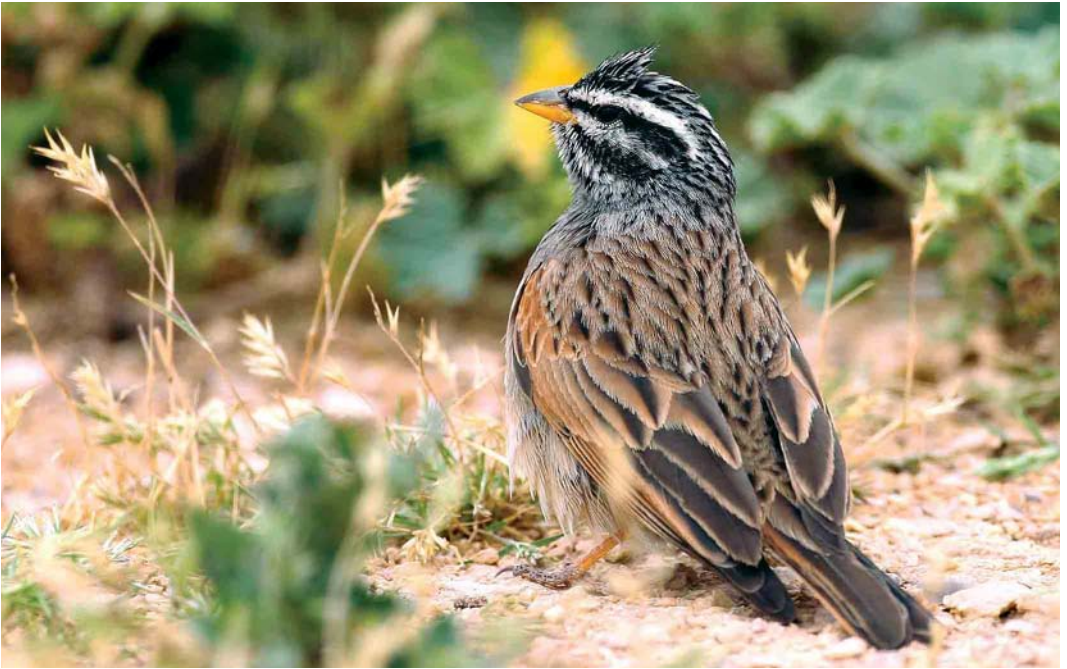
1 Striated Bunting / Gestreepte Gors Emberiza striolata , adult male, Negev, Israel, March 2005