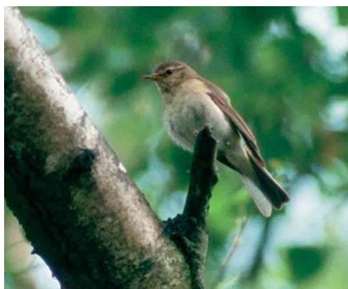
109 Iberische Tjijtjaf / Iberian Chiffchaff Phylloscopus ibericus , Vondelpark, Amsterdam, Noord-Holland, juni 1990 110 Iberische Tjijtjaf / Iberian Chiffchaff Phylloscopus ibericus , Vondelpark, Amsterdam, Noord-Holland, april 1990 111 Iberische Tjijtjaf / Iberian Chiffchaff Phylloscopus ibericus , Sorghvlietpark, Den Haag, Zuid-Holland, 5 mei 1994 112 Iberische Tjijtjaf / Iberian Chiffchaff Phylloscopus ibericus , Belfeld, Limburg, 8 juni 2001. Lange wenkbrauwstreep en bleke onderdelen zijn kenmerkend / Long supercilium and pale underparts are characteristic

2005 werd tijdens zijn verblijf door een aantal waarnemers beschouwd als mogelijke Tjijtjaf met afwijkende zang en de waarneming werd daarom nog niet ingediend bij de CDNA (geluidsopnamen en foto's zijn te vinden op www.dutchbirding.nl en www.lauwersmeer.com ).