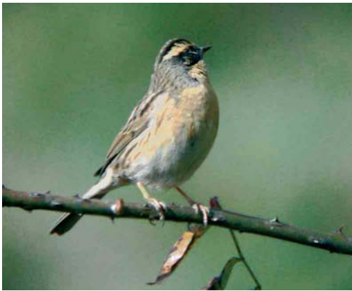
Mystery photograph III (December)