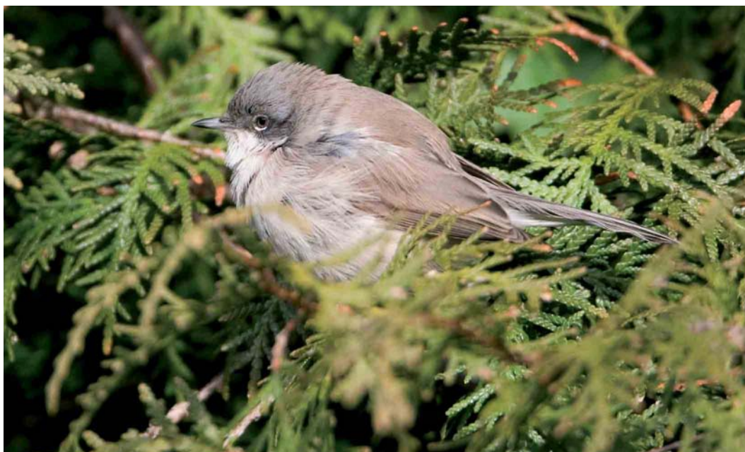
183 Vale Braamsluiper / Siberian Lesser Whitethroat Sylvia curruca halimodendri , Vinkhuizen, Groningen, Groningen, 16 februari 2007 (Roland Jansen)

SIBERIAN LESSER WHITETHROAT From 31 December 2005 to 12 April 2006, a presumed Siberian Lesser White-throat Sylvia curruca halimodendri wintered in a suburban garden at Groningen, Groningen, the Netherlands. On 4 January 2006, it was trapped and ringed, and a few feathers were collected for DNA analysis. Surprisingly, the bird returned to the same garden on 2 November 2006 and remained at least into March 2007. The results of the analysis of the mitochondrial cytochrome-B gen and comparisons with sequences obtained from other lesser whitethroat taxa, including individuals at Landsort, Sweden (30 October-30 December 2000), North Ronaldsay, Orkney, Scotland (17 October 2003) and Aberdeen, Scotland (5-21 December 2004), became available in December 2006. The genetical results confirmed that the bird is not a nominate Lesser Whitethroat S. c. curruca but that it is not a 'classic' halimodendri either, being part of a population of which the breeding area is unknown. It also appears that the individuals from Landsort and Orkney belong to the same population, while the one at Aberdeen is a classic halimodendri . On 5 February 2007, the bird was trapped again to obtain more biometrics, and the wing formula data also confirm that it belongs to the halimodendri group.