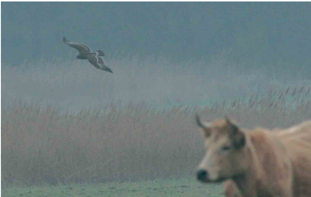
131 Greater Spotted Eagle / Bastaardarend Aquila clanga , first-year, Rømø, Jylland, Denmark, 14 February 2007 (Henrik Knudsen)