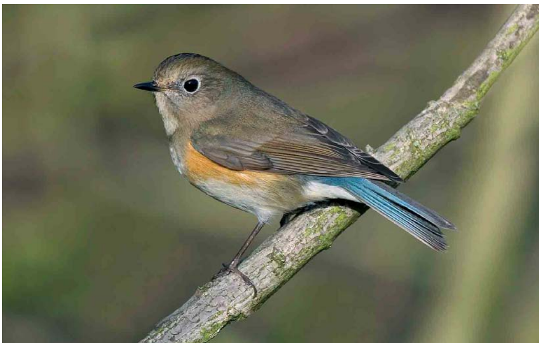
171 Blauwstaart / Red-flanked Bluetail Tarsiger cyanurus , eerste-winter mannetje, Zandvoort, Noord-Holland, 11 februari 2007