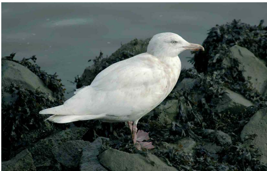
156 Grote Burgemeester / Glaucous Gull Larus hyperboreus , tweede-winter, Stellendam, Zuid-Holland, 22 januari 2007 (René M van Loo)