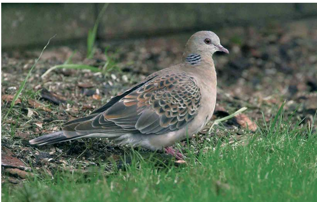
143 Oriental Turtle Dove / Oosterse Turtel Streptopelia orientalis , first-winter, Bække, Vejen, Jylland, Denmark, 15 January 2007