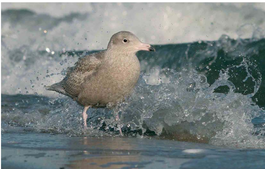
154 Grote Burgemeester / Glaucous Gull Larus hyperboreus , eerste-winter, Maasvlakte, Zuid-Holland, 8 januari 2007 ( Michel Veldt )