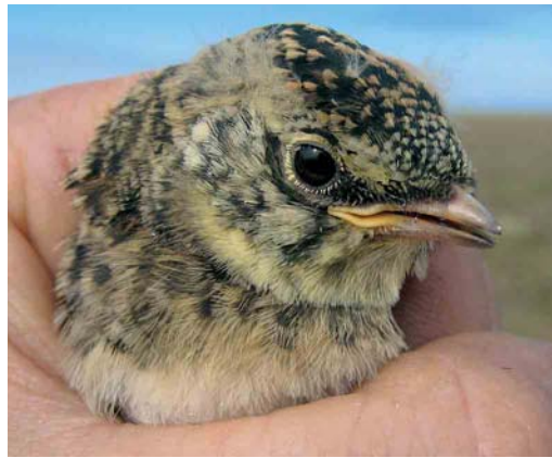
Mystery photograph IV (August)