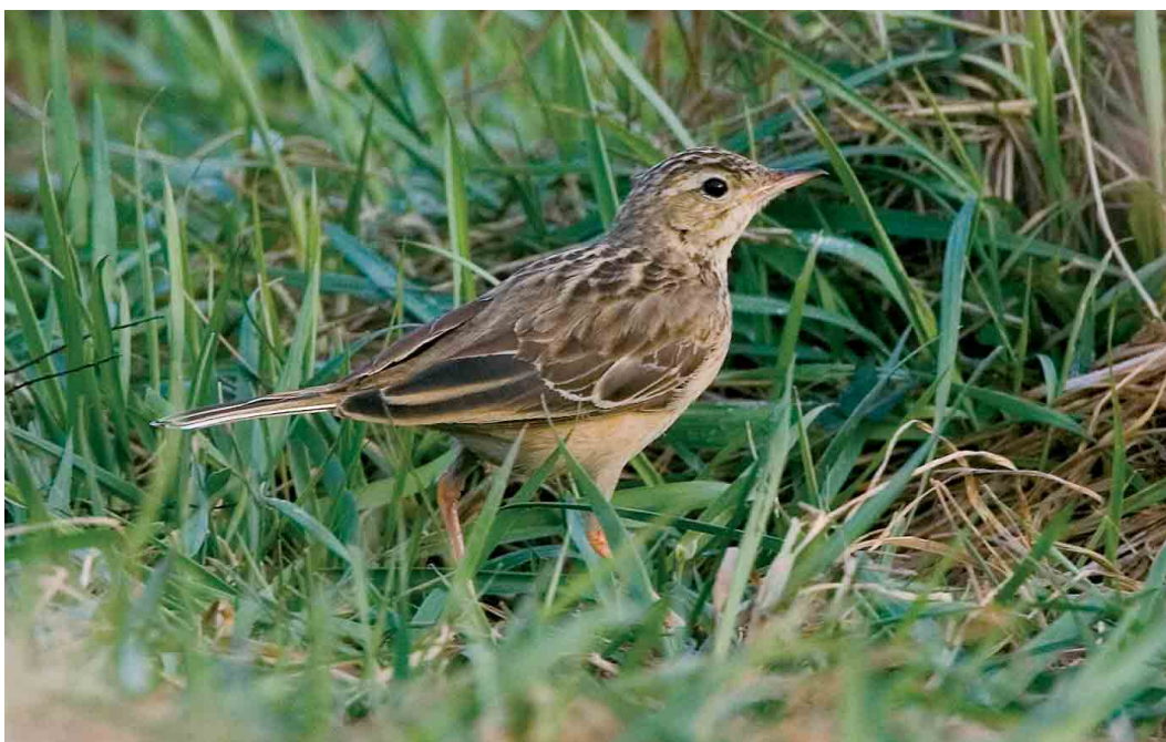
158 Mongoolse Pieper / Blyth's Pipit Anthus godlewskii , Woerden, Utrecht, 25 januari 2007 (Bas van den Boogaard)