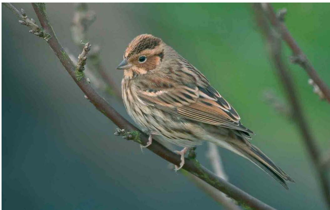
173 Dwerggors / Little Bunting Emberiza pusilla , Katwijk aan Zee, Zuid-Holland, 17 februari 2007