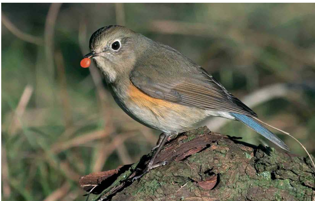
172 Blauwstaart / Red-flanked Bluetail Tarsiger cyanurus , eerste-winter mannetje, Zandvoort, Noord-Holland, 25 januari 2007