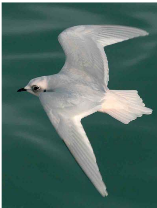
146 Green Heron / Groene Reiger Butorides virescens , Berre l'Étang, Bouches-du-Rhône, France, 11 February 2007 147 Ross's Gull / Ross' Meeuw Rhodostethia rosea , adult, Douarnenez, Finistère, France, 21 January 2007 148 Red-flanked Bluetail / Blauwstaart Tarsiger cyanurus , first-winter male, Zandvoort, Noord-Holland, Netherlands, 4 February 2007