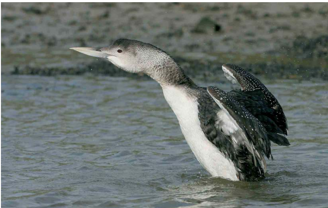
129 Yellow-billed Loon / Geelsnavelduiker Gavia adamsii , adult, Hayle, Cornwall, England, 1 March 2007