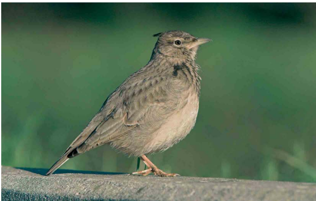
157 Kuifleeuwerik / Crested Lark Galerida cristata , Amersfoort, Utrecht, 25 januari 2007 (Bart van Buren)