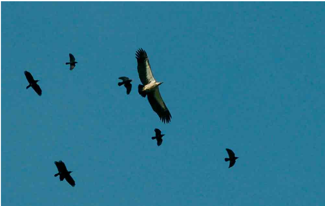
130 African White-backed Vulture / Afrikaanse Witrugger Gyps africanus , with Red-billed Choughs / Alpenkraaien Pyrrhocorax pyrrhocorax , Cabo de São Vicente, Portugal, 15 October 2006 (Brian J Small)