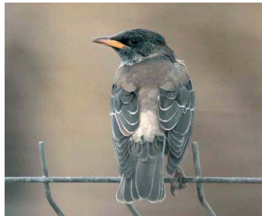
138 Eastern Black Redstart / Oosterse Zwarte Roodstaart Phoenicurus ochruros phoenicuroides , male, Jomfruland, Kragerø, Telemark, Norway, 21 January 2007 ( Øivind W Johannessen ) 139 Desert Wheatear / Woestijntapuit Oenanthe deserti , first-year male, Irlam, Greater Manchester, England, 9 March 2007 ( Steve Young/Birdwatch ) 140 Citrine Wagtail / Citroenkwikstaart Motacilla citreola , Aiguamolls de l'Empordà, Girona, Spain, 18 January 2007 ( Ricard Gutiérrez ) 141 Rose-coloured Starling / Roze Spreeuw Sturnus roseus , first-winter, Llobregat delta, Barcelona, Spain, 12 February 2007 ( Ferran López )

Bute, Argyll, from 28 January into March. In København, Denmark, first-winter females were present at Østerbro from 26 January to at least 28 February and at Nivå from 3 February into March. In Finland, a male remained at Oulu from February into March. In England, a first-winter American Robin T migratorius stayed at Bingley, West Yorkshire, from early January through February. The number of singing Cetti's Warblers Cettia cetti in the Netherlands increased to 25 in 2006; the highest total ever was a presumed 60 pairs in 1977 but severe winters wiped it out and not a single bird was recorded in 1986-88 and 1991-92, 1997 and 1999. Similarly, the number of singing Zitting Cisticola Cisticola juncidis has been on the increase again, with in 2006 25 in Saefinghe, Zeeland, alone. Three Paddyfield Warblers Acrocephalus agricola were found in Catalunya, Spain, including two