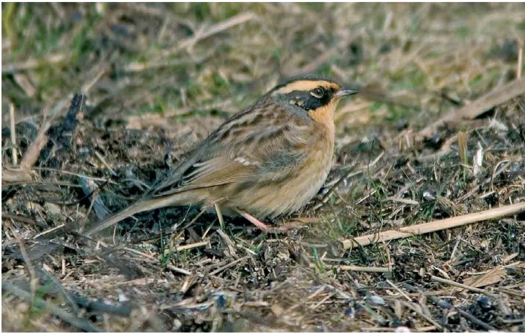
151-152 Siberian Accentor / Bergheggenmus Prunella montanella , Flisviken, Gotland, Sweden, February 2007