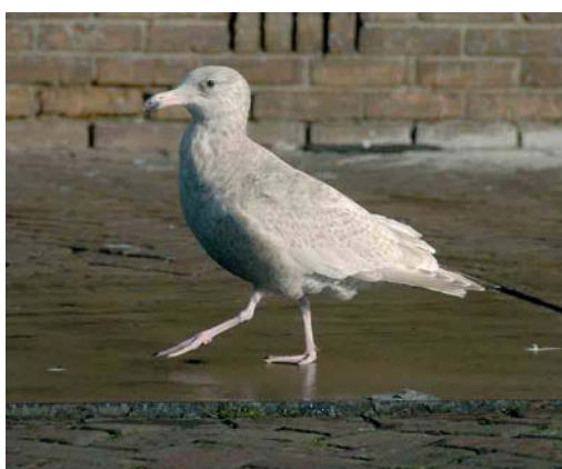
161 Zwarte Wouw / Black Kite Milvus migrans , Kamerik, Utrecht, 24 februari 2007 162 Zwarte Wouw / Black Kite Milvus migrans , Kamerik, Utrecht, 23 februari 2007 163 Ross' Gans / Ross's Goose Anser rossii , Scherpenissepolder, Zeeland, 12 februari 2007 164 Grote Grijsze Snip / Long-billed Dowitcher Limnodromus scolopaceus , Twisk, Noord-Holland, 14 januari 2007 165 Grote Burgemeester / Glaucous Gull Larus hyperboreus , Maasvlakte, Zuid-Holland, 7 januari 2007 166 Hybride Grote Burgemeester x Zilvermeeuw / hybrid Glaucous x European Herring Gull Larus hyperboreus x argentatus , eerste-winter, IJmuiden, Noord-Holland, 7 februari 2007