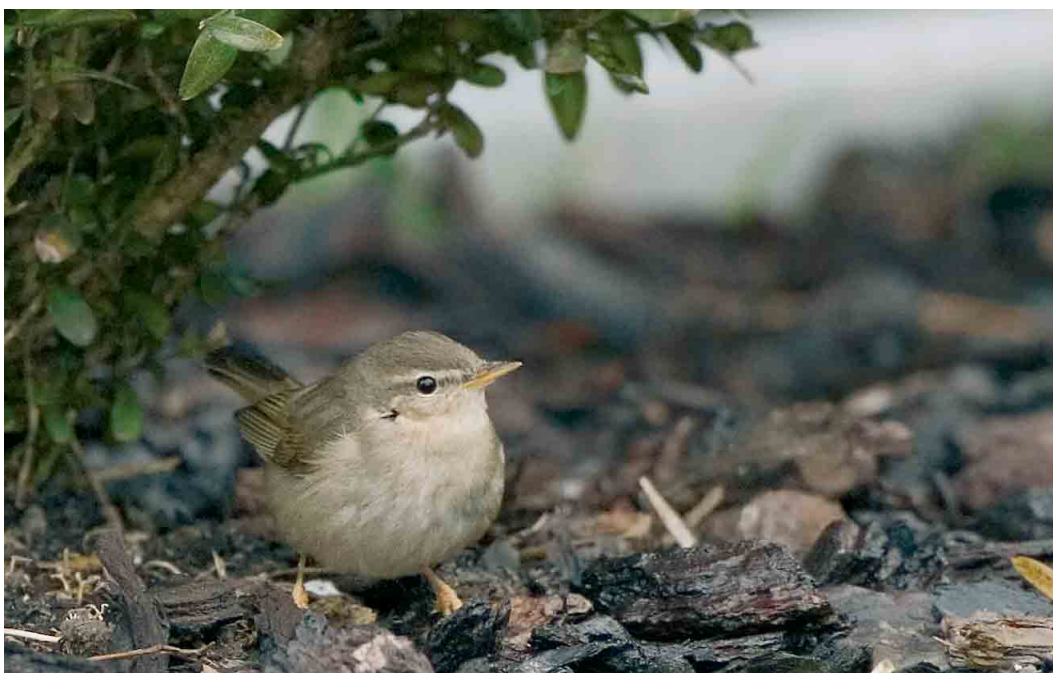
168 Bruine Boszanger / Dusky Warbler Phylloscopus fuscatus , Electra, Groningen, 9 februari 2007