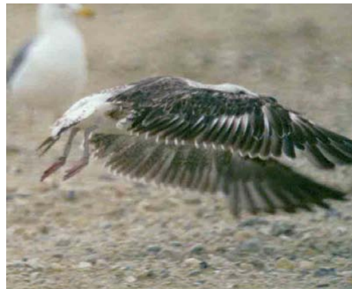
119 Baltic Gull / Baltische Mantelmeeuw Larus fuscus fuscus (CJC9), second calendar-year, Erasmusgracht, Amsterdam, Netherlands, 25 May 2006. This bird shows restricted moult for fuscus : many lesser and greater coverts are still worn juvenile feathers. 120 Baltic Gull / Baltische Mantelmeeuw Larus fuscus fuscus (CJC9), second calendar-year, Erasmusgracht, Amsterdam, Netherlands, 25 May 2006 121 Baltic Gull / Baltische Mantelmeeuw Larus fuscus fuscus (CJC9), second calendar-year, Erasmusgracht, Amsterdam, Netherlands, 25 May 2006. Note second-generation inner primaries (p1-4). All tail-feathers, secondaries and outer primaries (p5-10) are retained juvenile feathers. 122 Baltic Gull / Baltische Mantelmeeuw Larus fuscus fuscus , second calendar-year, Al Hadd, Bahrain, 5 March 1999. This bird had been colour-ringed in Finland. It is actively replacing wing-coverts, primaries and tail-feathers; all secondaries are still juvenile.

Second calendar-year Lesser Black-backed Gulls sensu lato observed in spring and summer in western Europe also show highly variable moult patterns. Winters (2006) used these patterns to reconstruct the moult sequence in juvenile/first-winter birds and deduced that first the tail-feathers are renewed, then the secondaries and finally the primaries. This sequence is different from the first complete moult taking place in the summer of the second calendar-year, in which the inner primaries are replaced first. Only when approximately half of the primaries have been renewed will the replacement of rectrices and secondaries begin. Extrapolating the moult patterns of birds he observed in the Netherlands to fuscus , Winters (2006) concluded that