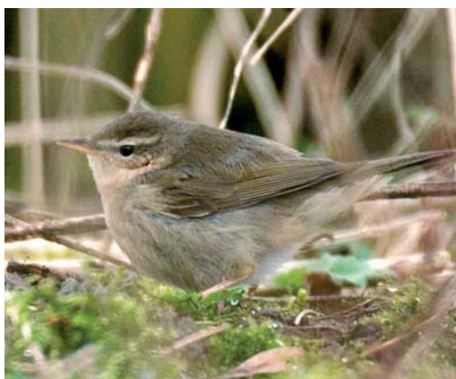
175 Pallas' Boszanger / Pallas's Leaf Warbler Phylloscopus proregulus , Driehuis, Noord-Holland, 22 januari 2007 176 Grote Pieper / Richard's Pipit Anthus richardi , Lentevreugd, Wassenaar, Zuid-Holland, 17 februari 2007 177 Dwerggorzen / Little Buntings Emberiza pusilla , Katwijk aan Zee, Zuid-Holland, 15 februari 2007 178 Bruine Boszanger / Dusky Warbler Phylloscopus fuscatus , Electra, Groningen, 7 februari 2007

wersdam. Een winterse Visdief S hirundo vloog op 15 januari langs telpost Camperduin. De Zwarte Zeekoet Cephus grylle van West-Terschelling, Friesland, was weer te zien van 22 tot 28 januari. Op 2 januari werd een exemplaar opgemerkt langs Ameland en op 27 januari bij de Brouwersdam. De twee Kleine Alken Alle alle van Westkapelle bleven tot 27 januari, waarna er nog één tot 3 februari zwom. Daarnaast werden er tot begin februari nog 10 gemeld. Papegaaiduikers Fringilla arctica vlogen op 1 januari langs Westkapelle, op 2 en 21 januari langs Ameland, en op 22 januari langs Vlieland, Friesland; op 9 februari werd een dood exemplaar gevonden tussen Katwijk aan Zee en Noordwijk aan Zee, Zuid-Holland, en op 10 februari te IJmuiden.