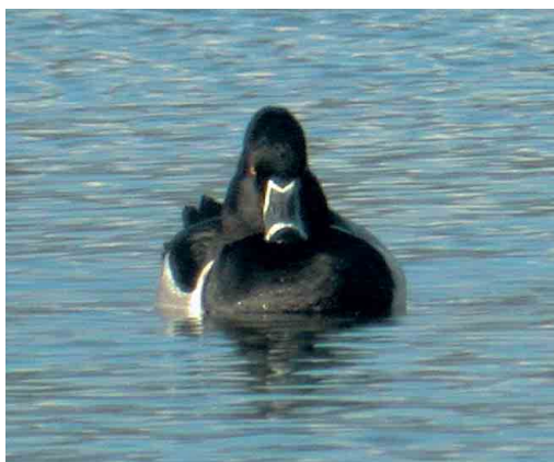
181 Ringsnaveleend / Ring-necked Duck Aythya collaris , mannetje, Verdrongen Weiden, Ieper, West-Vlaanderen, 21 januari 2007