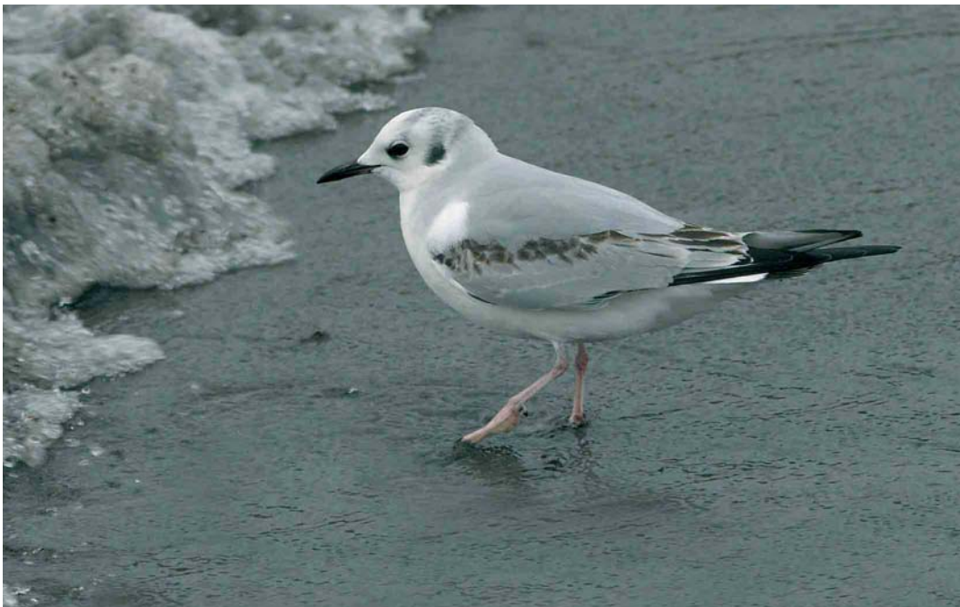
145 Bonaparte's Gull / Kleine Kokmeeuw Larus philadelphia , first-winter, Whitehead, Antrim, Northern Ireland, 15 January 2007