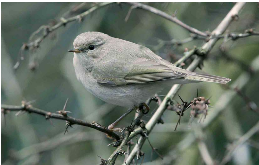
167 Siberische Tjiftjaf / Siberian Chiffchaff Phylloscopus collybita tristis , Bilthoven, Utrecht, 18 februari 2007