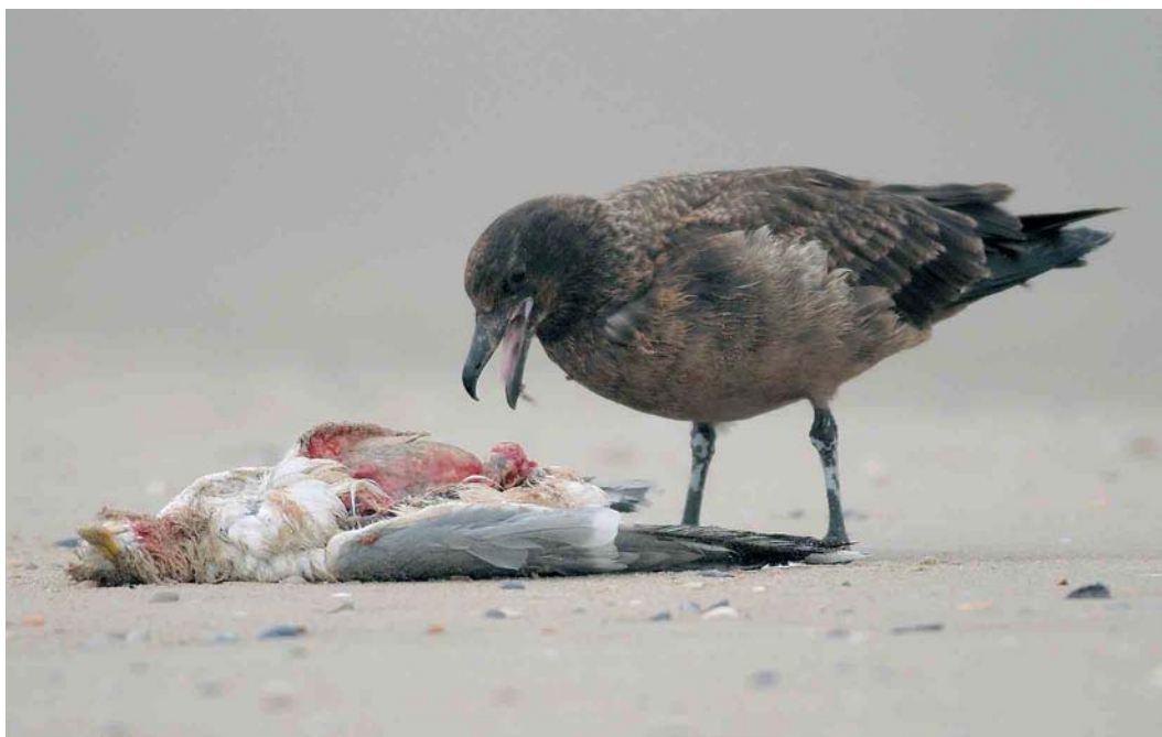
155 Grote Jager / Great Skua Stercorarius skua , eerstejaars, De Cocksdorp, Texel, Noord-Holland, 10 februari 2007 (René Pop)