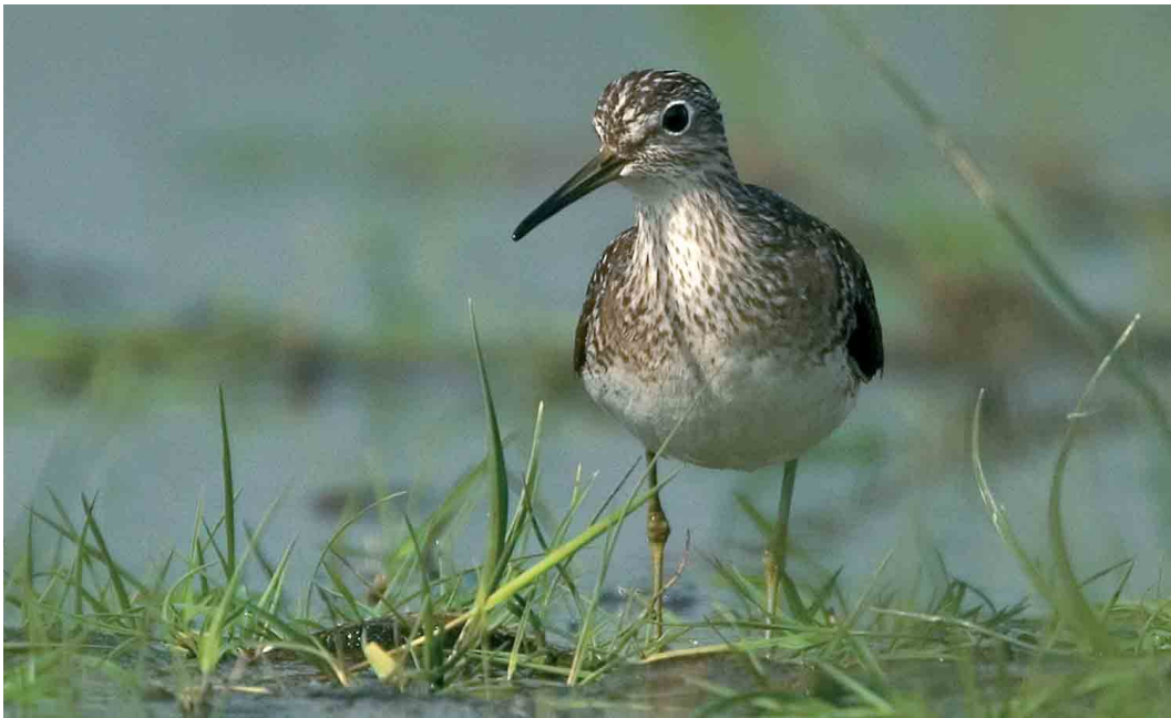
105-106 Amerikaanse Bosruiter / Solitary Sandpiper Tringa solitaria solitaria , Wissenkerke, Zeeland, 17 mei 2006 (Harvey van Diek)

Amerikaanse Bosruiter bij Wissenkerke in mei 2006