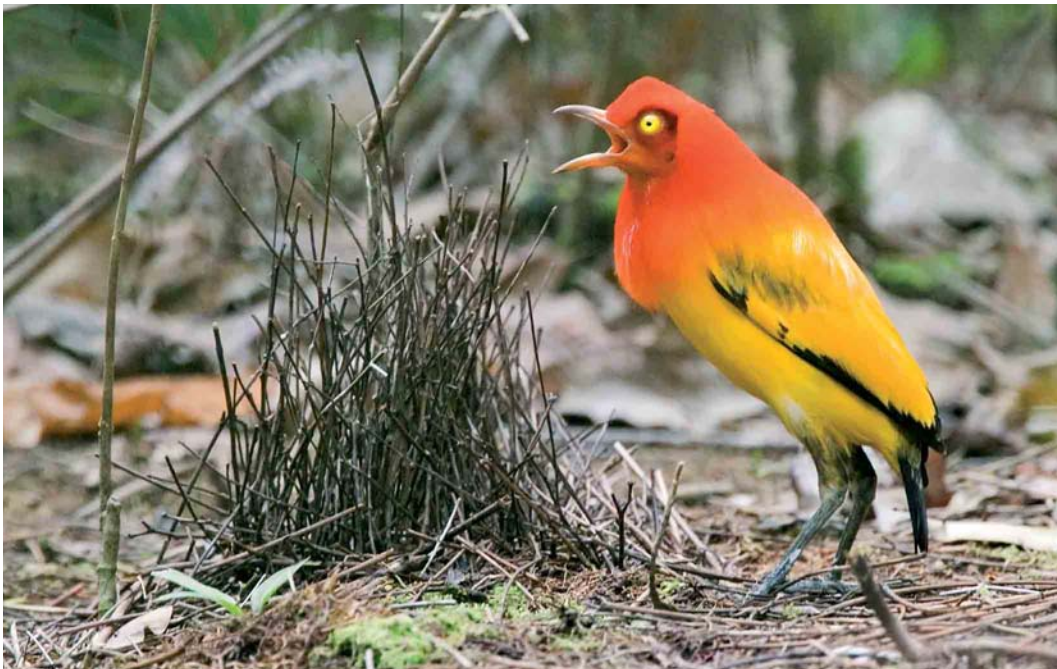
125 Flame Bowerbird / Oranje Prieelvogel Sericulus aureus ardens , adult male, Kiunga, Western Province, Papua New Guinea, 20 October 2006