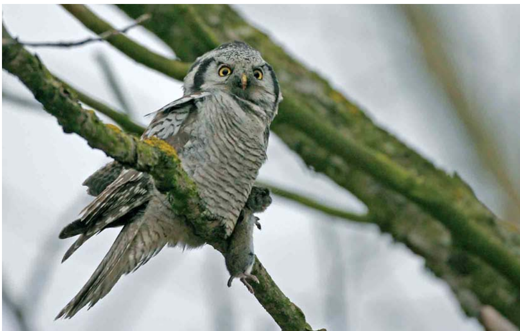
142 Northern Hawk Owl / Sperweruil Surnia ulula , Cedry Male, Gdansk, Poland, 11 March 2007