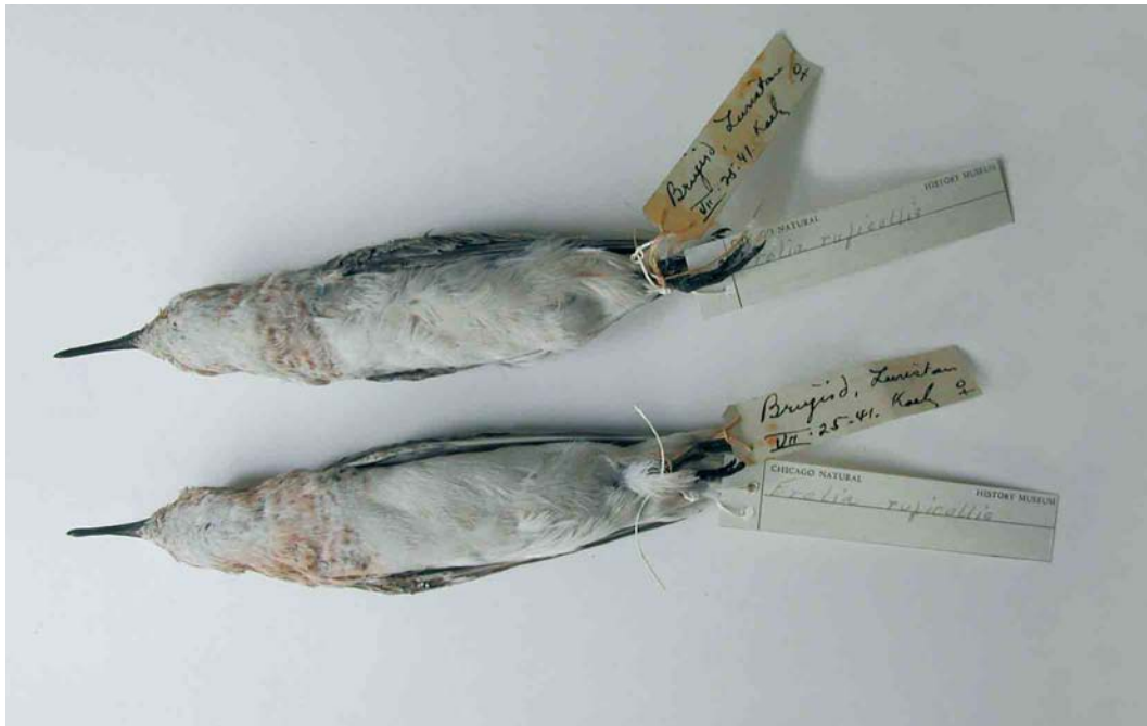
118 Red-necked Stints / Roodkeelstrandlopers Calidris ruficollis (collected at Borujerd, Lorestan, Iran, on 25 July 1941), Field Museum of Natural History, Chicago, USA, August 2006

lengths are unusually short for Red-necked Stint (all comparisons with data in Cramp & Simmons 1983) but both specimens show abrasion to the primaries to a greater or lesser degree. In contrast, both tarsus and culmen lengths are outside the range of Little, and the bills of the Iranian birds are deeper over their entirety than in typical Little. The following plumage features also point to Red-necked: no trace of pale 'tram-lines' on the mantle; rufous on the upperparts virtually confined to the scapulars (other than the head); and contrasting grey wing-coverts (cf Beaman & Madge 1998).