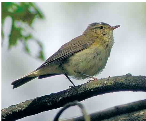
113 Iberische Tjiftjaf / Iberian Chiffchaff Phylloscopus ibericus , Groningen, Groningen, 2 mei 2004 ( Marnix Jonker ). Lange staart en bleke onderdelen zijn kenmerkend / Long tail and pale underparts are characteristic.