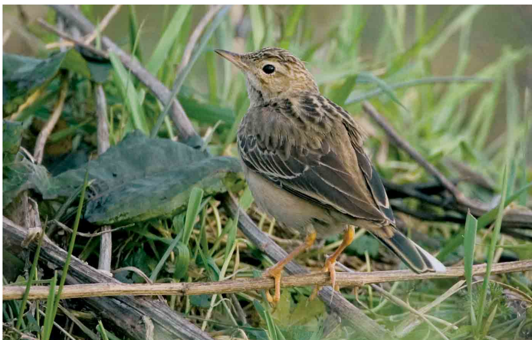
160 Mongoolse Pieper / Blyth's Pipit Anthus godlewskii , Woerden, Utrecht, 25 januari 2007 (Bas van den Boogaard)