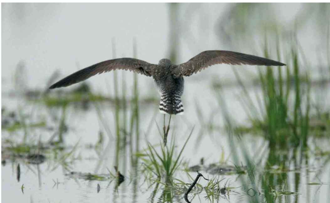
107 Amerikaanse Bosruiter / Solitary Sandpiper Tringa solitaria solitaria , Wissenkerke, Zeeland, 17 mei 2006 (Harvey van Diek)

(8 oktober 2005) en Zweden (20 mei 1987) (Dymond et al 1989, Lundqvist 1989, Lewington et al 1991, Evans 1994, Clarke 2006; www.wpbirds.com , http://azores.seawatching.net/index.php?page=list ; Marcel Haas in litt).