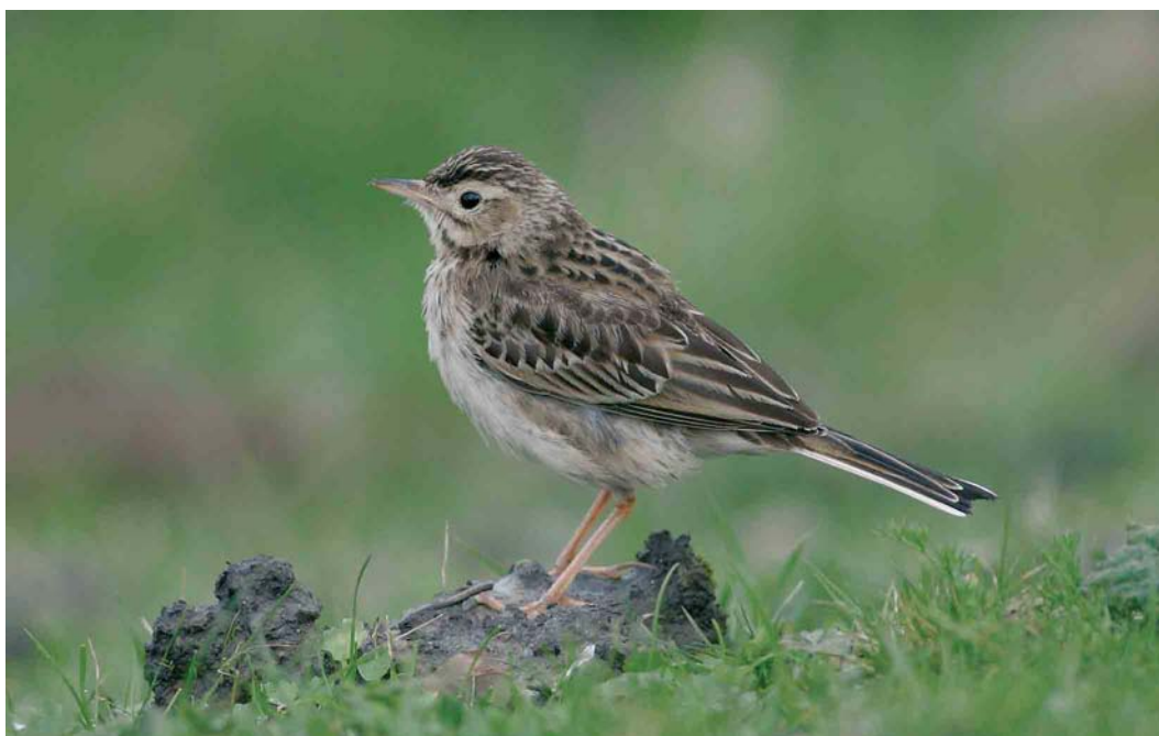
159 Grote Pieper / Richard's Pipit Anthus richardi , Flauwers Inlaag, Zeeland, 24 februari 2007