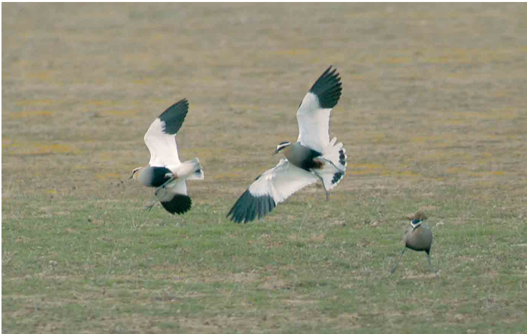
132 Sociable Lapwings / Steppekieviten Vanellus gregarius , Eiwa, Syria, 24 February 2007 (Mahmoud Sheish Abdallah)