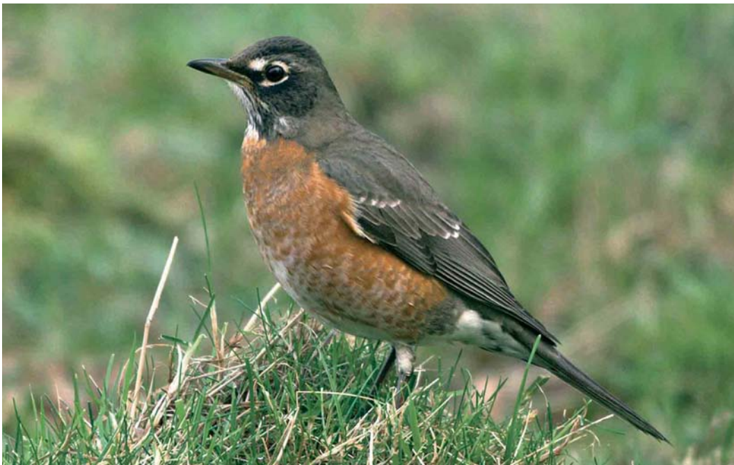
150 American Robin / Roodborstlijster Turdus migratorius , first-winter, Bingley, West Yorkshire, England, 27 January 2007