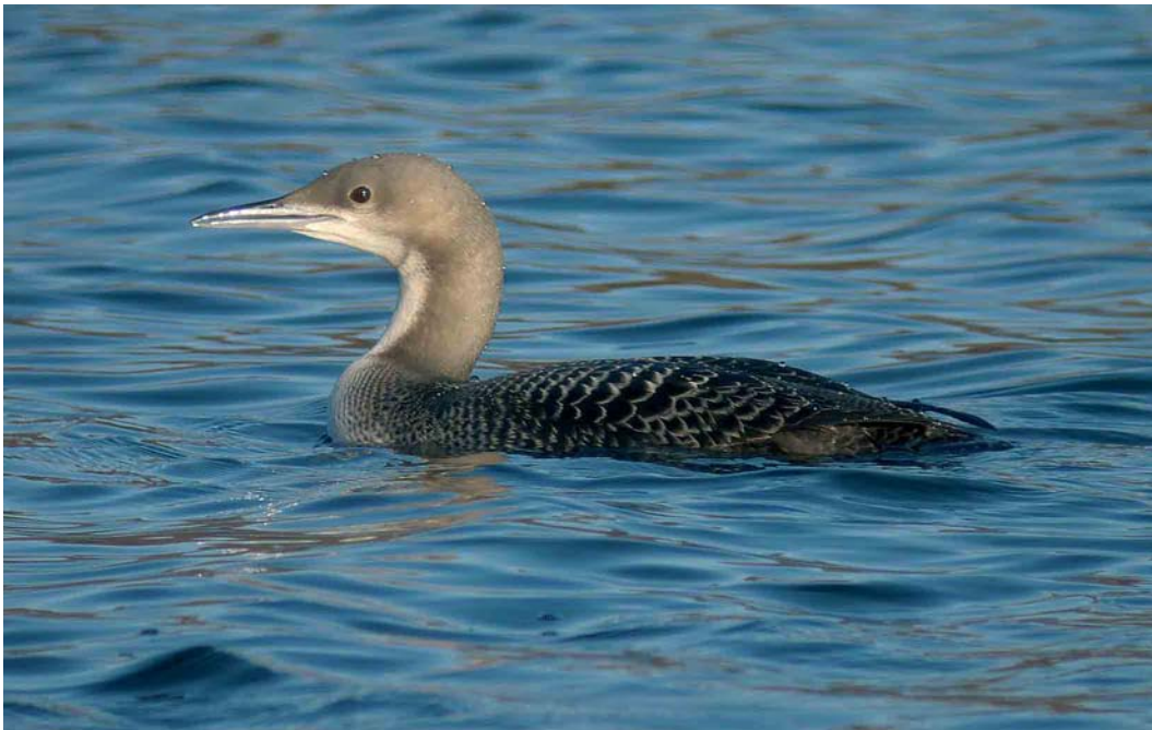
128 Pacific Loon / Pacifische Parelduiker Gavia pacifica , first-year, Farnham, North Yorkshire, England, January 2007 (Dave Stewart)