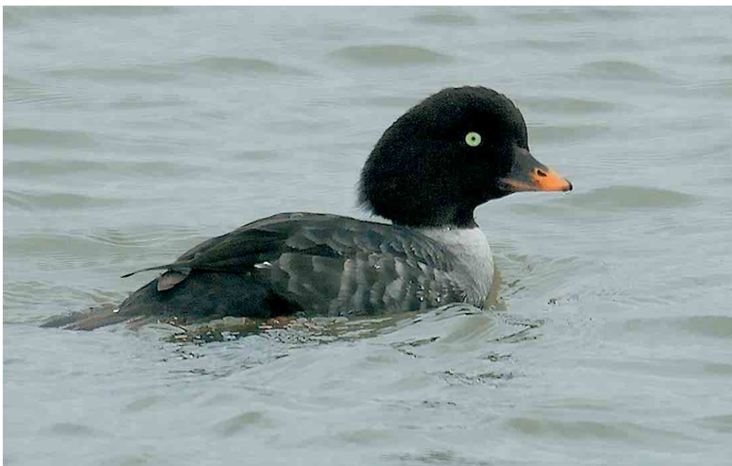
153 Mogelijke IJslandse Brilduiker / possible Barrow's Goldeneye Bucephala islandica , vrouwtje, Ketelhaven, Flevoland, 24 februari 2007 ( Richard Burgmeijer )