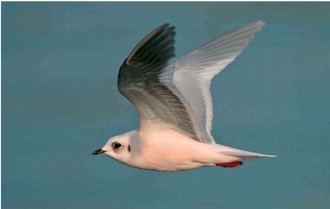
144 Ross's Gull / Ross' Meeuw Rhodostethia rosea , adult, Douarnenez, Finistère, France, 21 January 2007 ( MatthieuVaslin )