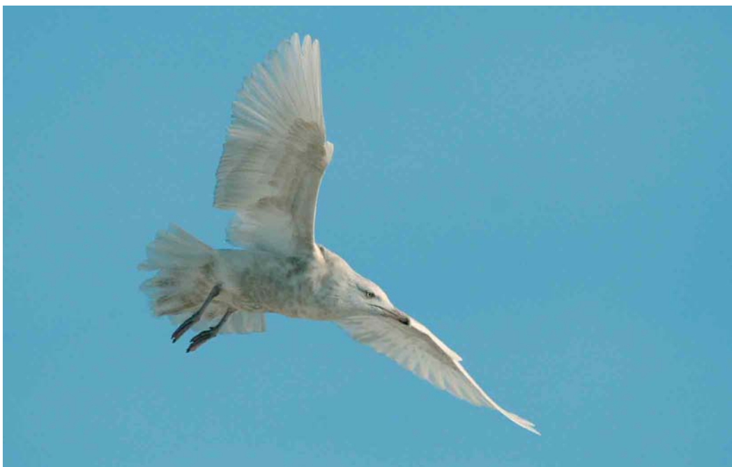
179 Grote Burgemeester / Glaucous Gull Larus hyperboreus , tweede-winter, Zeebrugge, West-Vlaanderen, 31 januari 2007

Heppeneert werden op 27 januari telkens vier Taigarietganzen Anser fabalis opgemerkt. Een Groenlandse Kolgans A albifrons flavirostris verbleef op 6 januari in Ophoven, Limburg, en van 26 tot 29 januari was er één bij Heppeneert. De enige Roodhalsgans Branta ruficollis voor deze periode werd op 14 januari waargenomen in Sint-Margriete, Oost-Vlaanderen. Waarnemingen van Krooneenden Netta rufina kwamen van Beernem, West-Vlaanderen; Berlare, Oost-Vlaanderen; Gent, Oost-Vlaanderen; Harchies (twee); Kallo, Oost-Vlaanderen; Lac de la Plate-Taille, Hainaut (drie); Oudenaarde, Oost-Vlaanderen; Schoten, Antwerpen (twee); Sint-Lenaerts; Walem, Antwerpen; en Wintam, Antwerpen (twee). Op 14 en 15 januari zwom een mannetje Ringsnaveleend Aythya collaris op de kleiputten van Ploegsteert, Hainaut. Diezelfde vogel dook op 20 januari op in de Verdrongen Weiden bij Ieper, West-Vlaanderen, waar hij tot 23 januari werd gezien. Voor Witoogeenden A nyroca kon men nog terecht in Duffel/Rumst, Antwerpen (twee); Harelbeke, West-Vlaanderen (drie); Ploegsteert; Rijkevorsel, Antwerpen; en Zonhoven, Antwerpen. Het gekleurde en dus ontsnapte vrouwtje Kleine Topper A affinis werd tussen 7 januari en 20 februari nog geregeld opgemerkt in Het Hageven in Neerpelt, Limburg. Op 17 januari was een mannetje Amerikaanse Smient Anas americana aanwezig in Het Zwin in Knokke, West-Vlaanderen. Langs de Schelde in Tielrode, Oost-Vlaanderen, foerageerde op 22 januari een mannetje Amerikaanse Wintertaling