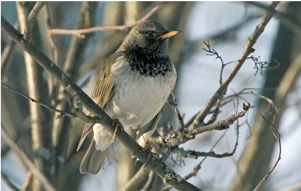
149 Black-throated Thrush / Zwartkeellijster Turdus atrogularis , male, Oulu, Finland, 4 March 2007