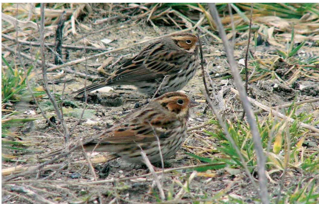
174 Dwerggorzen / Little Buntings Emberiza pusilla , Katwijk aan Zee, Zuid-Holland, 18 februari 2007 (Wilma van Holten)