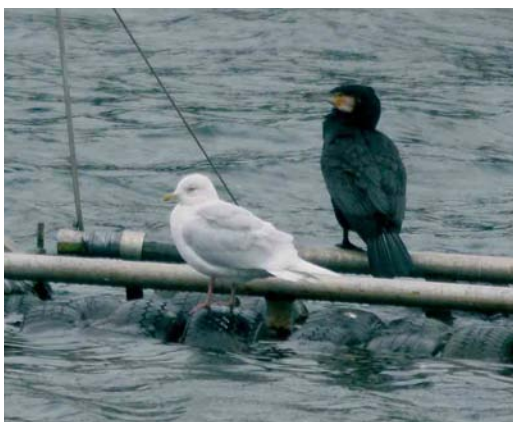
180 Kleine Burgemeester / Iceland Gull Larus glaucooides , Lac de l'Eau d'Heure, Hainaut/Namur, 10 februari 2007