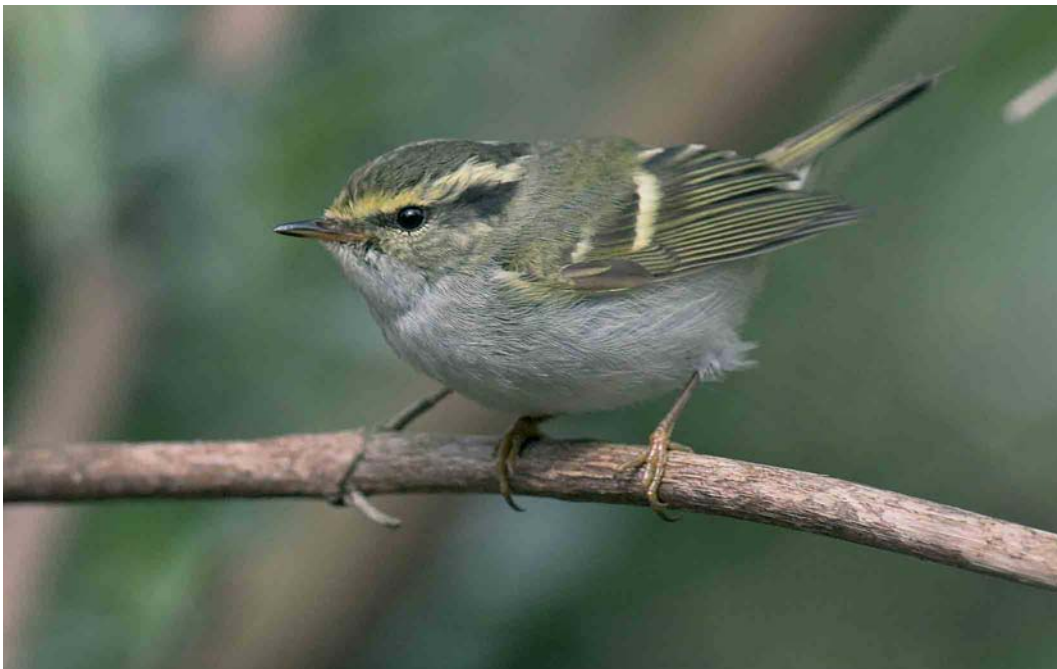
170 Pallas' Boszanger / Pallas's Leaf Warbler Phylloscopus proregulus , Kattenbroek, Amersfoort, Utrecht, 4 maart 2007 (Paul Cools)