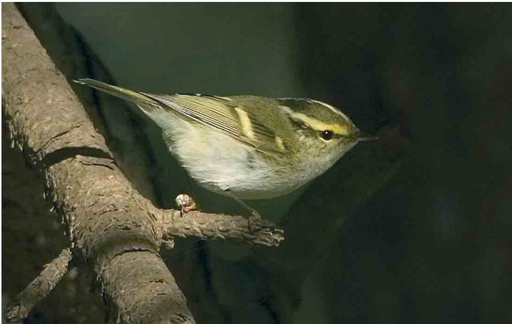
169 Pallas' Boszanger / Pallas's Leaf Warbler Phylloscopus proregulus , Driehuis, Noord-Holland, 3 februari 2007 (Jacob Garvelink)