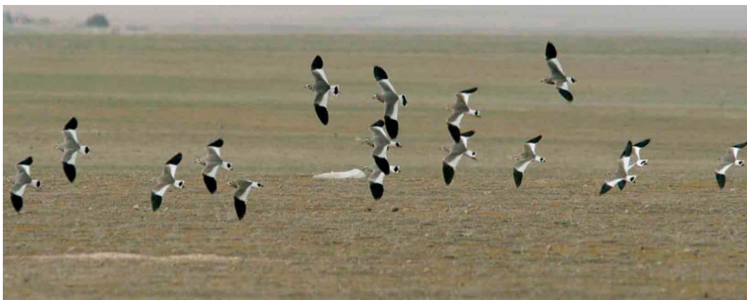
184 Steppekieviten / Sociable Lapwings Vanellus gregarius , Eiwa, Syrië, 24 februari 2007 (Guido O Keijl)

SOCIABLE LAPWINGS During a survey by four Dutch and three Syrian birders in February 2007, unprecedented numbers of the globally threatened Sociable Lapwing Vanellus gregarius were discovered in the north of Syria. On 25 February, 1345 were counted at three sites, including 838 at Ar Ruweira rangeland reserve. A group of 113 was seen at a fourth site a few days later. On 6 March, after the expedition had left, local birders reported 1600 at Ar Ruweira rangeland reserve, and 615 across the border at Ceylanpinar, Turkey. On 9 March, 2100 were counted (Eiwa excluded on this date) and 737 in Turkey. This makes a total of at least 2837 birds in the area, which is more than even the most optimistic recent estimated world population (600-1800 birds). The area is considered a very important wintering or stop-over site for this species. Loss of steppe habitat for agriculture, intensive grazing and (foreign) hunting parties pose the main threats. According to local people, it has been seen here for many years and, in the past, in much larger numbers, usually remaining in mild winters.