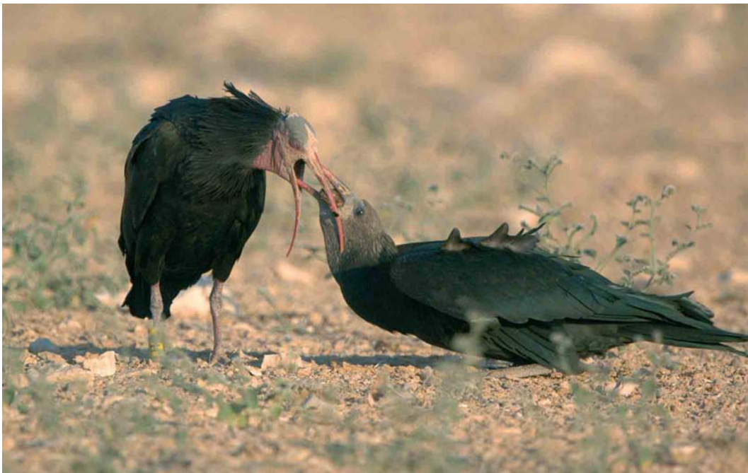
133 Northern Bald Ibises / Heremietibissen Geronticus eremita , Palmyra, Syria, summer 2006