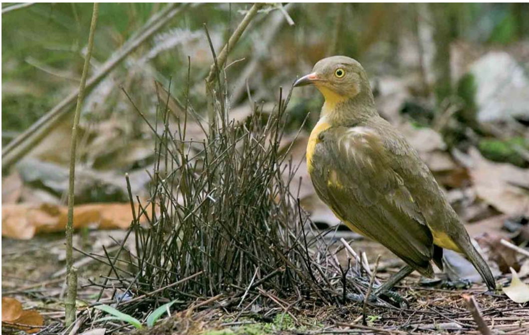
126 Flame Bowerbird / Oranje Prieelvogel Sericulus aureus ardens , female, Kiunga, Western Province, Papua New Guinea, 20 October 2006