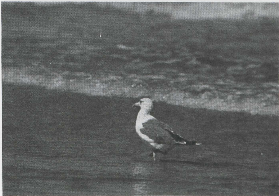
61. Larus cachinnans taimyrensis , Malindi, Kenya, januari 1980 (Jan Mulder)

Barth (1968) suggereerde een verband tussen de aanwezigheid en intensiteit van de wintervlekking en de leeftijd van de vogel.