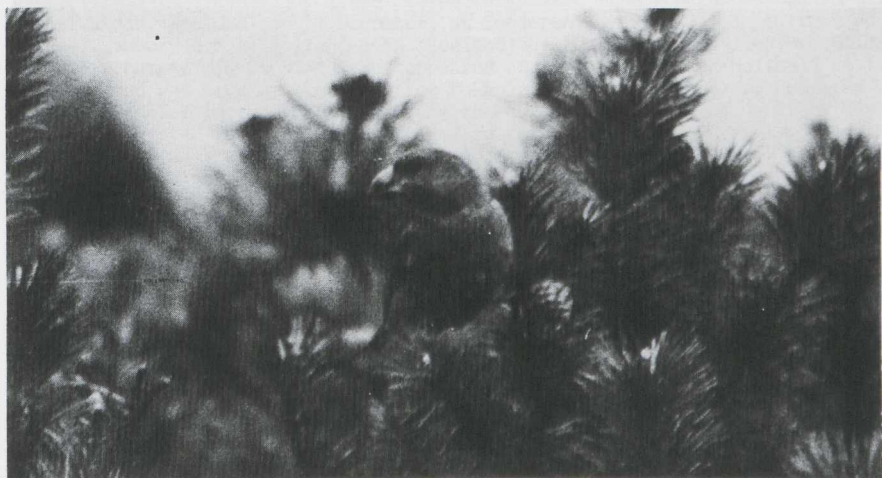
67. Parrot Crossbill/Grote Kruisbek Loxia pytyopsittacus , AW-duinen (Noord-Holland), 24 March 1963 ( Hans Vader )

J.J. (Han) Blankert, Leendert Meeszstraat 8, 2015 JS Haarlem