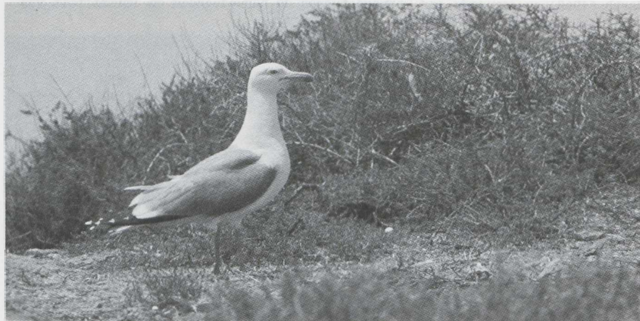
62. Mediterrane Geelpootmeeuw/Mediterranean Yellow-legged Gull Larus cachinnans michahellis , Isles Chaffarines, Marokko, mei 1977 (Jan Steenhart)

De herkenning van jonge en onvolwassen Geelpootmeeuwen wordt in het algemeen moeilijker geacht dan het in feite is. Opvallend bij eerste kalenderjaar vogels is de gemberbruine kleur van de donkere delen (donkerder dan bij de Zilvermeeuw), de wittere stuit en staartbasis welke contrasteert met de brede zwarte staartband, en de geheel zwarte snavel. In het tweede kalenderjaar worden kop en onderdelen in vergelijking met een Zilvermeeuw erg wit waardoor de vogels mede door de vrij donkere mantel en snavel veel weg hebben van een tweede kalenderjaar Grote Mantelmeeuw L. marinus (cf. Grant 1980).