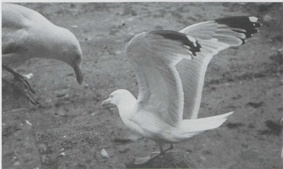
59. Britse Zilvermeeuw/British Herring Gull Larus argentatus argenteus , Brixham (Devon), Engeland, juli 1979

De bepaling van de mantelkleur levert in het veld grote problemen op. Er zijn diverse factoren welke een nauwkeurige bepaling in de weg staan. In dit verband kunnen worden genoemd: de positie van de meeuw ten opzichte van de zon en de waarnemer, de houding van de meeuw, de kleur van de omgeving en de atmosferische omstandigheden. Verder dient men zich te realiseren dat bij de hier behandelde meeuwen aanzienlijke verschillen in mantelkleur kunnen optreden. Tenslotte dient erop te worden gewezen dat waarnemers bestaande kleurverschillen niet op de zelfde wijze interpreteren. (In navolging van Landsborough Thomson (1964) gebruik ik het woord 'mantel' voor het aaneengesloten geheel van rug-, schouder- en vleugeldekveren uitsluitend wanneer dat uit één kleur bestaat.)