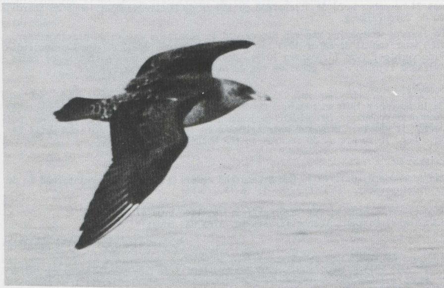
58. Pomarine Skua/Middelste Jager Stercorarius pomarinus , first calendar year, Lake Mead, Clark County (Nevada), USA, 24 November 1976

Gerald J. OreeI, Postbus 51273, 1007 EG Amsterdam