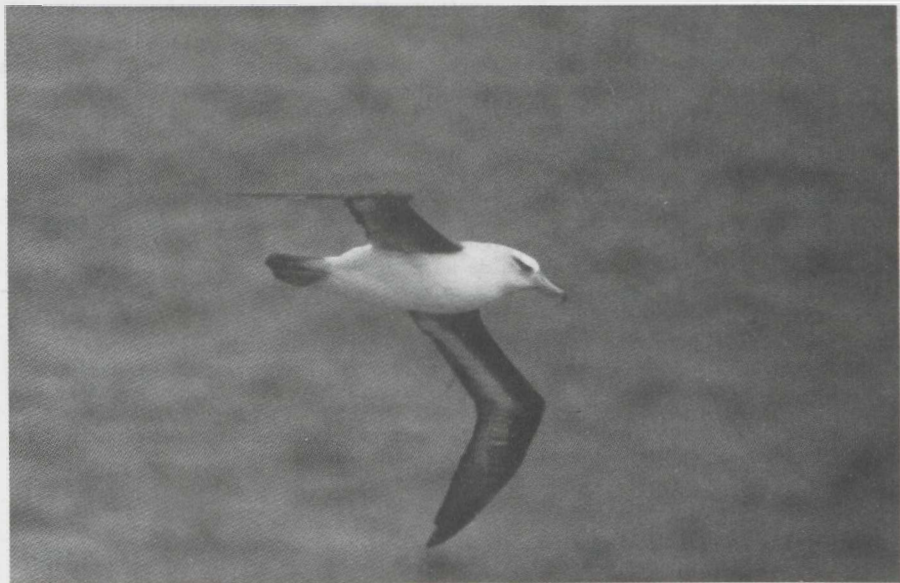
56-57. Wenkbrauwalbatros/Black-browed Albatross Diomedea melanophris , Friendship Islands, 25 november 1975