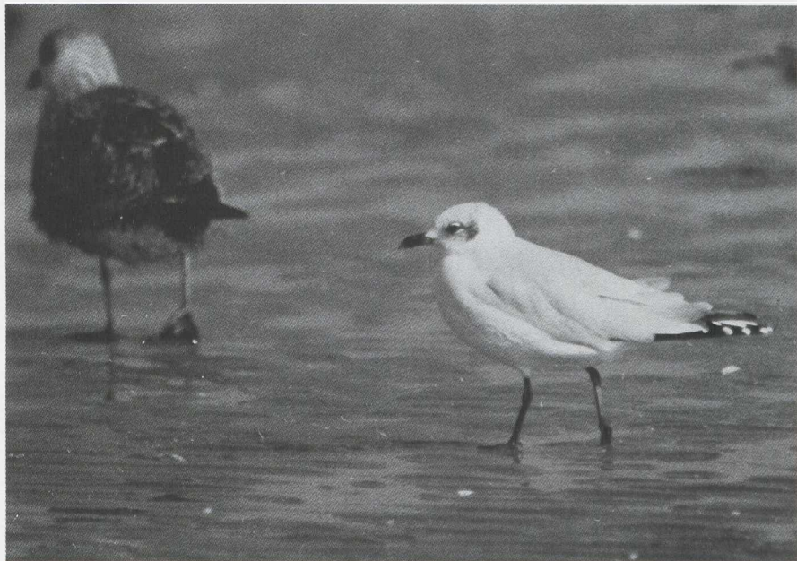
5. Raadselvogel 4/Mystery bird 4. Oplossing in het volgende nummer/Solution in the next issue