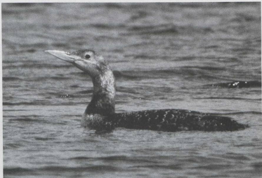
1-3. Geelsnavelduiker/White-billed Diver Gavia adamsii , tweede kalenderjaar, Nederhorst den Berg (NH), 1 maart, 31 maart, 4 april 1980