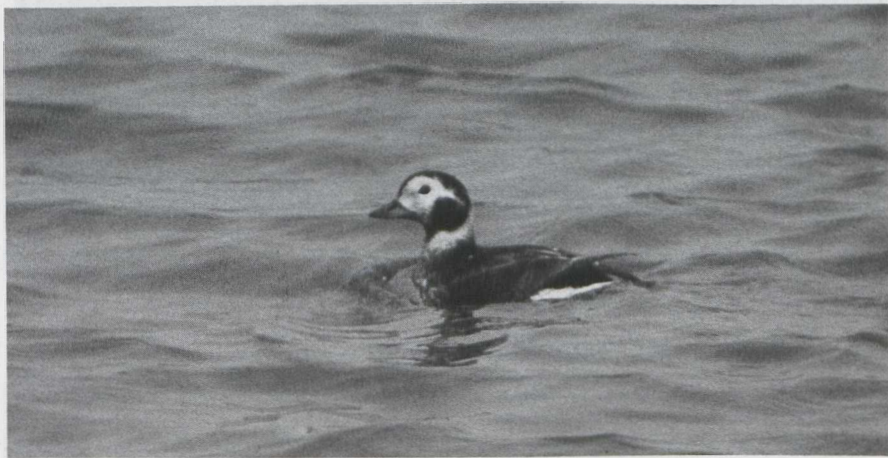
25. Long-tailed Duck/IJseend Clangula hyemalis , Lelystadhaven, Oostelijk Flevoland (Zuidelijke IJsselmeerpolders), 16 March 1980 (René Pop)