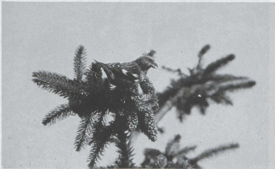
21. Two-barred Crossbill/Witbandkruisbek Lewia leucoptera , immature male, Skanör (Skåne), Sweden, 10 October 1971

Arnoud B. van den Berg, Duinlustparkweg 98, 2082 EG Santpoort-Zuid J.J. (Han) Blankert, Leendert Meeszstraat 8, 2015 JS Haarlem