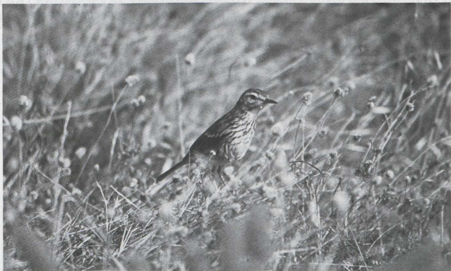
16. Berthelot's Pipit/Berthelots Pieper Anthus berthelotii , Madeira, July 1976 (Rombout de Wijs)

near Bugio. The best time is just before sunset. In the late afternoon and early evening of 21 March 1976 at least 12 were seen flying to Bugio. The Desertas (Chao, Deserta Grande and Bugio) are uninhabited. Only during the tourist season boat-trips are organized to the Desertas. One should inquire with the Organizaçao Nautica 'Amigos do Mar' at the town pier in Funchal or with the Tourist Office.