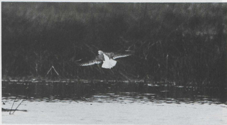
9-12. Poelruiter/Marsh Sandpiper Tringa stagnatilis , Spaarnwoude (NH), 24 september 1979