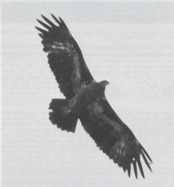
7. Pallas's Fish Eagle/Witbandzccarend Haliaeetus leucoryphus , immature, Mongolia, 1977 (Alan Kitson)

(1) AvdB and GO noticed a rather pale crown, nape and hindneck. They observed also a dark ear-mark running towards the neck. AK - who studied some 'young' birds in Mongolia - speaks of an Osprey Pandion haliaetus -like mask. Two 'sub-adult' birds in the collection of the Zoölogisch Museum (ZMA) at Amsterdam (Noord-Holland) show a similar mask. (2) According to AK Pallas's Fish Eagle has a relatively short neck. Cramp & Simmons (1980) state however the opposite.