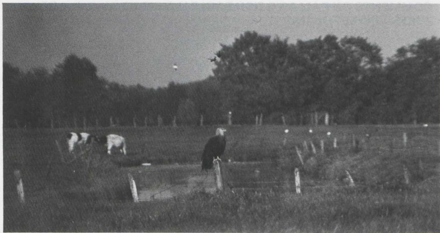
6. Witbandzeearend/Pallas's Fish Eagle Haliaeetus leucoryphus , volwassen, Barneveld (Gld), 12 oktober 1976 (Anton Bruijn)

(In verband met de vraag of de vogel wild is of niet, kan men zich afvragen welke waarde toegekend kan worden aan meldingen door personen of instanties dat een bepaalde vogel bij hen ontsnapt is. Verkeerde naamgevingen (al of niet opzettelijk) aan verhandelde en in gevangenschap verblijvende dieren komen veel voor. In dit verband zij erop gewezen dat twee als Witbandzeearend vermelde voorwerpen op de lijst van de in de jaren 70 in Nederland geprepareerde vogels van het Ministerie voor Cultuur, Recreatie en Maatschappelijk Werk (MCRM) beide foutief gedetermineerd bleken te zijn (Anton Bruijn pers. med. ).)