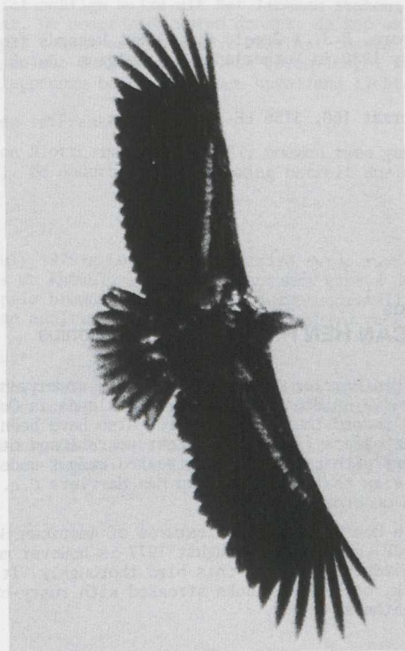
8. White-tailed Eagle/Zeearend Haliaeetus albicilla , immature, Zuidelijk Flevoland (ZIJP), winter van 1978/79 (John Nobel)

Edward J. van IJzendoorn, 3e Schinkelstraat 45, 1075 TK Amsterdam