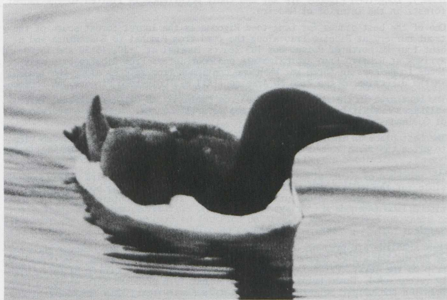
15. Brünnich's Guillemot/Dikbekzeekoet Uria lomvia , Edgeøya (Spitsbergen), Norway, 26 July 1977