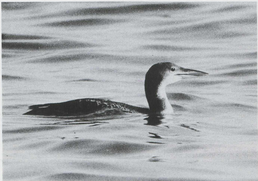
4. IJsdruiker/Great Northern Diver Gavia immer , IJmuiden (NH), 11 maart 1978 (Ulco Glimmerveen)

De vis in de bek van de IJsdruiker is een zeedonderpad Myoxocephalus scorpius . Dit is een nogal benige bodemvis met een grote kop die bezet is met stekels. Hij is algemeen langs de Nederlandse en Belgische kust, voornamelijk in ondiep water bij pieren en dijken. De IJsdruiker die van 18 februari tot en met 8 april 1978 bij de pieren van IJmuiden (NH) verbleef, ving deze visse soort regelmatig maar hij voedde zich ook met krabben en jonge platvissen. De foto (plaat 51, hier verkleind herhaald) is genomen door Ulco Glimmerveen op 11 maart 1978; plaat 4 toont de zelfde vogel.