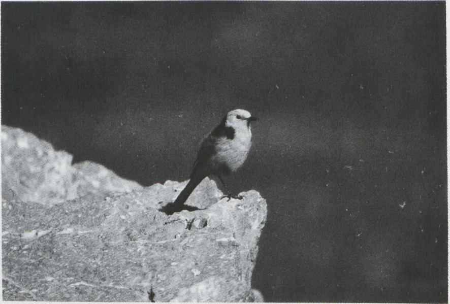
19. Male Black-backed Citrine Wagtail/Zwartrugcitroenkwikstaart Motacilla citreola calcarata , Afghanistan, May 1978