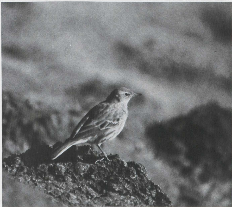
17. Water Pipit/Waterpieper Anthus spinoletta , IJmuiden (Noord-Holland), 1 March 1980

Water Pipit Anthus spinoletta and Rock Pipit Anthus petrosus are separate species according to the Dutch Birding Association checklist (G.J. Oreeel in preparation). Editors