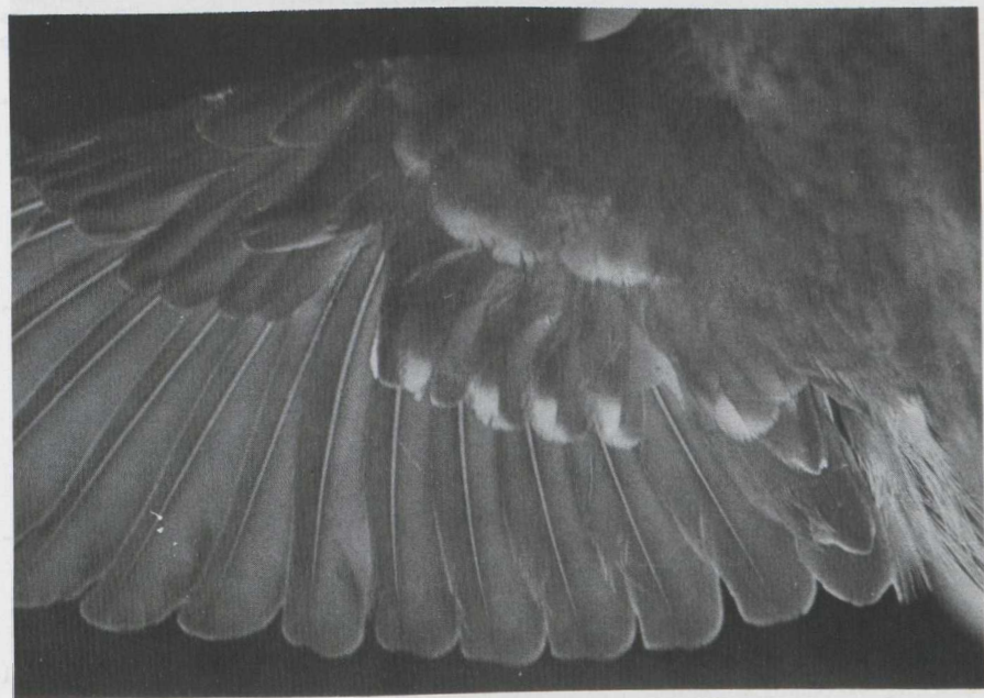
22-23. Crossbill/Kruisbek Loxia curvirostra , captured by J. Boel at Brasschaat (Antwerpen), Belgium on 25 September 1979 (Sjef de Ridder)