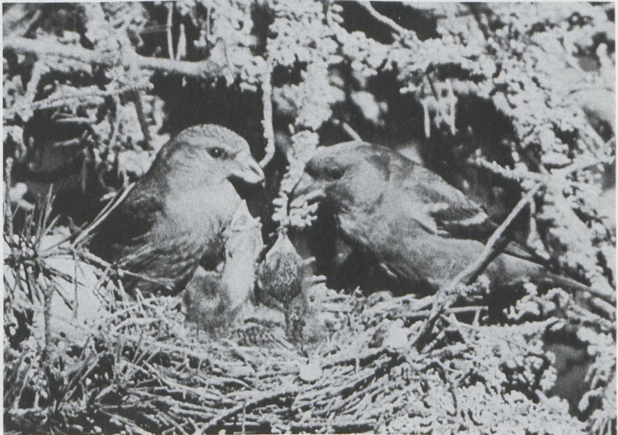
20. Crossbills/Kruisbekken Loxia curvirostra , Finland. Note the prominent wing-bars of the male

We examined skins in the Rijksmuseum van Natuurlijke Historie (RMNH) at Leiden (Zuid-Holland) in order to evaluate the above five characters. We studied 36 male Crossbills and seven male and four female Eurasian Two-barred Crossbills L. l. bifasciata . (1) Crossbill can show prominent whitish wing-bars and whitish fringed tertials. This wing-pattern can strongly resemble that of female Two-barred Crossbill with reduced white. (2) Male Two-barred Crossbill can be identical in colour with Crossbill. (3) Male Two-barred Crossbill can miss the dark mantle and shoulders. (4) Two-barred Crossbill and Crossbill are identical in size. (5) Size and shape of bill of Two-barred Crossbill and Crossbill strongly overlap. (It should however be noted that North American Two-barred Crossbill L. l. leucoptera is smaller and has a smaller and finer bill.)