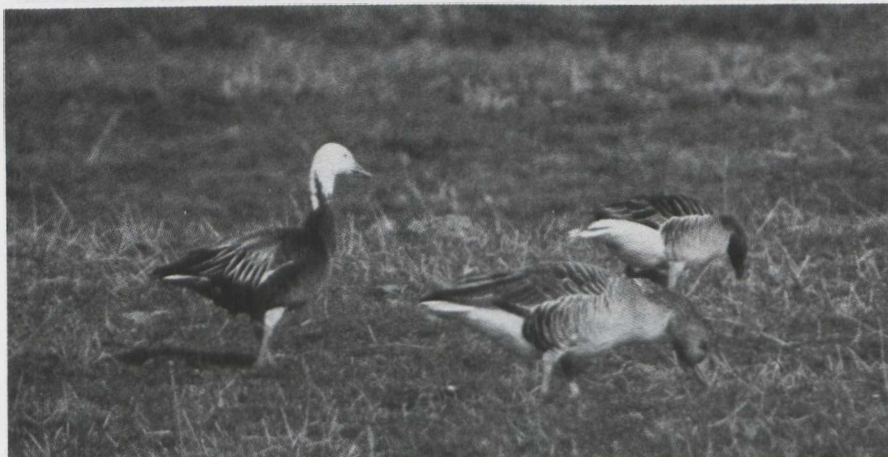
24. Snow Goose/Sneeuwgans Anser caerulescens , blue phase, Plaat van Scheelhoek, Goeree (Zuid-Holland), 22 March 1980

The occurrence of Snow Geese/Sneeuwganzen Anser caerulescens was quite remarkable. Apart from the usual one or two among the Pink-footed Geese/Kleine Rietganzen Anser brachyrhynchus at Oudega (Friesland) and the few odd ones elsewhere, six stayed at Eijsden (Limburg) during January-February, no less than 30 on 11 February near Fochteloo (Friesland) and 18 (including one blue phase) from 18 until 21 April at Andijk (Noord-Holland). The well known blue phase bird at the Plaat van Scheelhoek, Goeree (Zuid-Holland) is still present.