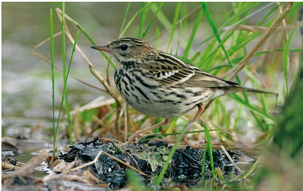
51 Pechora Pipit / Petsjorapieper Anthus gustavi , Goodwick Moor, Pembrokeshire, Wales, 22 November 2007 (Dave Stewart)