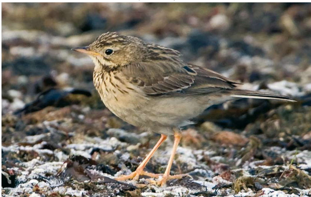
52 Blyth's Pipit / Mongoolse Pieper Anthus godlewskii , Apelviken, Halland, Sweden, 24 December 2007 (Mikael Nord)