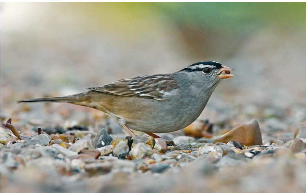
55 White-crowned Sparrow / Witkruingors Zonotrichia leucophrys , Cley, Norfolk, England, 22 January 2008 (Dave Stewart)