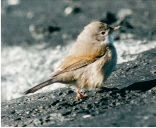
126 Brilgrasmus / Spectacled Warbler Sylvia conspicillata , IJmuiden, Noord-Holland, 2 november 1984 (René van Rossum)