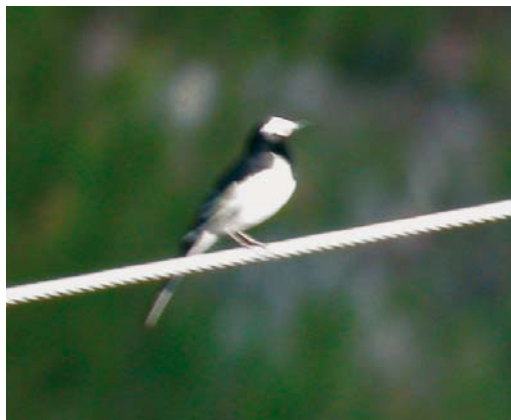
116 Himalayan Wagtail / Himalayakwikstaart Motacilla albooides , male, Kaskelen, Almaty province, Kazakhstan, 30 May 2007 (Alain Baccaert)

On 3-6 October 2004, three Winter Wrens T. t. troglodytes were trapped at Dzhanlybek in the Volga-Ural semi-desert, West Kazakhstan province (Nikita