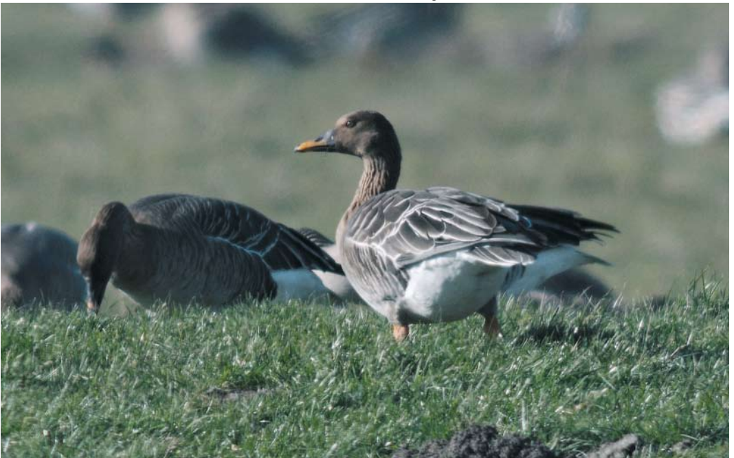
157 Taigarietgans / Taiga Bean Goose Anser fabalis , Inlaagpolder, Spaarndam, Noord-Holland, 17 februari 2008