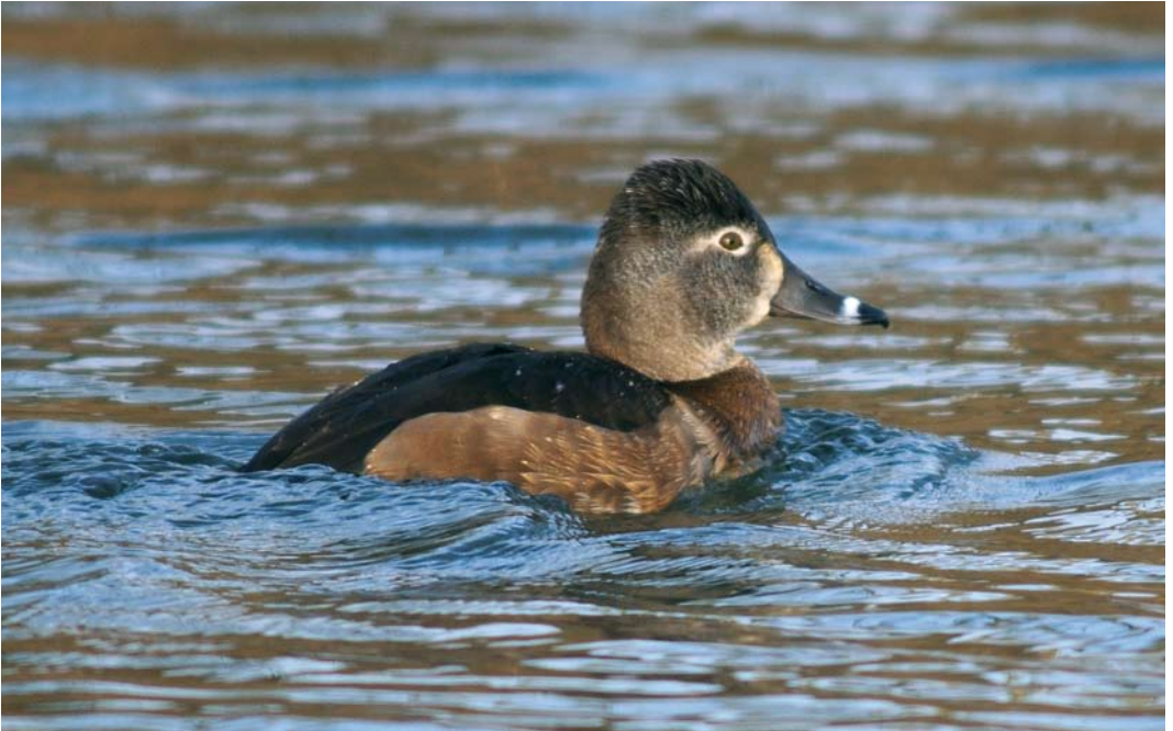
156 Ringsnaveleend / Ring-necked Duck Aythya collaris , vrouwtje, Eijsden, Limburg, 25 februari 2008 (Arnoud B van den Berg)