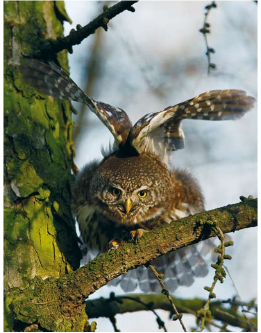
89-90 Dwerguil / Eurasian Pygmy Owl Glaucidium passerinum , Valkenswaard, Noord-Brabant, 11 februari 2008 91 Dwerguil / Eurasian Pygmy Owl Glaucidium passerinum , Valkenswaard, Noord-Brabant, 11 februari 2008 92 Dwerguil / Eurasian Pygmy Owl Glaucidium passerinum , Valkenswaard, Noord-Brabant, 11 februari 2008