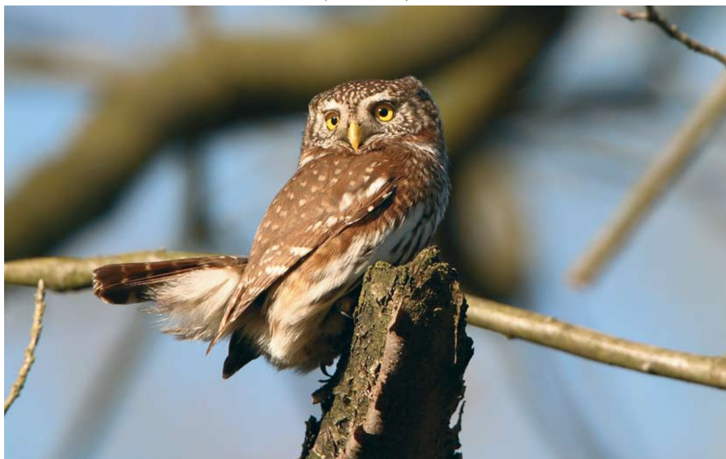
85 Dwerguil / Eurasian Pygmy Owl Glaucidium passerinum , Valkenswaard, Noord-Brabant, 11 februari 2008 (Michel Veldt)

VLEUGEL Donkerbruin met witte vlekken. Handpennen met witte dwarsbandering op regelmatige afstand. Op tertials twee vage lichte dwarsbandjes zichtbaar. Onderzijde van handpennen