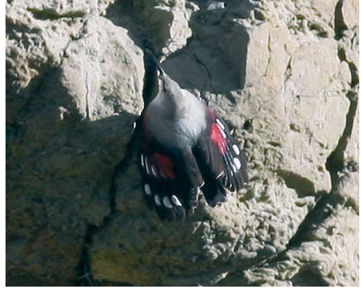
153-154 Wallcreeper / Rotskruiper Tichodroma muraria , Wimereux, Pas-de-Calais, France, 2 February 2008