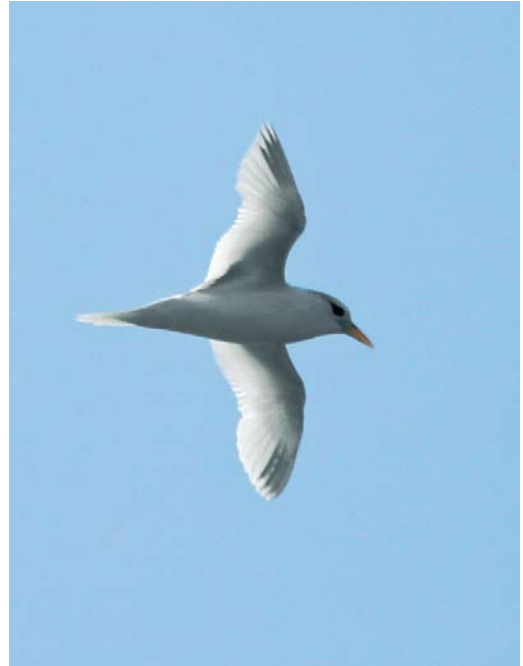
143 White-tailed Tropicbird / Witstaartkeerkringvogel Phaethon lepturus , immature, 200 nautical miles west of Flores, Azores, 20 October 2007 cf Dutch Birding 30: 41, 2008

Cumbria and in Fife and Orkney, Scotland, three single Snow Geese A caerulescens were also present. Two presumed blue-morph Ross's Geese with domestic geese near Werkendam, Noord-Brabant, the Netherlands, in February were presumed escapes but still noteworthy because this morph is extremely rare in this species. A Pink-footed Goose wintered on São Miguel, Azores, from at least 27 January to late February. Record numbers of rare geese in north-eastern Italy in January-February included three Lesser White-fronted Geese A erythropus , one Barnacle Goose and three Red-breasted Geese B ruficollis . The male Steller's Eider Polysticta stelleri present in Iceland since 1998 remained all winter. The southernmost King Eiders Somateria spectabilis were first-winter males in Calvados, Normandie, France, from 12 February and in Devon, England, from 20 February. A male American Scoter Melanitta americana stayed with Black Scoters M nigra at St Peter Ording, Schleswig-Holstein, Germany, on 13-17 February. Four Velvet Scoters M fusca at Jaffa port on 31 January constituted the seventh record for Israel. In the Netherlands, the male Bufflehead Bucephala albeola at Barendrecht, Zuid-Holland, remained for its fourth winter from 28 October 2007 into March; at least two ringed (presumed escaped) individuals were seen during the same period. The male Barrow's Goldeneye B islandica