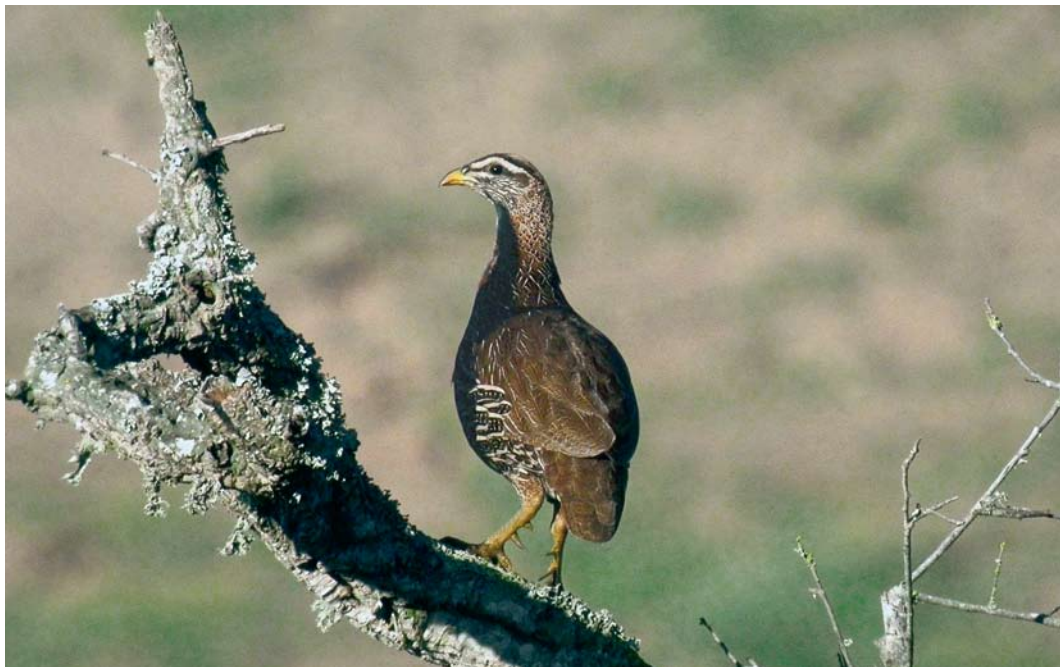
149 Double-spurred Francolin / Barbarijse Frankolijn Francolinus bicalcaratus ayesha , Sidi Bettache, Morocco, 2 March 2008