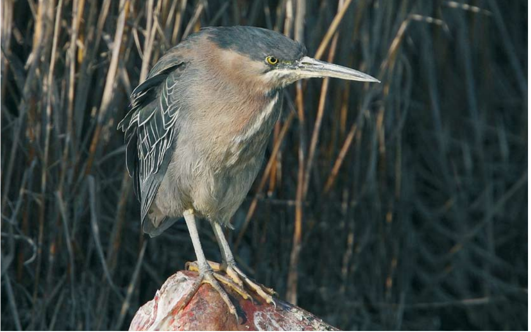
140 Green Heron / Groene Reiger Butorides virescens , Berre l'Étang, Bouches-du-Rhône, France, 21 February 2008