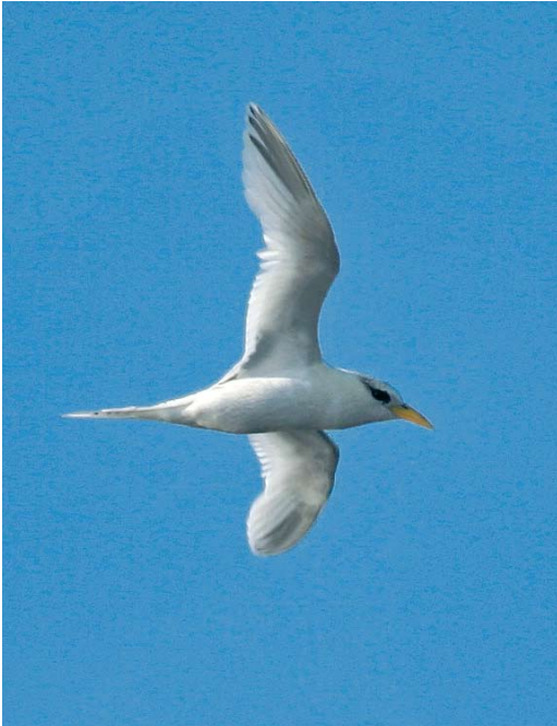
142 White-tailed Tropicbird / Witstaartkeerkringvogel Phaethon lepturus , immature, 303 nautical miles west of Flores, Azores, 18 October 2007 (Ricardo Guerreiro) cf Dutch Birding 30: 41, 2008