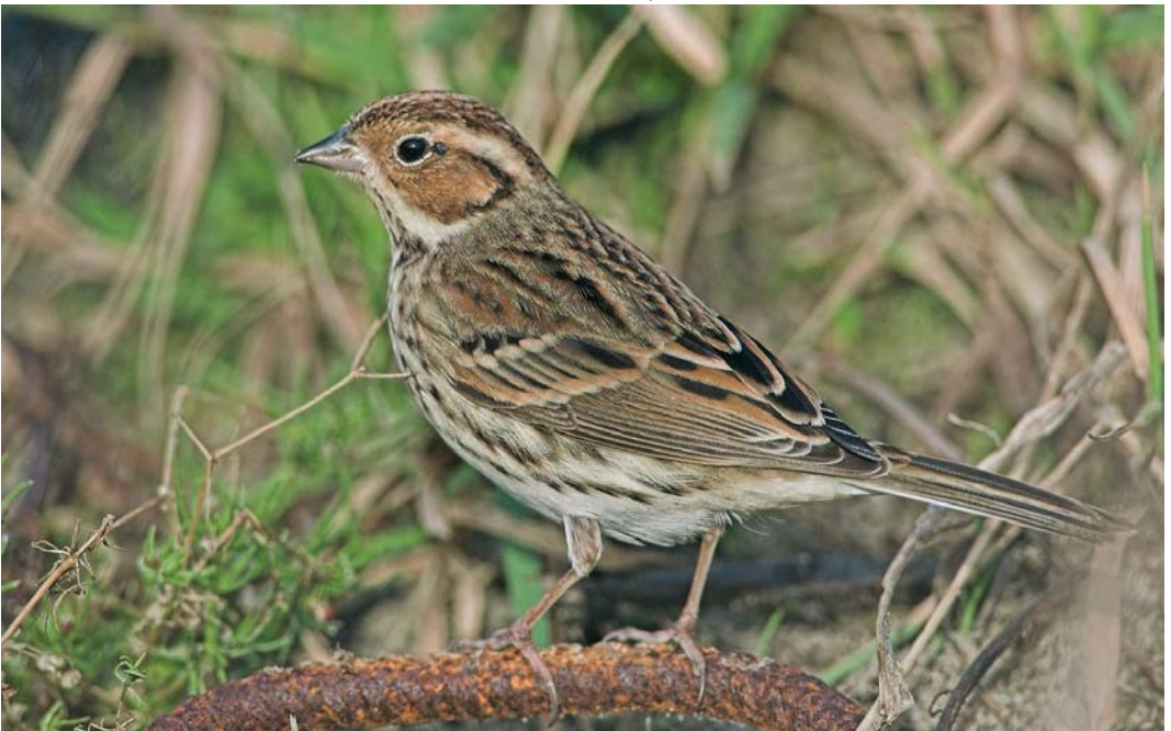
164 Dwerggors / Little Bunting Emberiza pusilla , Katwijk aan Zee, Zuid-Holland, 26 januari 2008