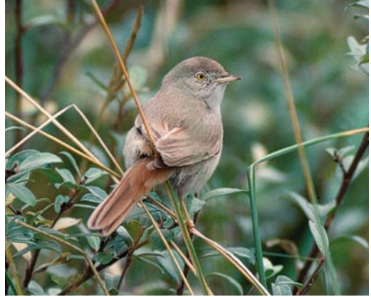
127 Woestijngasmus / Asian Desert Warbler Sylvia nana , Amsterdamse Waterleidingduinen, Zandvoort, Noord-Holland, 31 oktober 1988

tes cyanus (toen Parus cyanus ), Rotsmus Petronia petronia en Grijze Gors. In 1984 waren Rotskruiper Tichodroma muraria en Sneeuwvink Montifringilla nivalis reeds gesneuveld. Ondersoorten zouden in een later artikel worden behandeld, waaronder twee taxa die nu als soort bekend staan.