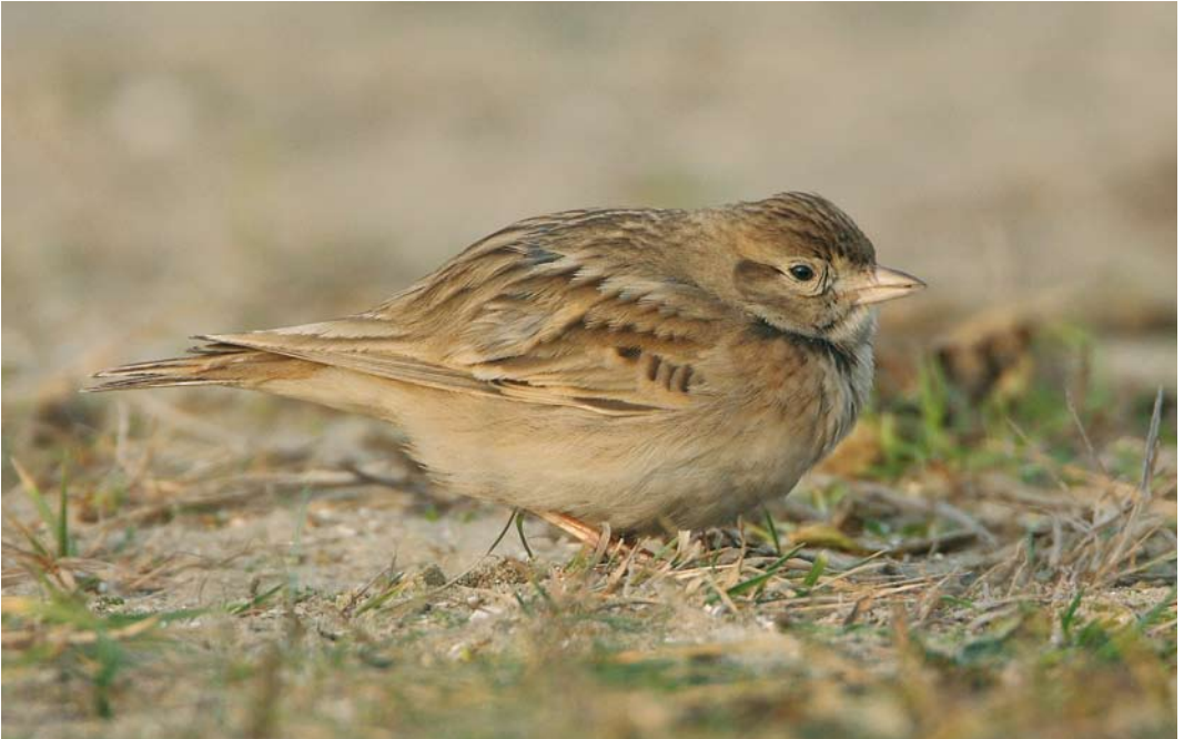
163 Kortteenleeuwerik / Greater Short-toed Lark Calandrella brachydactyla , Castricum aan Zee, Noord-Holland, 3 januari 2008 (Roland Jansen)