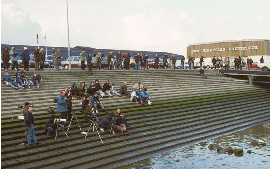
195 Vogelaars bij Ivoormeeuw / birders at Ivory Gull Pagophila eburnea (rechts / right), Stellendam, Zuid-Holland, 13 februari 1990 (Arnaud B van den Berg)