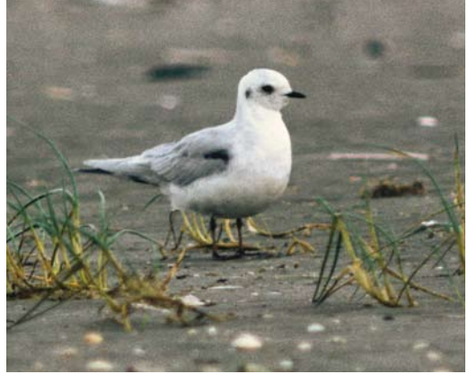
204 Ross' Meeuw / Ross's Gull Rhodostethia rosea , IJmuiden, Noord-Holland, 27 november 1992 (Arnoud B van den Berg)

dacht, ging vergeefs naar Point Barrow in Alaska. Dat Ross' Meeuw een van de eerste goede soorten na zijn overlijden was werd daarom op de Zuidpier regelmatig gememoreerd. De American Birding Association (ABA) publiceerde in 2008 een terugblik op het 40-jarig bestaan (Birding 40: 26-27, 2008). Die terugblik ging over de eerste twitchbare Ross' Meeuw voor Noord-Amerika begin 1975, een waarneming die alle Amerikanen met iets van een lijst in beweging zette. Zo kocht wijlen Stuart Keith, de man van de handboekserie The birds of Africa , een retourtje Johannesburg-New York om de vogel te kunnen zien. In de terugblik wordt gesteld dat uiteindelijk niet de meeuw het belangrijkste was van deze gebeurtenis maar het feit dat 100en of zelfs 1000en vogelaars zich plotseling realiseerden dat ze hun hobby met vele anderen deelden. Tegen deze achtergrond is duidelijk waarom Ross' Meeuw een paar jaar later als ideale soort voor het DBA-logo werd verkozen en waarom deze eerste Nederlandse twitchbare zo'n bijzondere gebeurtenis was. Honderden vogelaars, waaronder velen uit de ons omringende landen, stroomden toe om de meeuw die ruim een week aanwezig bleef te bewonderen. Het jaar ging daarna uit als een nachtkaars – ook de teruggekeerde Bronskopeend kon de hartslag niet meer versnellen.