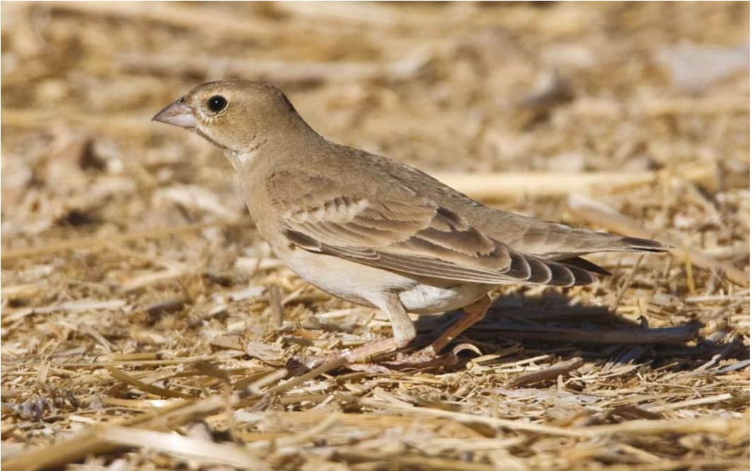
230 Pale Rockfinch / Bleke Rotsmus Carpospiza brachydactyla , Eilat, Israel, 12 March 2008