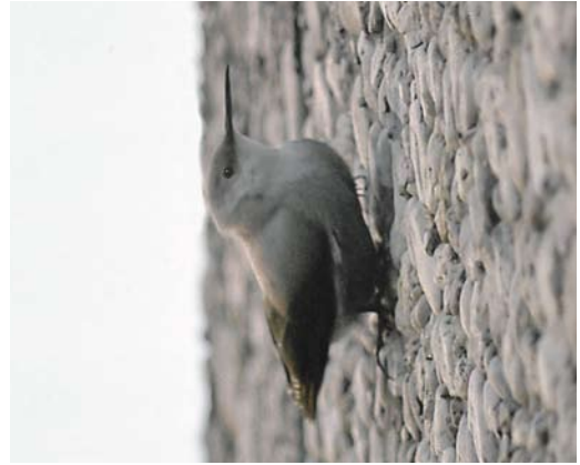
200 Rotskruiper / Wallcreeper Ticodroma muraria , Amsterdam-Buitenveldert, Noord-Holland, 15 november 1989 (Arnoud B van den Berg)

Limburg. De eerste knaller leek de Sneeuwuil Bubo scandiacus (toen Nyctea scandiaca ) te worden die werd gemeld vanaf Ameland, Friesland. Enkele 10-tallen vogelaars staken op 11 maart vol goede moed over en kwamen tot hun verrassing thuis met een mooie Kleine Geelkuijkaketoe Cacatua sulphurea . De Amelandse avonturen waren goed voor een stukje op de voorpagina van Trouw op 13 maart 1989.