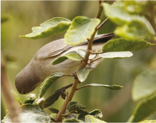
206 Mystery photograph V (May)