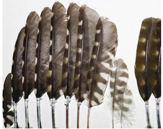
FIGURE 26 Grey-headed Woodpecker / Grijskopspecht Picus canus , juvenile, old stuffed specimen without any data. Same individual as in figure 25. Wing gives entirely grey impression.