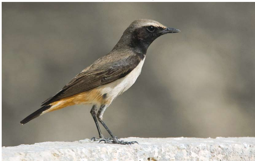
227 Kurdistan Wheatear / Westelijke Roodstaartpauit Oenanthe xanthopyrna , Eilat, Israel, 8 March 2008 (Thomas Krumenacker)