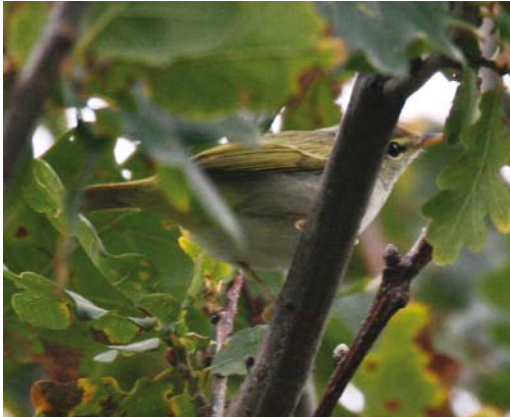
171 Kroonboszanger / Eastern Crowned Warbler Phylloscopus coronatus , Katwijk aan Zee, Zuid-Holland, 5 oktober 2007

opnamen te maken die zeer waarschijnlijk op deze vogel betrekking hadden (tijdens de opname werd de vogel in kwestie niet gezien). De volgende dag werd hij ondanks intensief zoeken niet meer teruggevonden (Zuyderduyn 2007).