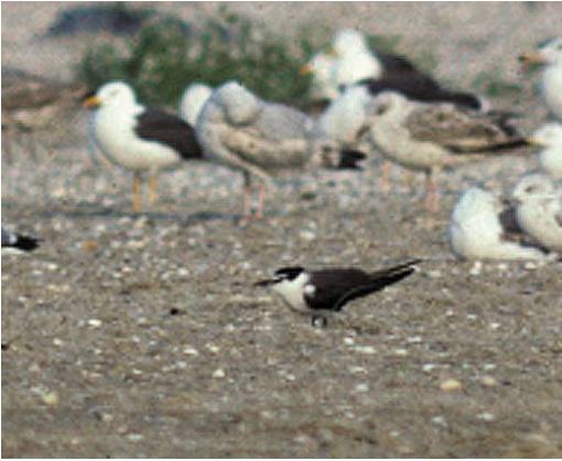
199 Brilsteren / Bridled Tern Onychoprion anaethetus , IJmuiden, Noord-Holland, 24 juli 1989 (Arnoud B van den Berg)