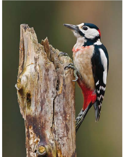
174-175 Great Spotted Woodpecker / Grote Bonte Specht Dendrocopos major pinetorum , male, Maarheeze, Noord-Brabant, Netherlands, 13 January 2008. Note red breast-band.