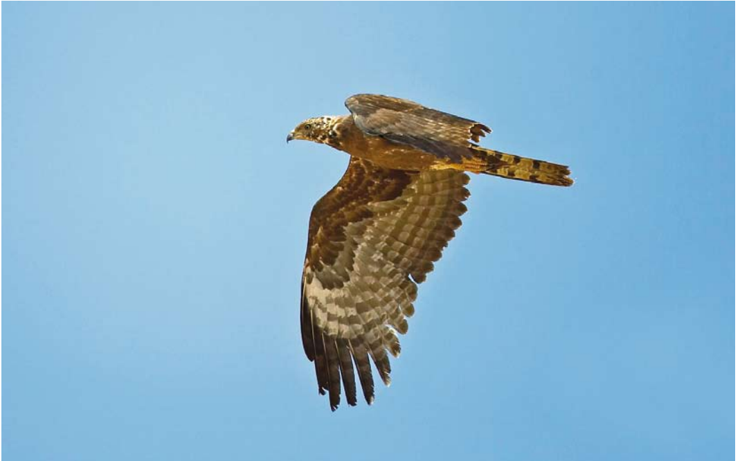
210 Crested Honey Buzzard / Aziatische Wespendiff Pernis ptilorhyncus , Eilat, Israel, 24 March 2008 (Dick Forsman)