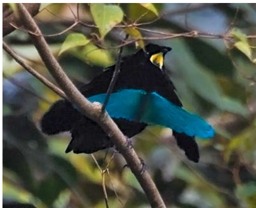
193 Superb Bird-of-Paradise / Kraagparadijsvogel Lophorina superba , Baiyer river, Western Highlands, Papua New Guinea, 15 October 2006

get the requested permits for. The accompanying photographs were all taken during private trips in October 2006 and July-August 2007.