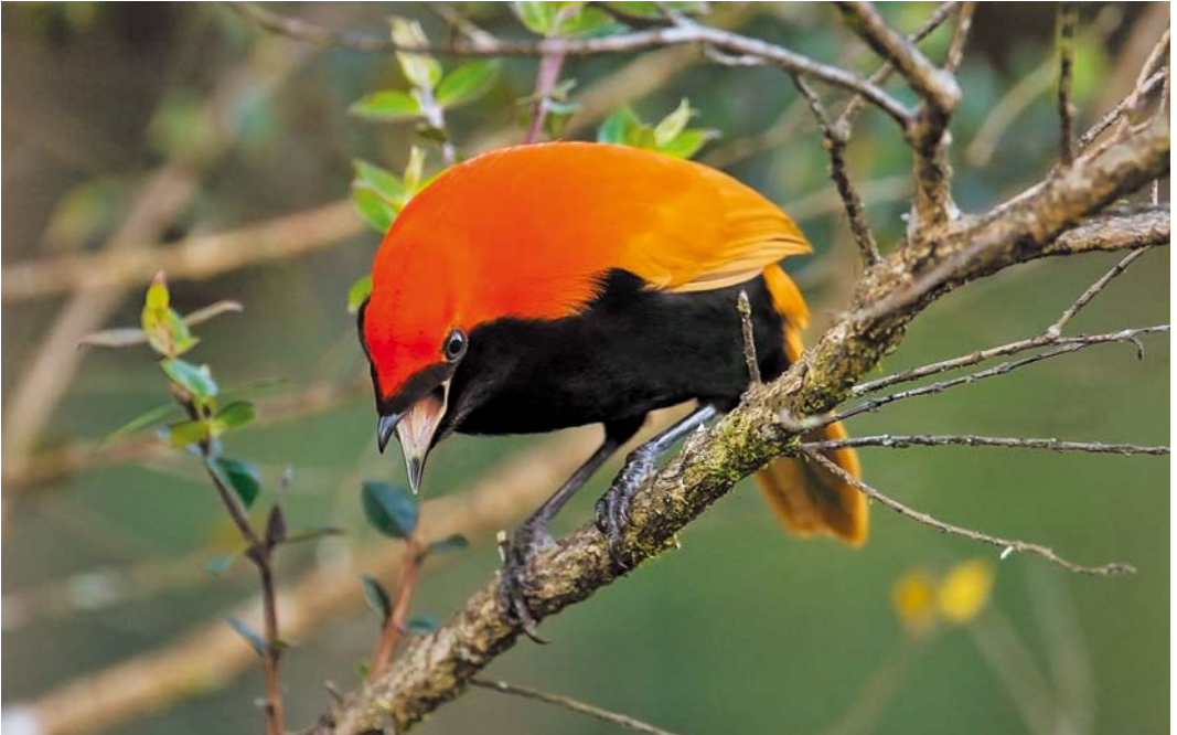
185 Crested Bird-of-Paradise / Macgregors Paradijsvogel Cnemophilus macgregorii , male, Mount Hagen, Enga Province, Papua New Guinea, 22 July 2007 (Otto Plantema)