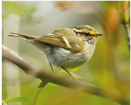
239 Hutchins' Canadese Gans / Hutchins's Cackling Goose Branta hutchinsii hutchinsii , met Brandganzen / Barnacle Geese B leucopsis , Taczoyil, Friesland, 11 april 2008 240-241 Hybride Ringsnavelmeeuw x Stormmeeuw / hybrid Ring-billed x Common Gull Larus delawarensis x canus canus , derde kalenderjaar, Zandvoortseweg, Middelburg, 24 april 2008 242 Pallas' Boszanger / Pallas's Leaf Warbler Phylloscopus proregulus , Scheveningse Bosjes, Den Haag, Zuid-Holland, 13 april 2008

Daarnaast werden er ook enkele als zekere 'escape' ontmaskerd, zoals bij Egmond, Noord-Holland, en op Wieringen. Een ongeringd mannetje Bronskopeend Anas falcata bevond zich van 30 januari tot 26 maart bij 's-Gravezande, Zuid-Holland. De lokatie en het tamme gedrag van de vogel wezen echter op een herkomst uit gevangenschap. Van 16 tot 27 maart verbleef een mannetje Amerikaanse Smient A americana in de omgeving van Amerongen, Utrecht, en Maurik, Gelderland, maar was bij tijd en wijle moeilijk te lokaliseren. Van 6 tot 23 april hield een mannetje zich op in de Middelpolder bij Amstelveen, Noord-Holland, en vanaf 28 april was een exemplaar present samen met een geringd mannetje Bronskopeend in de Veenhuizerstukken, Groningen. Het 'vlieg wonder' (een exemplaar met een slechte vleugel) van het Kinselmeer, Noord-Holland, werd voor het laatst op 29 maart gemeld. Het mannetje Blauwvleugeltaling A discors dat zich van 25 februari tot 8 april ten