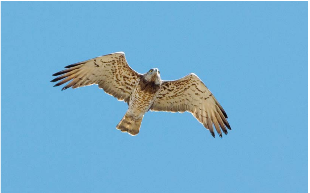
211 Short-toed Snake Eagle / Slangenarend Circaetus gallicus , Loozerheide, Limburg, Netherlands, 5 May 2008 (René Weenink)