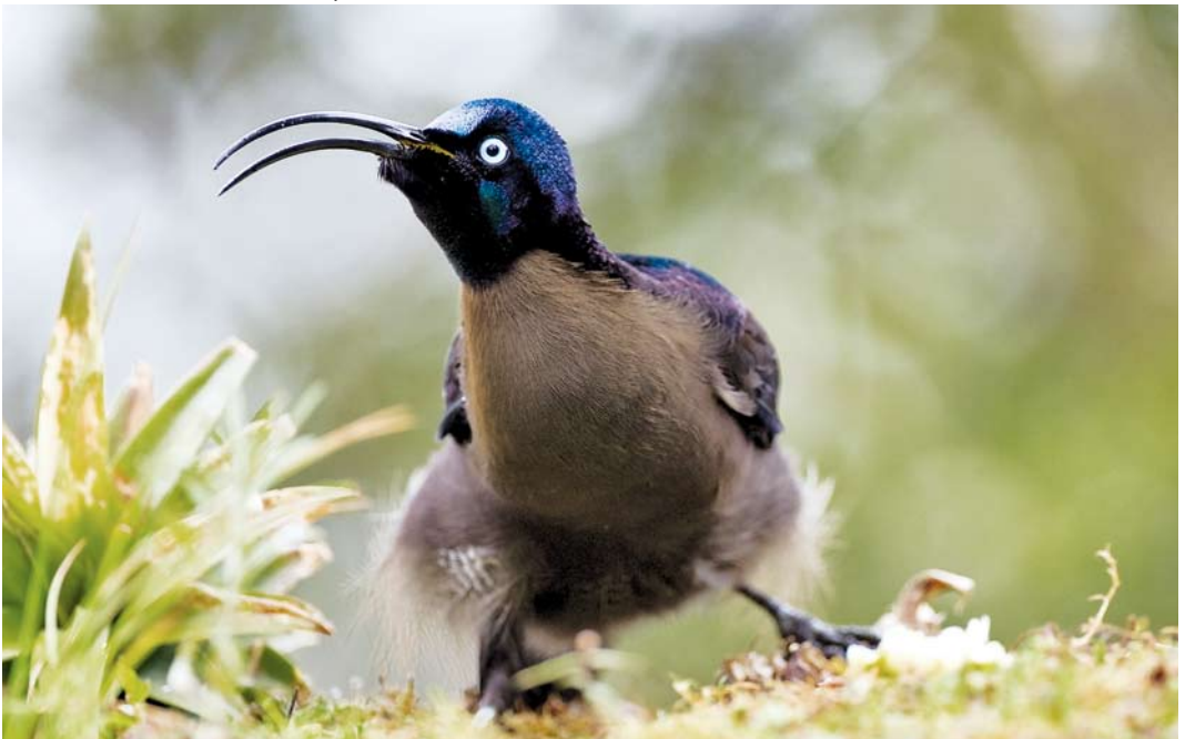
182 Brown Sicklebills / Bruine Sikkelsnavel Epimachus meyeri , male, Mount Hagen, Enga Province, Papua New Guinea, 16 October 2006