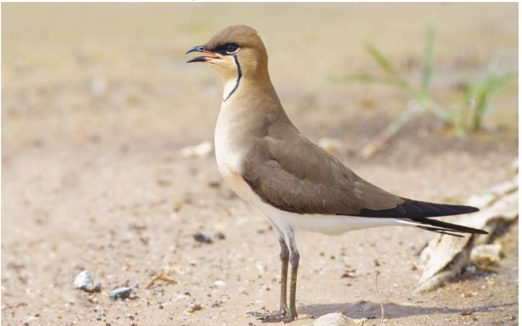
215 Oriental Pratincole / Oosterse Vorkstaartplevier Glareola maldivarum , adult, Pivot fields, Al Jahra, Kuwait, 25 April 2008 (Abdulrahman Al-Sirhan)