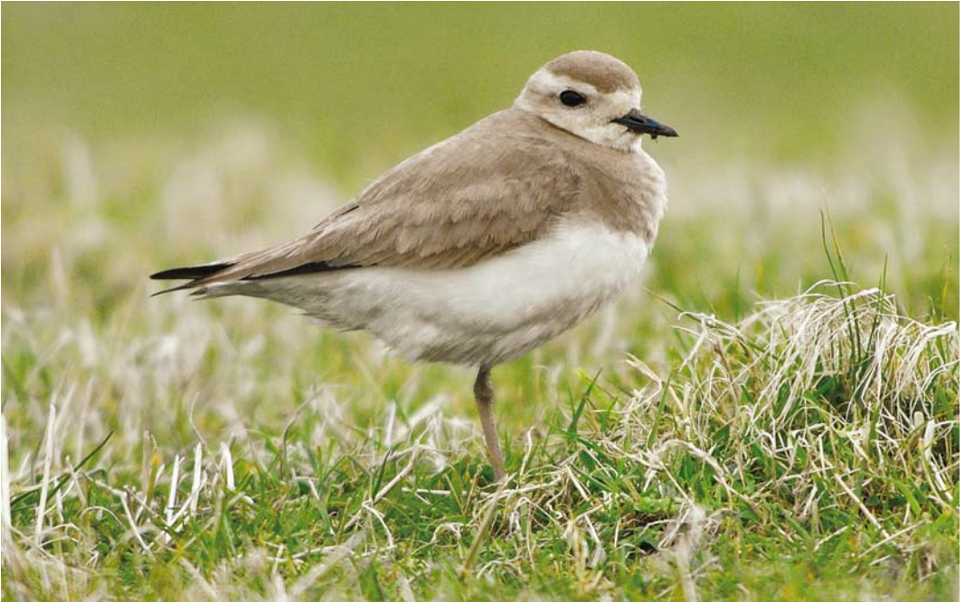
212 Caspian Plover / Kaspische Plevier Charadrius asiaticus , female, Fair Isle, Shetland, Scotland, 1 May 2008 (Paul Baxter)