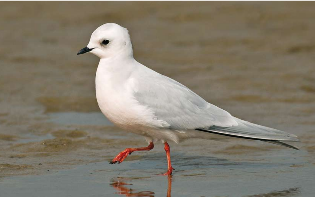
225 Ross's Gull / Ross' Meeuw Rhodostethia rosea , adult, Fairhaven lake, Lancashire, England, 21 April 2008