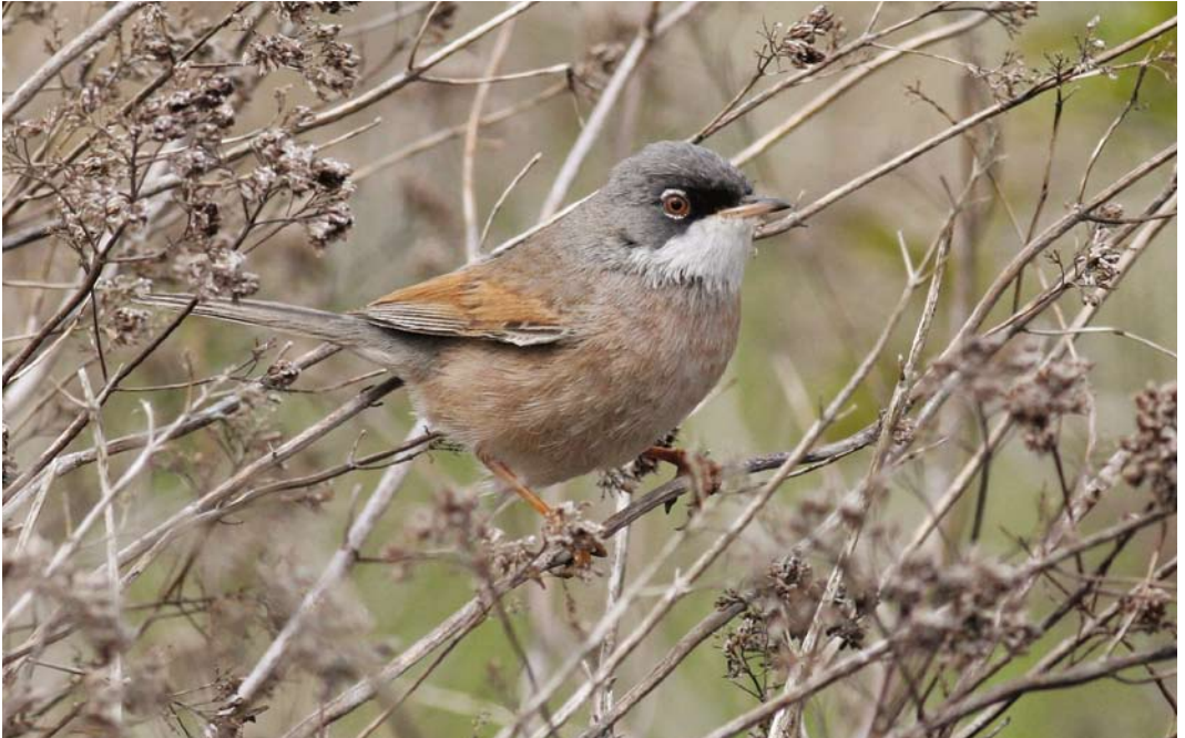
228 Spectacled Warbler / Brilgrasmus Sylvia conspicillata , male, Krümml, Fribourg, Switzerland, 22 April 2008 (Adrian Jordi)