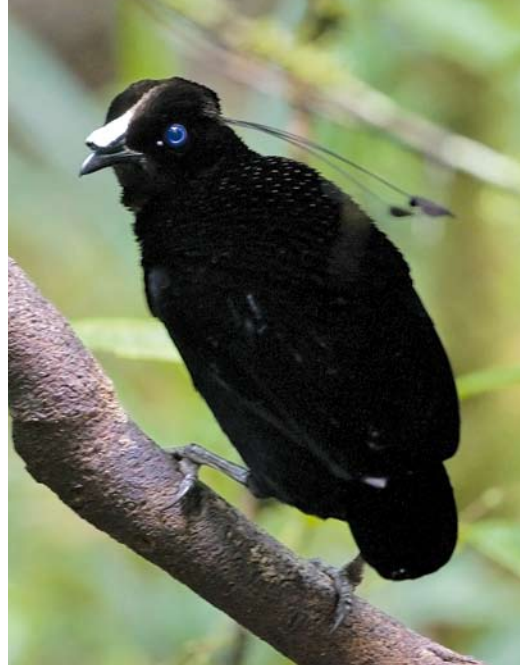
190 Lawes's Parotia / Lawes' Parotia Parotia lawesii , female, Tari, Southern Highlands, Papua New Guinea, 15 July 2007 ( Otto Plantema ) 191 Lawes's Parotia / Lawes' Parotia Parotia lawesii , male, Tari, Southern Highlands, Papua New Guinea, 15 July 2007 ( Otto Plantema ) 192 Ribbon-tailed Astrapia / Lintstaartastrapia Astrapia mayeri , male, Mount Hagen, Enga Province, Papua New Guinea, 16 October 2006 ( Otto Plantema )