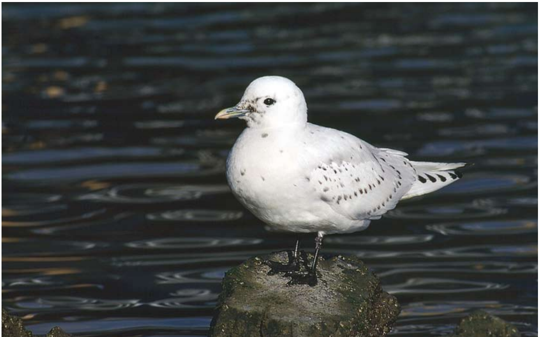
196 Ivoormeeuw / Ivory Gull Pagophila eburnea , eerste-winter, Stellendam, Zuid-Holland, 12 februari 1990 (Hans Gebuis)