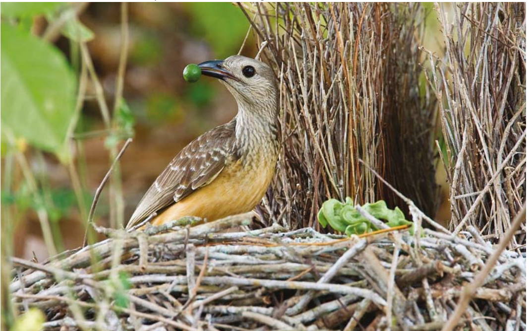
186 Fawn-breasted Bowerbird / Okerbuikprieelvogel Chlamydera cerviniventris , male, Port Moresby, Papua New Guinea, 6 August 2007