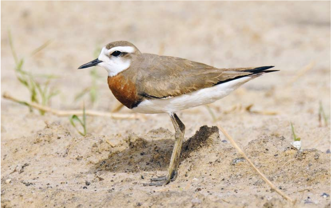
214 Caspian Plover / Kaspische Plevier Charadrius asiaticus , Pivot fields, Al Jahra, Kuwait, March 2008