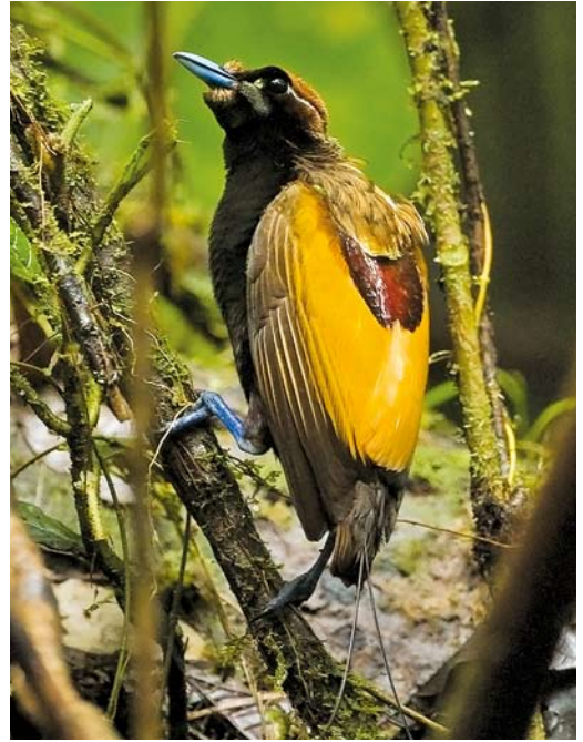
176 Papuan tribesman showing hair dress with feathers of various species of bird-of-paradise, Tari, Southern Highlands, Papua New Guinea, 18 July 2007 ( Otto Plantema ) 177 Magnificent Bird-of-Paradise/Geelkraagparadijsvogel Diphyllodes magnificus , male, Kiunga, Western Province, Papua New Guinea, 30 July 2007 ( Otto Plantema ) 178 Raggiana Bird-of-Paradise / Raggi's Paradijsvogel Paradisaea raggiana , male, Port Moresby, Papua New Guinea, 4 August 2007 ( Otto Plantema )