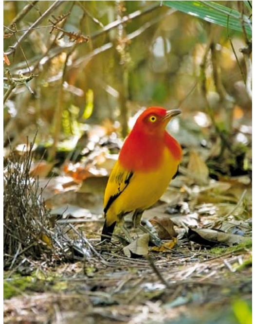
187 Lesser Bird-of-Paradise / Kleine Paradijsvogel Paradisaea minor , male, Baiyer river, Western Highlands, Papua New Guinea, 21 July 2007 ( Otto Plantema ) 188 Flame Bowerbird / Oranje Prielvogel Sericulus aureus , Kiunga, Western Province, Papua New Guinea, October 2006 ( Otto Plantema ) 189 King of Saxony Bird-of-Paradise / Wimpeldrager Pteridophora alberti , male, Tari, Southern Highlands, Papua New Guinea, 7 October 2006 ( Otto Plantema )