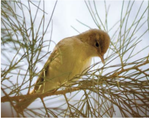
232 Saharan Olivaceous Warbler / Saharaanse Vale Spotvogel Acrocephalus pallidus reiseri , Rissani, Morocco, 12 April 2008