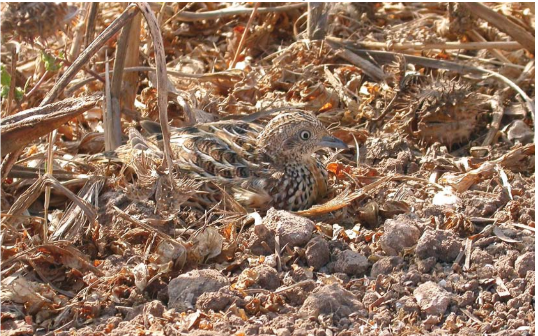
213 Kurrichane Buttonquail / Gestreepte Vechtkwartel Turnix sylvaticus , Oualidia, Morocco, 16 September 2007 (Benoit Maire) cf Dutch Birding 29: 383, 2007