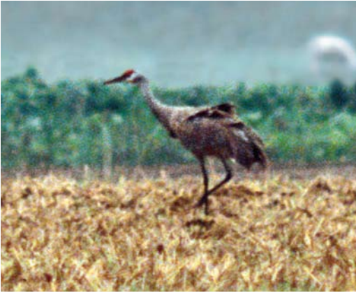
201 Canadese Kraanvogel / Sandhill Crane Grus canadensis , Paesens-Moddergat, Friesland, 29 september 1991