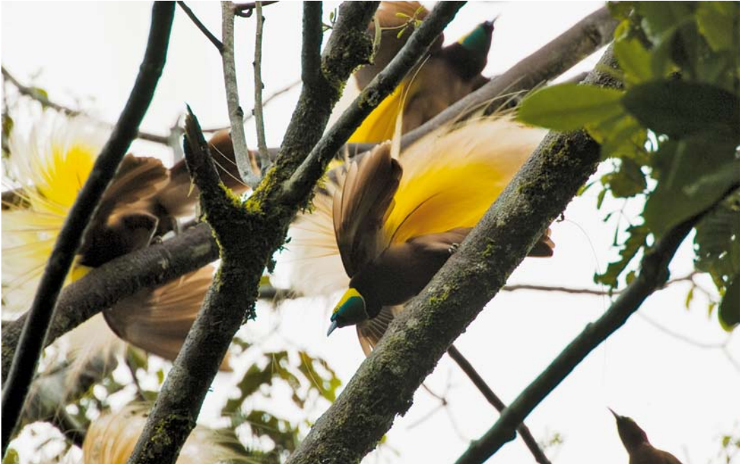
181 Greater Birds-of-Paradise / Grote Paradijsvogels Paradisaea apoda , Kiunga, Western Province, Papua New Guinea, 22 October 2006