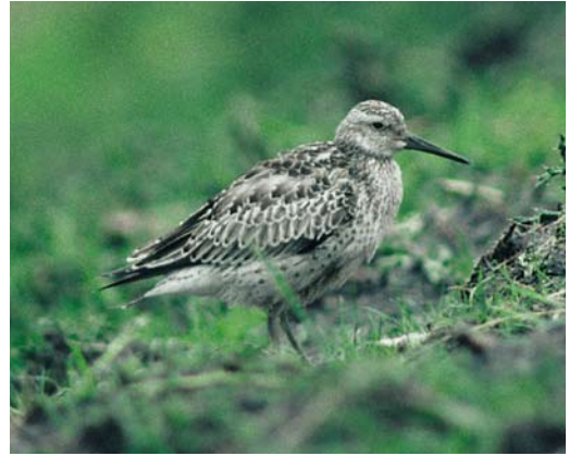
202 Grote Kanoet / Great Knot Calidris tenuirostris , De Putten, Camperduin, Noord-Holland, 30 september 1991

Flevoland, van 24 december tot 23 januari 1991 sloot het jaar af en betekende al het vierde geval van 1990.