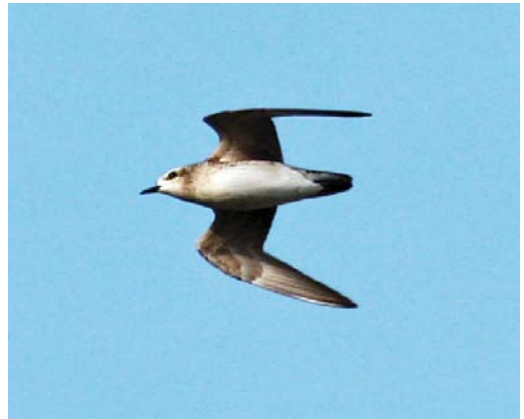
235 Slangenarend / Short-toed Snake Eagle Circaetus gallicus , Spaarnwoude, Noord-Holland, 23 april 2008 (Roy Slaterus) 236 Steppiekiekendief / Pallid Harrier Circus macrourus , Zwaagdijk-Oost, Noord-Holland, 24 april 2008 (Roy Slaterus) 237 Griel / Eurasian Stone-curlew Burhinus oediacnemus , met Grote Zilverreiger / Great Egret Casmerodius albus , Zoetermeer, Zuid-Holland, 31 maart 2008 (Arno van Berge Henegouwen) 238 Amerikaanse Goudplevier / American Golden Plover Pluvialis dominica , Breskens, Zeeland, 20 april 2008 (Jacques Leclercq)

april werd de soort alleen nog gezien in het Lauwersmeergebied, de Carel Coenraadpolder, op de Dollardkwelder en op Schiermonnikoog. Witbuikrotganzen B hrota en Zwarte Rotganzen B nigricans werden hoofdzakelijk aangetroffen tussen Rotganzen B bernicla op bekende plekken, zoals Wieringen, Noord-Holland; Texel, Noord-Holland; Terschelling, Friesland; Schiermonnikoog; het Lauwersmeergebied; en Schouwen-Duiveland, Zeeland. In de meeste gevallen ging het om solitaire exemplaren. Witoogeenden Aythya nyroca werden gemeld tot 25 april bij Huizen, Noord-Holland (vrouwje); van 1 tot 5 maart bij Nederweert, Limburg (mannetje); van 8 tot 24 maart in de Botshol, Noord-Holland (vrouwje); tot ten minste 28 maart bij Castricum, Noord-Holland (paar); van 15 maart tot 12 april in de Oostvaardersplassen, Flevoland (vrouwje); en op 19 april bij Woudenberg, Utrecht (mannetje). Ten minste twee andere gingen als zekere 'escape' de boeken in.