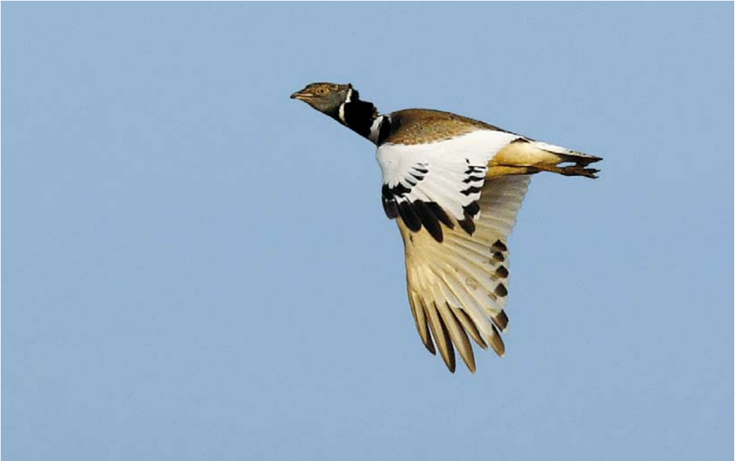
244 Kleine Trap / Little Bustard Tetrax tetrax , mannetje, Korbeek-Dijle, Vlaams-Brabant, 20 april 2008 (Raymond De Smet)

c 108 volgden. Op 17 april werd een Roodpootvalk Falco vespertinus gezien bij Doel, Oost-Vlaanderen; op 22 april was er één bij Fleurus, Hainaut; op 25 april trok er één over Drogen, Oost-Vlaanderen; en op 27 april volgde een vrouwtje in Dendermonde, Oost-Vlaanderen.