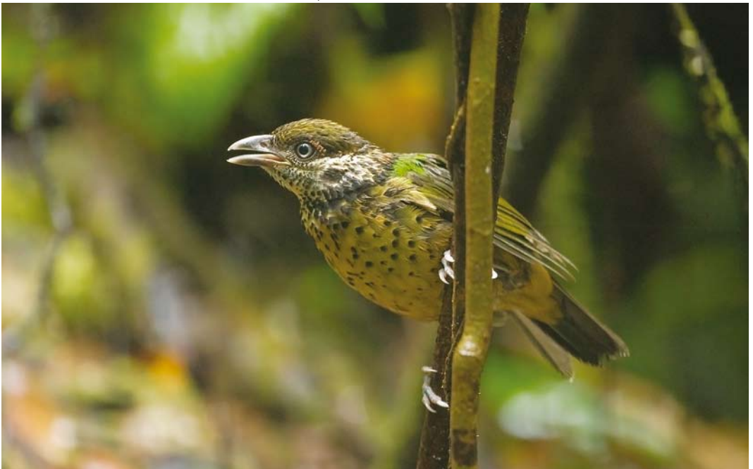
184 White-eared Catbird / Witoorkatvogel Ailuroedus buccoides , Tabubil, Western Province, Papua New Guinea, 27 July 2007