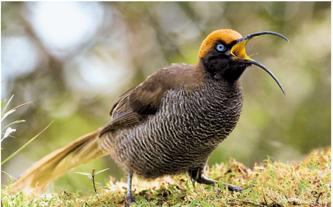
180 Brown Sicklebills / Bruine Sikkelsnavel Epimachus meyeri , female, Mount Hagen, Enga Province, Papua New Guinea, 16 October 2006 (Otto Plantema)