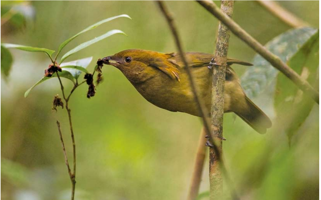
183 Macgregor's Bowerbird / Goudkuiftuiniervogel Amblyornis macgregoriae , Tari, Southern Highlands, Papua New Guinea, 15 July 2007