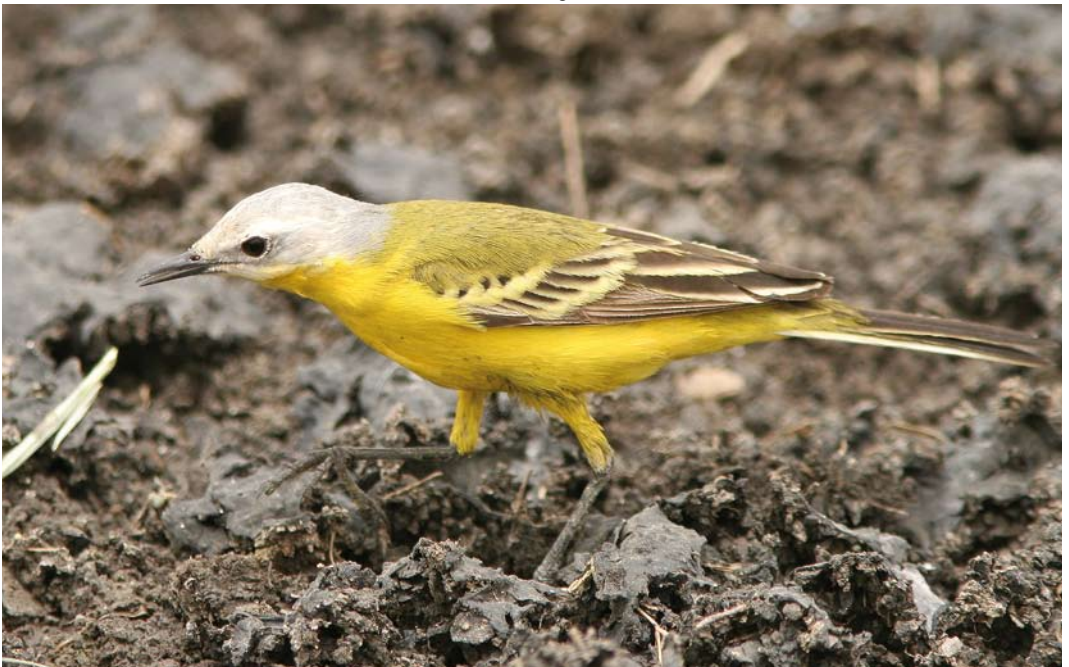
229 White-headed Wagtail / Witkopkwikstaart Motacilla leucocephala , Al Jahra, Kuwait, 28 April 2008 (Pekka Fagel)