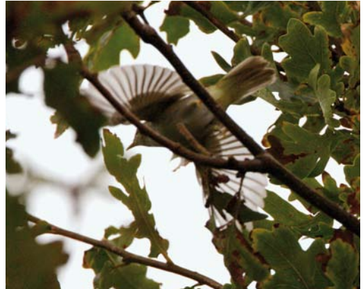
172 Kroonboszanger / Eastern Crowned Warbler Phylloscopus coronatus , Katwijk aan Zee, Zuid-Holland, 5 oktober 2007 (René van Rossum)

NAAKTE DELEN Iris donker, groot lijkend. Bovensnavel geeloranje met donkere punt. Ondersnavel geheel geeloranje. Poot licht vleeskleurig tot gelig.