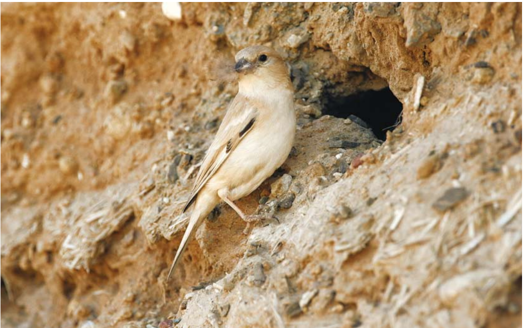
231 African Desert Sparrow / Afrikaanse Woestijnmus Passer simplex simplex , female at nest, Merzouga, Morocco, 26 March 2008