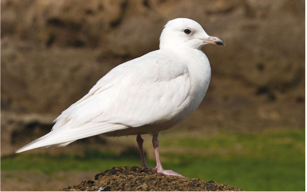
224 Iceland Gull / Kleine Burgemeester Larus glaucoides , Essaouira, Morocco, 2 March 2008 (Harvey van Diek)