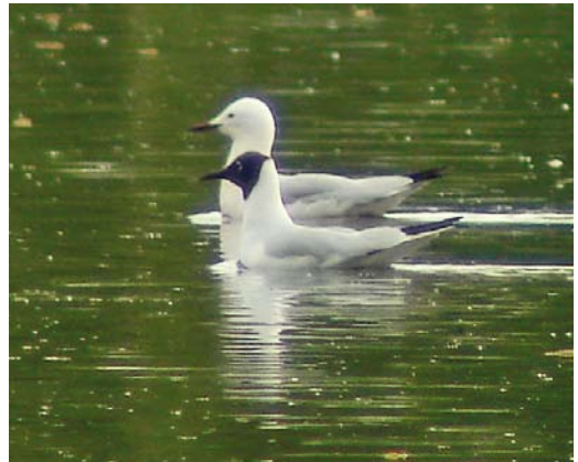
216 Black-winged Kite / Grijze Wouw Elanus caeruleus , Ashura Deh, Golestan, Iran, 17 April 2008 ( Magnus Ullman ) 217 Yellow-billed Kite / Geelsnavelwouw Milvus aegyptius , Tizi-n-Tichka, Morocco, 8 April 2008 ( Arnoud B van den Berg ) 218 Ring-billed Gull / Ringsnavelmeeuw Larus delawarensis , Przemków fishponds, Lower Silesia, Poland, 4 May 2008 ( Zbigniew Kajzer ) 219 Slender-billed Gull / Dunbekmeeuw Chroicocephalus genei , adult, with Black-headed Gull / Kokmeeuw C. ridibundus , Przereb, Zator fishponds, Krakow, Poland, 30 April 2008 ( Zbigniew Kajzer )

calendar-year Bonelli's Eagle A. fasciata tried to migrate from Skagen on 11 April. The first Booted Eagle for Latvia was a dark morph on 7 May. In Denmark, a subadult Asian Imperial Eagle first on Samsø on 27 April was again seen at Feldballe on 3 May. On Madeira, four Red-footed Falcons F. vespertinus were photographed at Ponta do Pargo on 1 May. In the Azores, on 2 May, a weakened adult female was picked up on Faial but died a few hours later. In the first days of May, a large influx of a few 100s became apparent in eastern Spain and south-eastern France. From late April, at least 300 were seen in the Netherlands, including a record group of 35 at Fochteloërveen, Drenthe/Friesland.