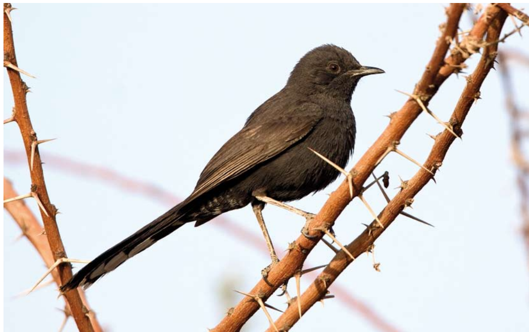
226 Black Scrub Robin / Zwarte Waaierstaart Cercotrichas podobe , Eilat, Israel, 28 March 2008