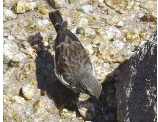
207 Mystery photograph VI (July)

Therefore, both bonelli's warblers can be excluded.