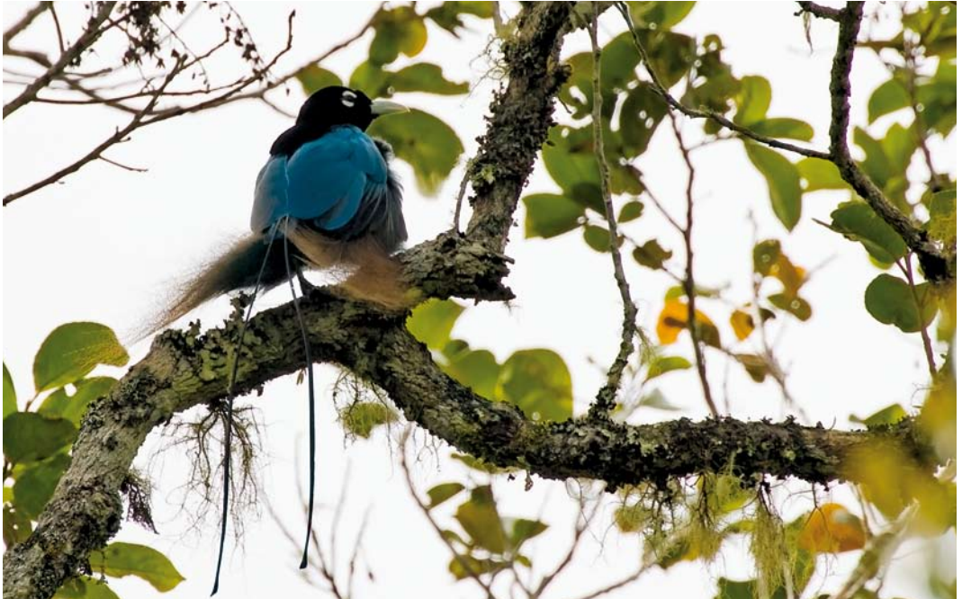
179 Blue Bird-of-Paradise / Blauwe Paradijsvogel Paradisaea rudolphii , male, Tari, Southern Highlands, Papua New Guinea, 8 October 2006