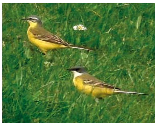
24 Italiaanse Kwikstaart / Ashy-headed Wagtail Motacilla cinereocapilla , mannetje, Flevocentrale, Flevoland, 22 april 2006 25-26 Italiaanse Kwikstaart / Ashy-headed Wagtail Motacilla cinereocapilla , mannetje, Flevocentrale, Flevoland, 22 april 2006 27 Italiaanse Kwikstaart / Ashy-headed Wagtail Motacilla cinereocapilla , mannetje (onder), met Gele Kwikstaart / Blue-headed Wagtail M flava , Flevocentrale, Flevoland, 22 april 2006

betref en nadat een aantal foto's was gemaakt werd de waarneming per semafoon doorgegeven als 'vrij zeker'. Toen de vogel enkele malen een raspande vluchtroep liet horen werd deze determinatie om c 13:30 in 'zeker' veranderd. Na enige tijd uit beeld te zijn geweest werd hij om c 15:30 teruggevonden door Edwin de Weerd en Peter van Wetter en de rest van de dag door enkele 10-tallen vogelaars bekeken. Ook deze vogel was de volgende dag verdwenen.