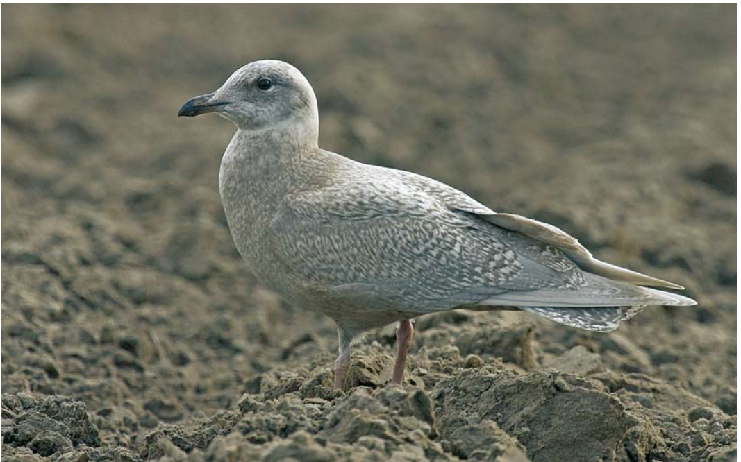
66 Kleine Burgemeester / Iceland Gull Larus glaucoides , eerstejaars, Texel, Noord-Holland, 27 november 2007 (Arend Wassink)