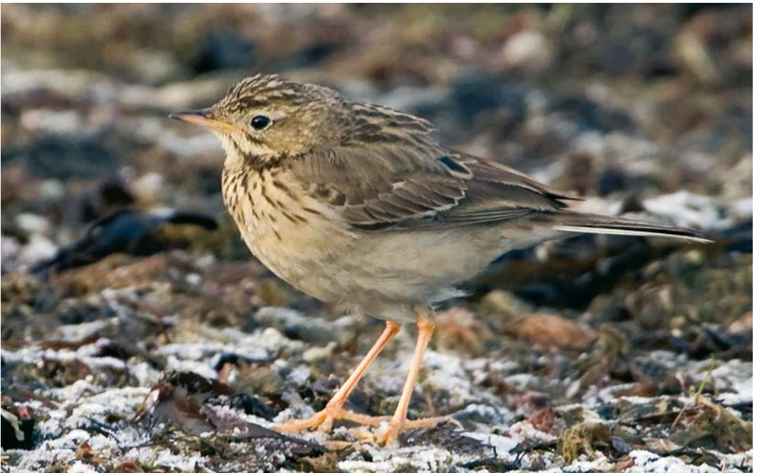
52 Blyth's Pipit / Mongoolse Pieper Anthus godlewskii , Apelviken, Halland, Sweden, 24 December 2007 (Mikael Nord)