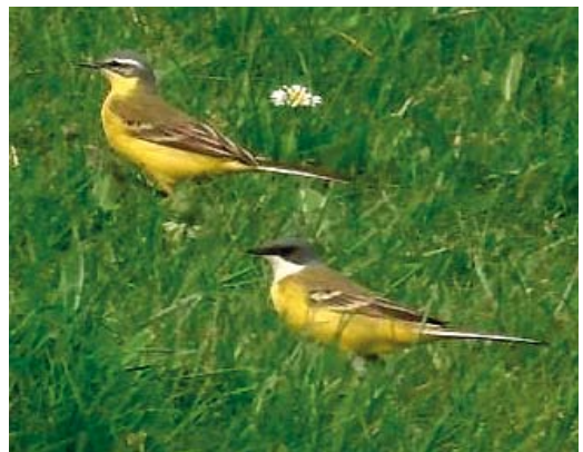
24 Italiaanse Kwikstaart / Ashy-headed Wagtail Motacilla cinereocapilla , mannetje, Flevocentrale, Flevoland, 22 april 2006 25-26 Italiaanse Kwikstaart / Ashy-headed Wagtail Motacilla cinereocapilla , mannetje, Flevocentrale, Flevoland, 22 april 2006 27 Italiaanse Kwikstaart / Ashy-headed Wagtail Motacilla cinereocapilla , mannetje (onder), met Gele Kwikstaart / Blue-headed Wagtail M flava , Flevocentrale, Flevoland, 22 april 2006

betrof en nadat een aantal foto's was gemaakt werd de waarneming per semafoon doorgegeven als 'vrij zeker'. Toen de vogel enkele malen een raspende vluchtroep liet horen werd deze determinatie om c 13:30 in 'zeker' veranderd. Na enige tijd uit beeld te zijn geweest werd hij om c 15:30 teruggevonden door Edwin de Weerd en Peter van Wetter en de rest van de dag door enkele 10-tallen vogelaars bekeken. Ook deze vogel was de volgende dag verdwenen.