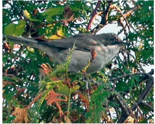
30 Westelijke Orpheusgrasmus / Western Orphean Warbler Sylvia hortensis , Middelburg, Zeeland, oktober 2003

slapen waardoor hij de volgende dag vrij snel werd teruggevonden. Met uitzondering van zondag 2 november, toen het slechte weer en de slechte toegankelijkheid van de bedrijvenavels de waarnemers parten speelden, werd hij tot en met 5 november dagelijks en door vele waarnemers gezien (Wolf 2003).