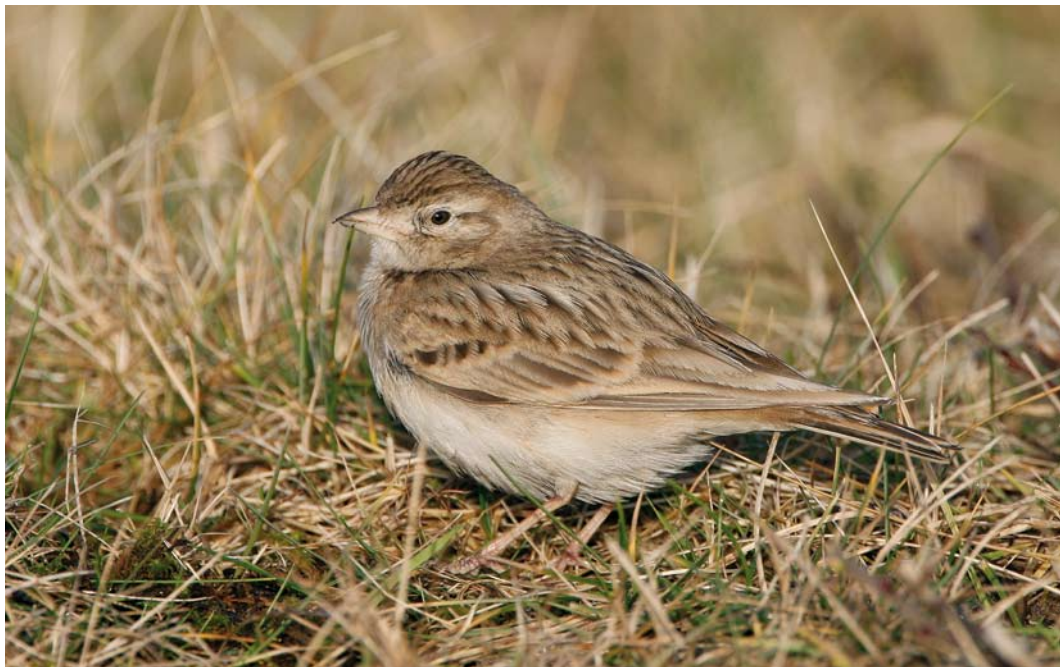
72 Kortteenleeuwerik / Greater Short-toed Lark Calandrella brachydactyla , Castricum, Noord-Holland, 6 januari 2008