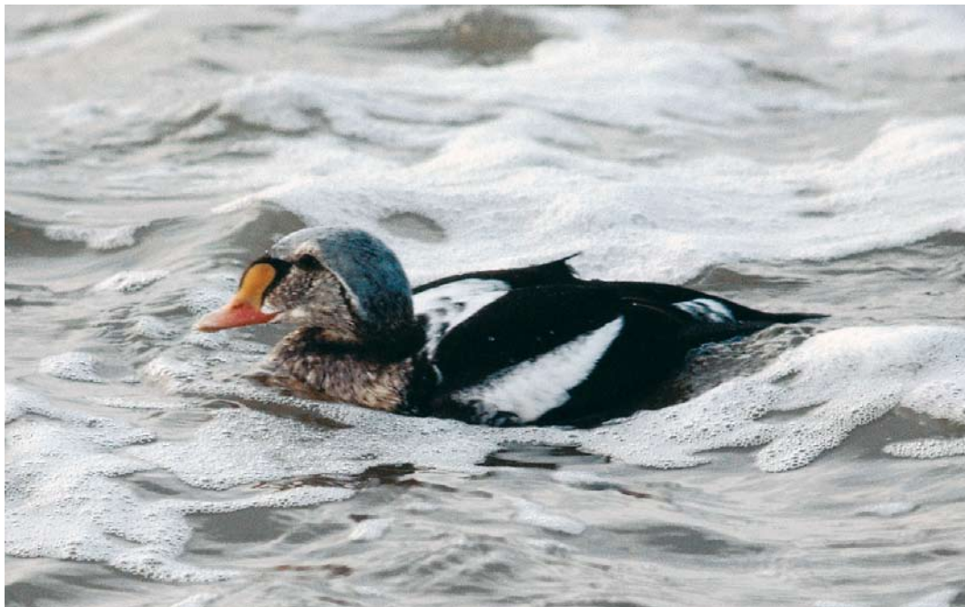
39 Koningseider / King Eider Somateria spectabilis , onvolwassen mannetje, Texel, Noord-Holland, 25 december 1981 (René Pop)