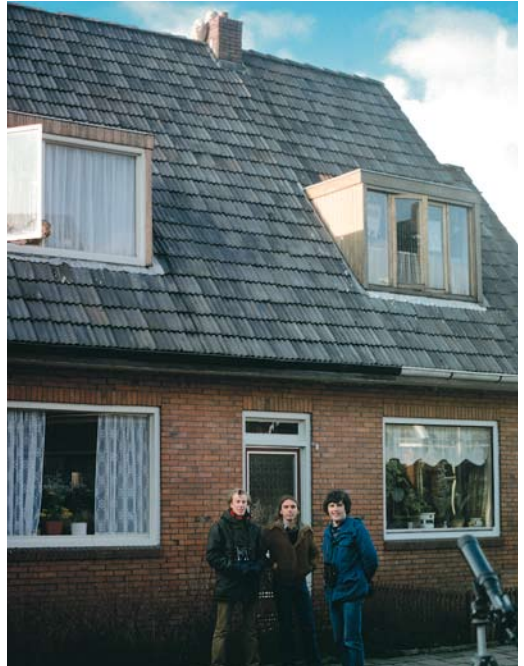
31 Sneeuwuil / Snowy Owl Bubo scandiacus , eerstejaars vrouwtje, Leeuwarden, Friesland, 10 januari 1980 (René Pop) 32 Leeuwarden, Friesland, 10 januari 1980 (Paul de Heer). Van links naar rechts / from left to right: Sneeuwuil / Snowy Owl Bubo scandiacus (boven / above), Han Blankert, René Pop en Edward van IJendoorn 33 Geelnavelduiker / Yellow-billed Loon Gavia adamsii , tweede-kalenderjaar, Kortenhoef, Noord-Holland, 3 augustus 1980 (René Pop)