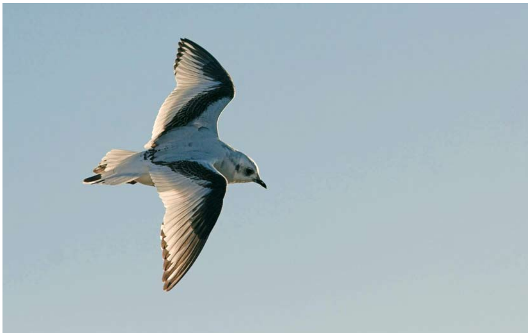
48 Ross's Gull / Ross' Meeuw Rhodostethia rosea , first-year, Esbjerg, Ribe, Denmark, 31 December 2007 ( Ole Zoltan Göller )