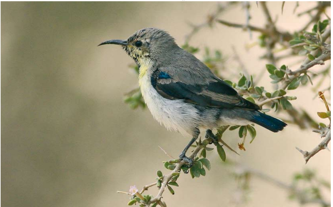
57 Purple Sunbird / Purperhoningzuiger Cinnyris asiaticus , Subiya, Kuwait, 10 January 2008 (Rashed Al-Hajji)