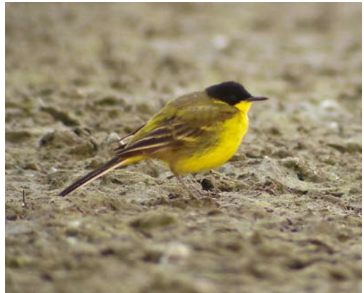
220 Purple Sandpiper / Paarse Strandloper Calidris maritima , Essaouira, Morocco, 2 March 2008 221 Black Lark / Zwarte Leeuwerik Melanocorypha yeltoniensis , male, Winterton North Dunes, Norfolk, England, 21 April 2008 222 Moltoni's Subalpine Warbler / Moltoni's Baardgrasmus Sylvia cantillans moltonii , Taouz, Tafilalt, Morocco, 26 March 2008 223 Black-headed Wagtail / Balkankwikstaart Motacilla feldegg , male, Przereb, Zator fishponds, Krakow, Poland, 3 May 2008

April. The adult Killdeer C vociferus first seen on Mainland, Shetland, Scotland, from 6 April into November 2007 reappeared on 6 March and was seen again over Mousa on 2 April and on Noss on 11 April. In Outer Hebrides, another was found on North Uist on 2 May. In total, four Caspian Plovers C asiaticus were found in Israel, including two at Yotvata until 28 March, one at Elifaz on 3-8 April and one at Ma'agan Michael on 24 April. On 1 May, a female was present on Fair Isle, Shetland; it was last seen the next morning at 10:30. In the Netherlands, a migrating American Golden Plover Pluvialis dominica was photographed while flying past the renowned spring migration observation post at Breskens, Zeeland, on 20 April. Sociable Lapwings Vanellus gregarius occurred at Chozas de Abajo, León, Spain, on 20 March; at La Nava lagoon, Palencia, Spain, on 28 March; at Vercelli, Italy, on 13 April; in the Marne