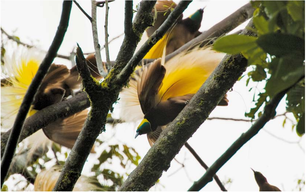
181 Greater Birds-of-Paradise / Grote Paradijsvogels Paradisaea apoda , Kiunga, Western Province, Papua New Guinea, 22 October 2006 (Otto Plantema)