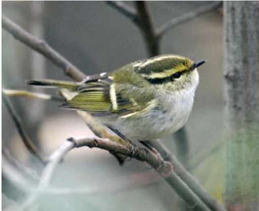
77 Pallas' Boszanger / Pallas's Leaf Warbler Phylloscopus proregulus , Zwarte Pad, Katwijk, Zuid-Holland, 8 december 2007 (Menno van Duijn)