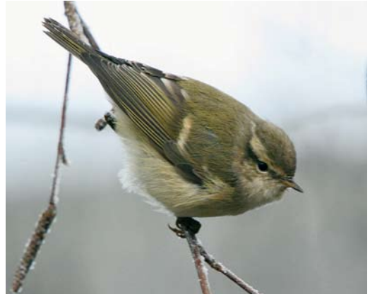
78 Humes Bladkoning / Hume's Leaf Warbler Phylloscopus humei , Gendringen, Gelderland, 21 december 2007 (Lex Aalders)