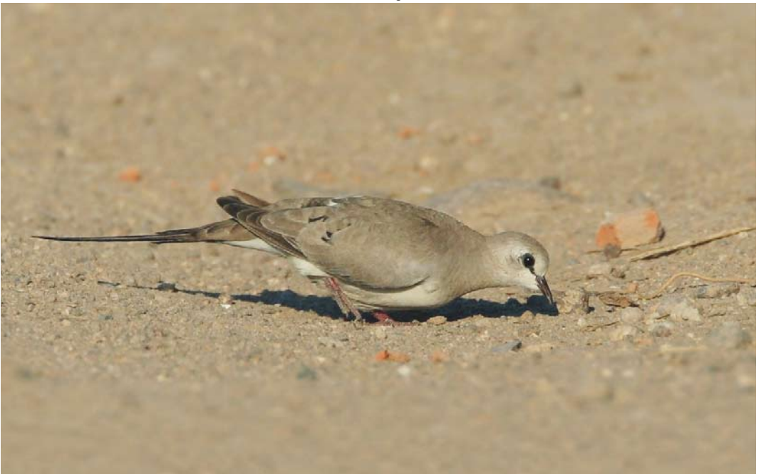
314 Namaqua Dove / Maskerduif Oena capensis , female, Skala Kallonis, Lesvos, Greece, 20 June 2008