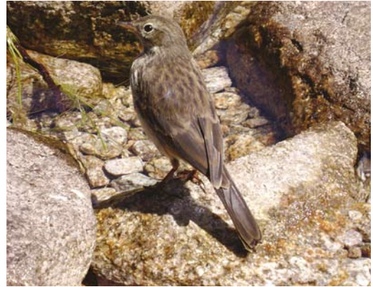
305 Water Pipit / Waterpieper Anthus spinoletta , Lac de Melo, Haute-Corse, Corsica, France, 25 July 2007 (Dick Groenendijk)

VI This mystery bird is foraging on the ground and only its upperside is visible. It is clearly a passerine but it looks rather featureless and difficult to identify. It shows long and rather narrow tertials that almost entirely cover the primaries. The absence of a primary projection in combination with long and rather narrow tertials points to a pipit Anthus . This assumption is confirmed by the rather slender body, long tail, streaked upperparts and, just visible, white-edged outer tail-feathers. Most entrants indeed recognised it as a pipit, although a few opted for White-winged Snowfinch Montifringilla nivalis . However, the latter shows, for instance, an obvious primary projection and much shorter tertials.