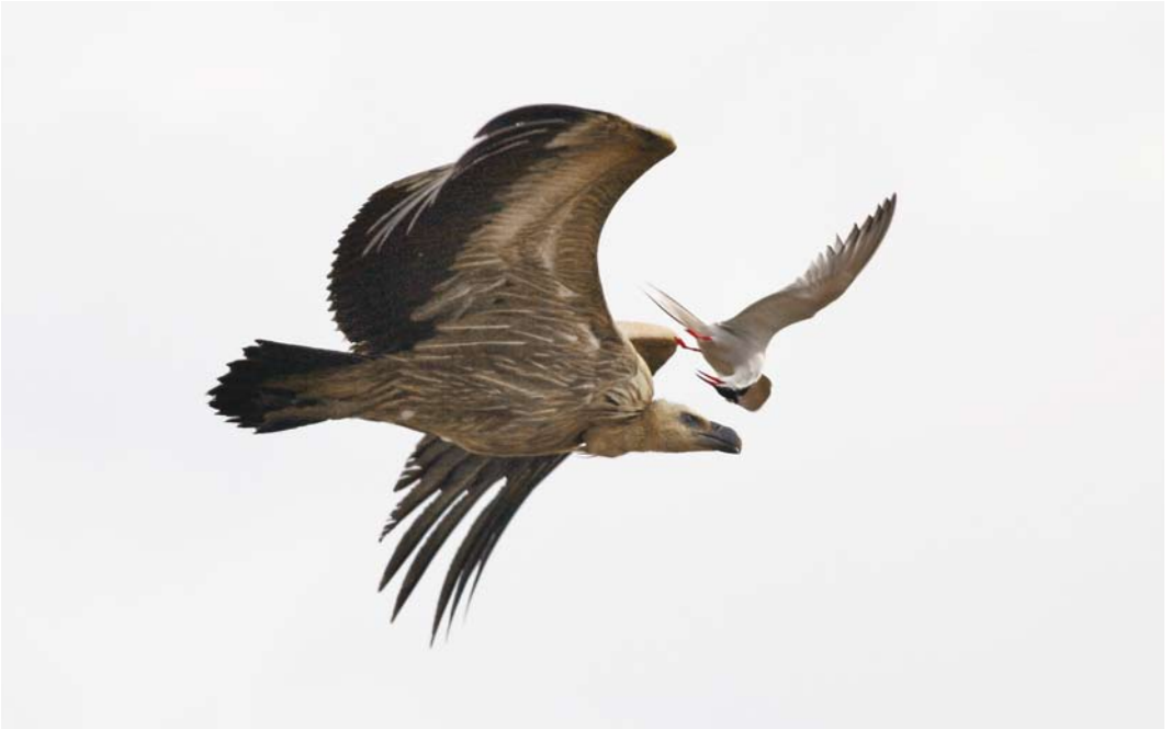
311 Griffon Vulture Vale Gier Gyps fulvus , with Common Tern / Visdief Sterna hirundo , Neuwerk, Hamburg, Schleswig-Holstein, Germany, June 2008