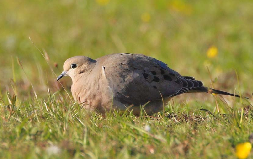
313 Mourning Dove / Treurduif Zenaida macroura , Skagen, Nordjylland, Denmark, 19 May 2008 (Ole Krogh)