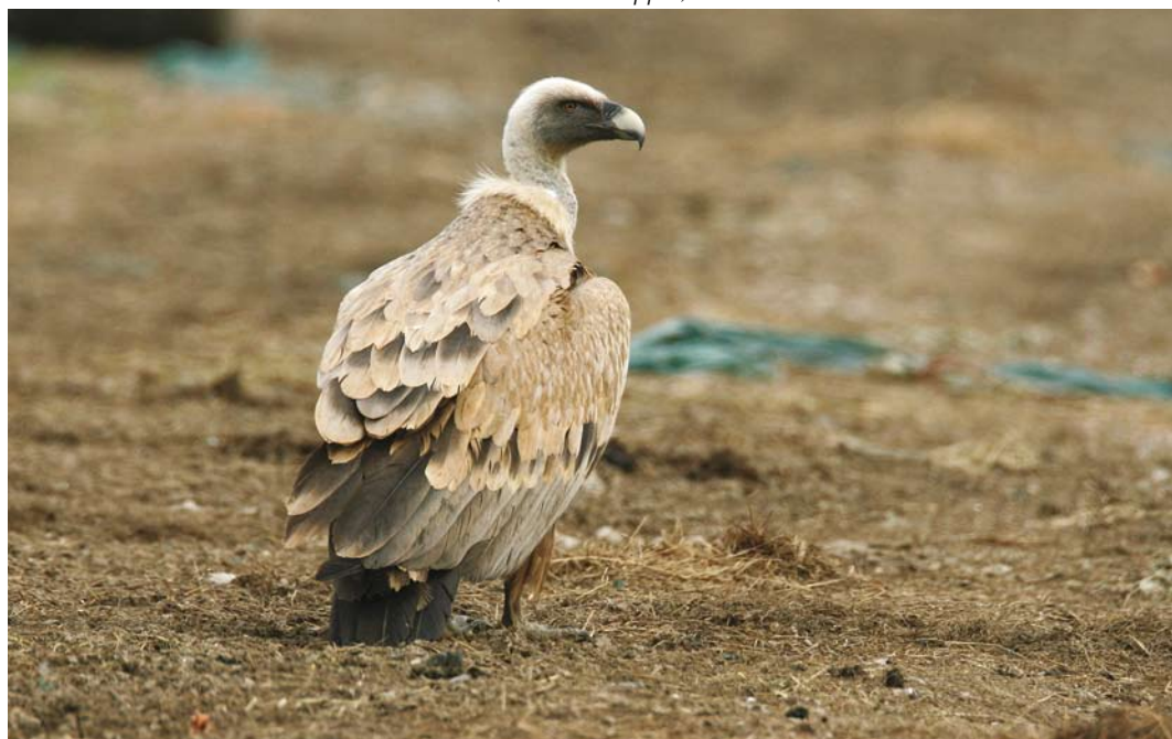
330 Vale Gier / Griffon Vulture Gyps fulvus , Kats, Zeeland, 29 mei 2008 (Niels de Schipper)