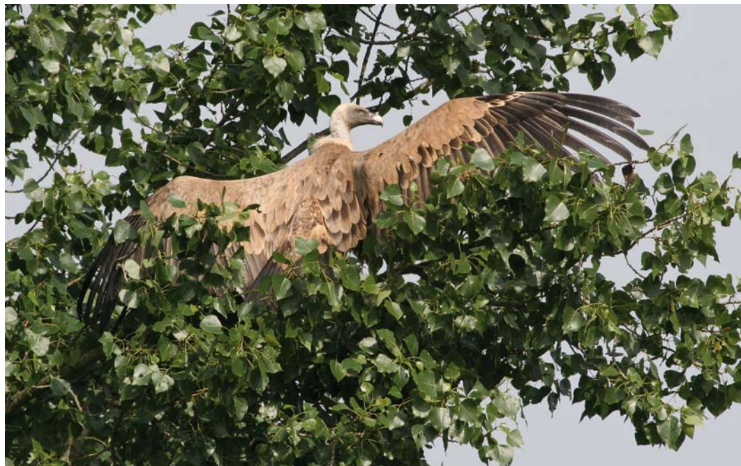
329 Vale Gier / Griffon Vulture Gyps fulvus , Biggekerke, Zeeland, 4 juni 2008