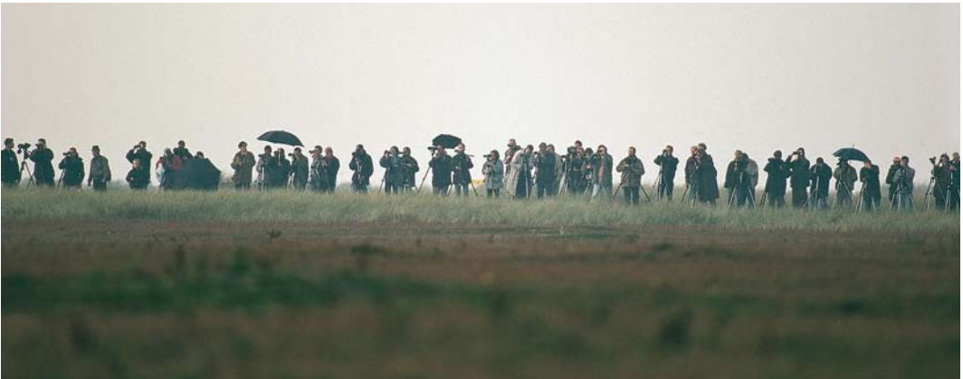
294 Izabeltapuit / Isabelline Wheatear Oenanthe isabellina , Maasvlakte, Zuid-Holland, 23 oktober 1996 (René Pop) 295 Struikrietzanger / Blyth's Reed Warbler Acrocephalus dumetorum , Walem, Limburg, 23 juni 1996 (Arnoud B van den Berg) 296 Vogelaars bij Mongoolse Pieper / birders at Blyth's Pipit Anthus godlewskii , Maasvlakte, Zuid-Holland, oktober 1996 (Hans Gebuis)

raam vloog in Hoogerheide, Noord-Brabant, ging aan de neus van twitchend Nederland voorbij, evenals de Sperweruil Sunia ulula die op 2 april door Hans van de Laar in Brunssum, Limburg, werd gefotografeerd en daarna nooit meer teruggezien. Daarna kwam het jaar los: Alain Kind (her)ontdekte op 20 april een Grote Geelpootruiter in De Braakman, Zeeland. De vogel werd succesvol getwitcht en was met regelmaat tot ver in mei op deze plek zichtbaar. Tussendoor zou hij aan de Engelse oostkust zijn gezien, maar het is nooit helemaal zeker geworden of het inderdaad om dezelfde ging. Op 4 mei was het weer tijd voor een doubletje, en wat voor één – een Daurische dubbelslag! Bij Katwijk, Zuid-Holland, werd op het Wantveld door Arnold Meijer in de middag de derde Daurische Kauw C dauricus voor de WP ontdekt terwijl op de noordpunt van Texel een reeds 's ochtends door een groepje jeugdbonders gevonden 'izabelklauwier' (later gedetermineerd als Daurische Klauwier I isabellinus ) spontaan werd heront-