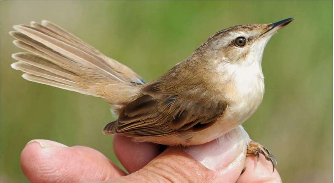
349 Veldrietzanger / Paddyfield Warbler Acrocephalus agricola , Zwanenwater, Noord-Holland, 4 juni 2008 (Eric Menkveld)