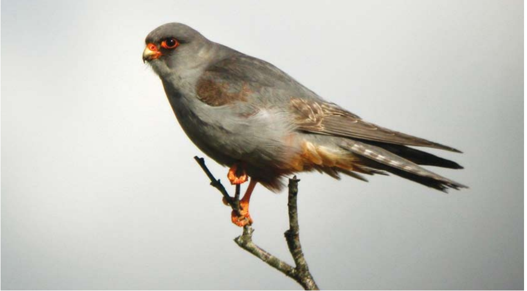
268 Roodpootvalk / Red-footed Falcon Falco vespertinus , tweede-kalenderjaar mannetje, Fochteloërveen, Friesland, 18 mei 2008. Klee op hoofdlijnen als adult, maar gebandeerde staartpenne en bruine vleugeldekveren kenmerkend voor tweede-kalenderjaarvogel / Plumage mainly as adult but barred rectrices and brown wing-coverts indicate second calendar-year. 269 Roodpootvalk / Red-footed Falcon Falco vespertinus , tweede-kalenderjaar mannetje, Fochteloërveen, Friesland, 13 mei 2008. Karakteristieke tweedejaars vogel met onregelmatige koptekening en roestrode tekening op borst. Gebandeerde juveniele staartpenne zichtbaar / Characteristic second calendar-year with irregular head pattern and rusty markings on breast. Barred juvenile rectrices visible. 270 Roodpootvalk / Red-footed Falcon Falco vespertinus , tweede-kalenderjaar mannetje, Fochteloërveen, Friesland, 15 mei 2008. Nieuwe binnenste en buitenste staartpenne goed zichtbaar, contrasterend met niet geruide juveniele staartpenne / Second calendar-year male. New inner and outer rectrices visible, clearly contrasting with unmoulted barred juvenile rectrices.