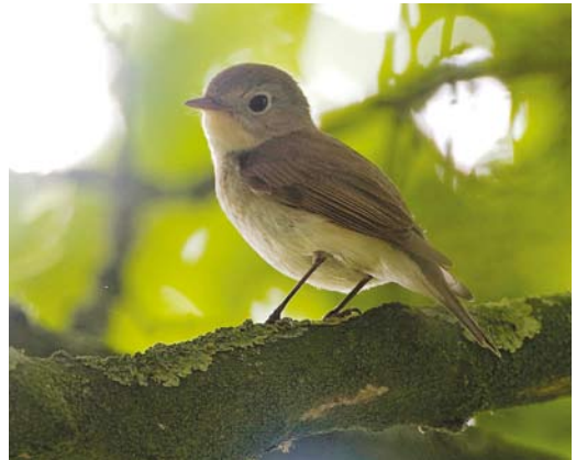
341 Kleine Klapekster / Lesser Grey Shrike Lanius minor , adult, Grote Vlak, Texel, Noord-Holland, 8 juni 2008 ( Arend Wassink ) 342 Steppiekiekendief / Pallid Harrier Circus macrourus , adult vrouwtje, Breskens, Zeeland, 22 april 2008 ( Thomas Luiten ) cf Dutch Birding 30: 204, 2008 343 Blonde Ruiters / Buff-breasted Sandpiper Tryngites subruficollis , Waal en Burg, Texel, Noord-Holland, 11 juni 2008 ( Arend Wassink ) 344 Kleine Vliegenvanger / Red-breasted Flycatcher Ficedula parva , onvolwassen mannetje, Nijmegen, Gelderland, 3 juni 2008 ( Toy Janssen )

doodgevonden. Het vrouwtje riep nog een aantal weken door. Een paar elders in Gelderland bracht drie jongen groot. Een Oeraluil Strix uralensis werd op 23 mei gefotografeerd in de omgeving van Boxmeer. Het exemplaar dat zich in april 2005 in Enkhuizen ophield, kon dankzij een pootring worden ontmaskerd als een 'escape'. Of de vogel van Boxmeer was voorzien van een ring kon niet met zekerheid worden bepaald. Het valt mede daarom te bezien of de Nederlandse lijst met deze waarneming weer een soort rijker is. Overvliegende Alpengierzwaluwen Apus melba werden gemeld op 4 mei boven Sliedrecht, Zuid-Holland; op 24 en 26 mei in de Eemshaven; op 29 juni boven Haarlem, Noord-Holland; en op 30 juni boven Weurt. Bij Breskens werden overvliegende Bijeneters Merops apiaster gemeld op 4, 5 (zeven) en 7 mei. Het voorjaars totaal van negen betekende een record voor de telpost. Andere trekkers werden gezien op 9 mei bij de Vulkaan bij Den Haag; op