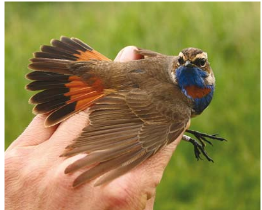
345 Rode Rotslijster / Rufous-tailed Rock Thrush Monticola saxatilis , mannetje, Drouwenezand, Drenthe, 10 mei 2008 ( Adri Groenendal ) 346 Roodsterblauwborst / Red-spotted Bluethroat Luscinia svecica svecica , mannetje, De Cocksdorp, Texel, Noord-Holland, 18 mei 2008 ( Eric Menkveld ) 347 Roodsterblauwborst / Red-spotted Bluethroat Luscinia svecica svecica , mannetje, Maasvlakte, Zuid-Holland, 18 mei 2008 ( Enno B Ebels ) 348 Roodsterblauwborst / Red-spotted Bluethroat Luscinia svecica svecica , mannetje, Oostvaardersdijk, Almere, Flevoland, 1 juni 2008 ( Ton Eggenhuizen )

bij Ritthem, Zeeland. In de eerste drie weken van mei werden nog c 20 doortrekkende Draaihalzen Jynx torquilla gemeld. Op 4 mei werd 's middags een langsvliegende Kalanderleeuwerik Melanocorypha calandra opgemerkt in de Eemshaven. Op 8 mei was een exemplaar kortstondig ter plaatse in de Clethemspolder bij Groede. Na enkele minuten verdween hij in zuidoostelijke richting tot grote teleurstelling van de c 30 vogelaars die vanaf de nabijgelegen trektelpost bij Breskens de lucht nauwlettend in de gaten hielden. Samen met de waarneming op 26 april op de Loozerheide betreft dit de derde melding van dit voorjaar. Eerdere gevallen dateren van 10 oktober 1980 bij Castricum, Noord-Holland (vangst), 16 mei 1988 op Texel en 27 mei 2005 in de Eemshaven. Overvliegende Kortteenleeuweriken Calandrella brachydactyla werden gemeld op 4 en 10 mei in de Eemshaven, op 5 mei bij Breskens en op 11 mei in het