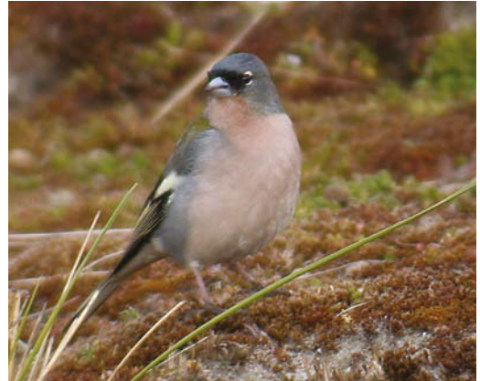
250-251 Atlasvink / Atlas Chaffinch Fringilla coelebs africana , mannetje, Maasvlakte, Zuid-Holland, 5 april 2003

merken die bij de (niet uitvoerig bekeken en niet gefotografeerde) vogel van de Eemshaven werden waargenomen, zoals de groene mantel, weinig contrastrijke kop-tekening en lichte grijze onderdelen, duiden ook op 'Afrikaanse Vink'. Het overwegend bruingrijze verenkleed wijst op een vrouwtje. De mantelkleur van een vrouwtje is grijs met een groene tint (een kenmerk wat in de literatuur vaak alleen voor mannetjes wordt genoemd); bestudering van foto's uit het broedgebied door AvdB en MJ gaf aan dat deze groene tint bij sommige vrouwtjes vrij uitgesproken kan zijn (cf plaat 252). De vogel is aanvaard als vrouwtje (cf van der Vliet et al 2007, Nils van Duivendijk in litt).