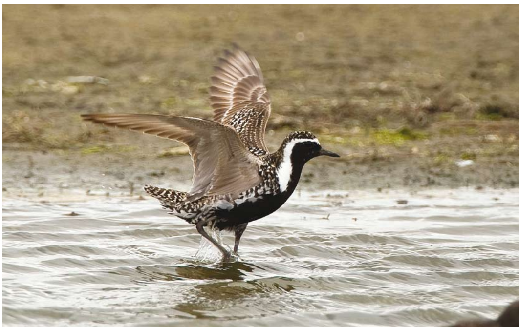
334 Aziatische Goudplevier / Pacific Golden Plover Pluvialis fulva , Ezumakeeg, Friesland, 29 juni 2008 (Toy Janssen)