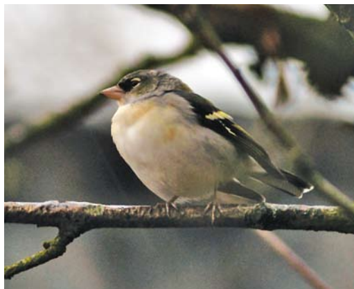
253-254 (Vermoedelijke) afwijkende Vink / (presumed) aberrant Common Chaffinch Fringilla coelebs (met kenmerken van 'Afrikaanse Vink' / showing characters of 'African Chaffinch' F c africana/spodiogenys ), Haren, Groningen, 11 december 2003