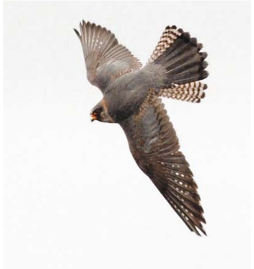
271 Roodpootvalk / Red-footed Falcon Falco vespertinus , tweede-kalenderjaar mannetje, Fochteloërveen, Friesland, 17 mei 2008 (Roef Mulder). Exemplaar met uitzonderlijk veel roestrode tekening op onderdelen. Enkele ondervleugeldekveren geruid / Second calendar-year male with exceptionally extensive rusty coloration on underparts. Some underwing-coverts moulted. 272 Roodpootvalk / Red-footed Falcon Falco vespertinus , tweede-kalenderjaar mannetje, Fochteloërveen, Friesland, 17 mei 2008 (Roef Mulder). Nog niet geruide juveniele buitenste staartpennen duidelijk zichtbaar. Geruide adult-type staartpennen hebben donkere subterminale band die bij adulte vogels ontbreekt / Second calendar-year male. Unmoulted juvenile rectrices clearly visible. Moulded adult type rectrices have dark subterminal bar, lacking in adults. 273 Roodpootvalk / Red-footed Falcon Falco vespertinus , tweede-kalenderjaar mannetje, Fochteloërveen, Friesland, 17 mei 2008 (Roef Mulder). Zelfde vogel als plaat 272 / Second calendar-year male, same bird as in plate 272. 274 Roodpootvalken / Red-footed Falcons Falco vespertinus , tweede-kalenderjaar vrouwtjes, Fochteloërveen, Friesland, 18 mei 2008 (Rik Winters). 'Juveniel-type'. Bovendelen met menging van bruine juveniele veren en grijze nieuwe veren. Tekening van kop en onderdelen sterk herinnerend aan juveniel / 'Juvenile type' second calendar-year female. Upperparts with mixture of brown juvenile and grey new feathers. Pattern of head and underparts strongly reminiscent of juvenile.