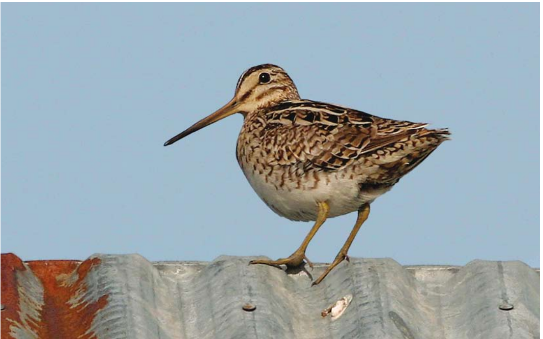
312 Swinhoe's Snipe / Siberische Snip Gallinago megala , Värtsilä, Tohmajärvi, Finland, 16 June 2008 (Petri Salo)