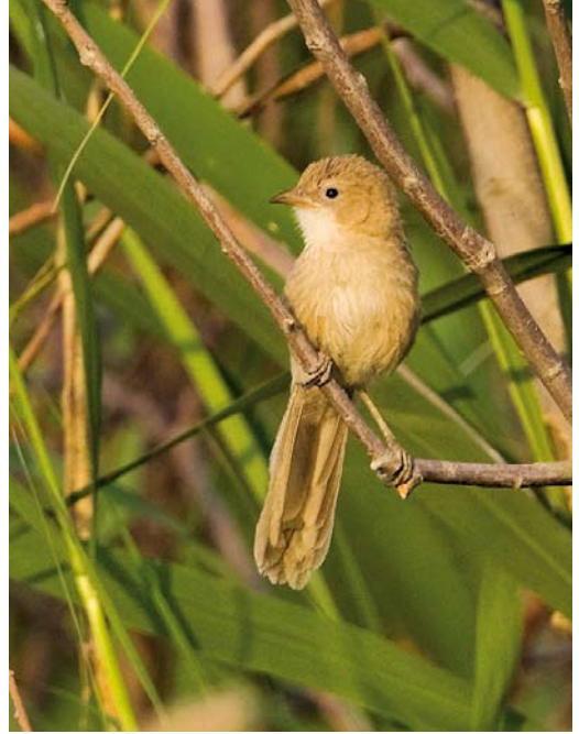
323 Citril Finch / Citroenkanarie Serinus citrinella , adult male, Fair Isle, Shetland, Scotland, 7 June 2008 324 Iraq Babbler / Iraakse Babbelaar Turdoides altirostris , Birecik, Turkey, 8 May 2008 325 Rustic Bunting / Bosgors Emberiza rustica , Helgoland, Schleswig-Holstein, Germany, 8 June 2008