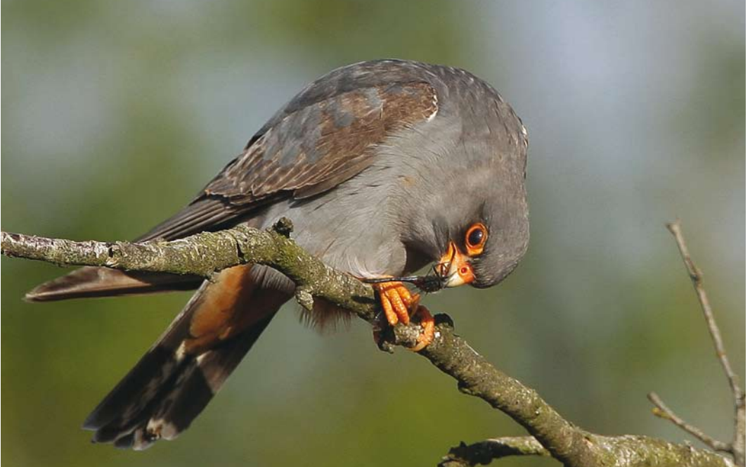
275 Roodpootvalk / Red-footed Falcon Falco vespertinus , tweede-kalenderjaar mannetje met witsnuitlibel / whiteface Leucorrhinia , Fochteloërveen, Friesland, 18 mei 2008 ( Toy Janssen ) 276 Roodpootvalk / Red-footed Falcon Falco vespertinus , adult mannetje, Fochteloërveen, Friesland, 21 mei 2008 ( Roland Jansen ). Ontbreken van juveniele kenmerken en zilvergrijze bovenzijde van handpennen duiden op adult. Van dichtbij zijn ook bij adulte mannetjes fijne donkere schachtstrepen zichtbaar op borst en flank / Lack of any juvenile characters and silvery-grey upperside of primaries indicate adult male. In close view, also adult males show fine dark shaft-streaks on breast and flank.