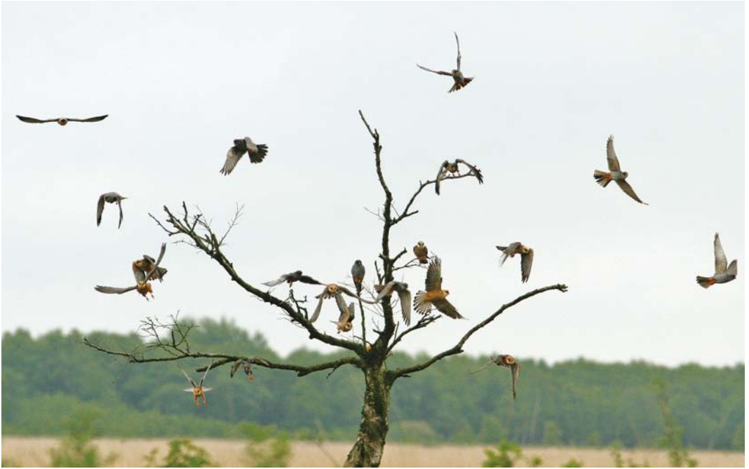
265 Roodpootvalken / Red-footed Falcons Falco vespertinus , Fochteloërveen, Friesland, 17 mei 2008 266 Roodpootvalken / Red-footed Falcons Falco vespertinus , Fochteloërveen, Friesland, 17 mei 2008 267 Roodpootvalk / Red-footed Falcon Falco vespertinus , tweede-kalenderjaar mannetje, Fochteloërveen, Friesland, 15 mei 2008