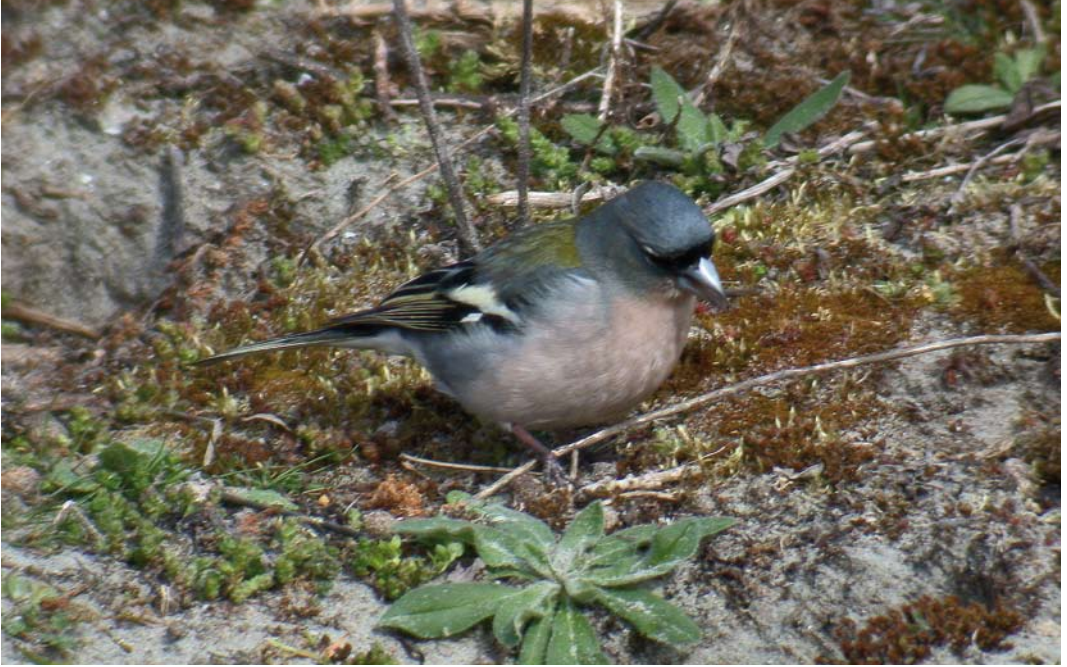
248-249 Atlasvink / Atlas Chaffinch Fringilla coelebs africana , mannetje, Maasvlakte, Zuid-Holland, 5 april 2003