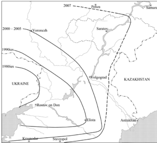
FIGURE 1 Range expansion of Syrian Woodpecker Dendrocopos syriacus in eastern Ukraine and European Russia in 1980-2007