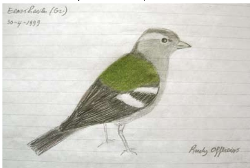
FIGUUR 1 Atlasvink / Atlas Chaffinch Fringilla coelebs africana , vrouwtje, Eemshaven, Groningen, 30 april 1999 (Rudy Offereins)

NAAKTE DELEN Poot vleeskleurig, snavel egaal hoornkleurig. GELUID Roep (zowel in vlucht als in zit) opvallend anders dan