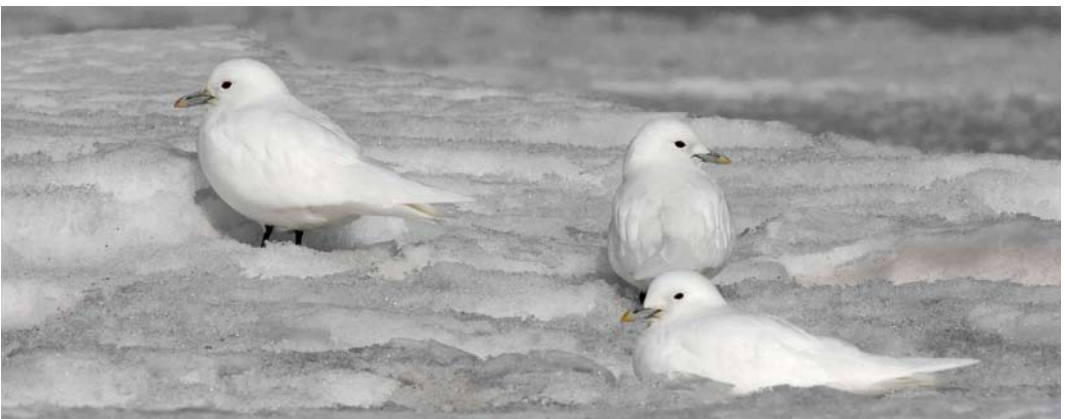
315 Hudsonian Godwit / Rode Grutto Limosa haemastica , male, with Black-tailed Godwit / Grutto L. limosa , Vannbassenget, Røst, Nordland, Norway, 24 June 2008 ( Tomas Aarvak ) 316 Forster's Tern / Forsters Stern Sterna forsteri , adult, Tacumshin, Wexford, Ireland, 2 June 2008 ( Killian Mullarney ) 317 Black-browed Albatross / Wenkbrauwalbatros Thalassarche melanophris , Atlantic Ocean, 140 km west of Kilkee, Clare, Ireland, 4 June 2008 ( Ramón López Junca ) 318 Steller's Eider / Stellers Eider Polysticta stelleri , Blikalón, Melrakkaslétta, Iceland, 12 July 2008 ( James Lidster ) 319 Ivory Gulls / Ivoormeewuven Pagophila eburnea , adult, Longyearbyen, Svalbard, 23 May 2008 ( Edwin Winkel )