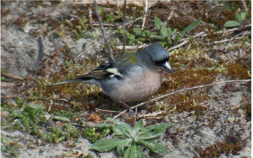
248-249 Atlasvink / Atlas Chaffinch Fringilla coelebs africana , mannetje, Maasvlakte, Zuid-Holland, 5 april 2003