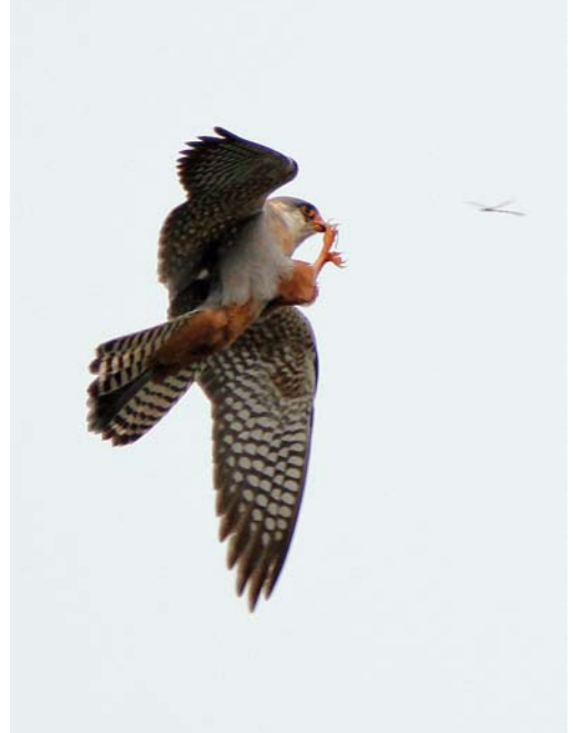
350 Vorkstaartplevier / Collared Pratincole Glaucopis trichoptera , Oostende, West-Vlaanderen, 23 juni 2008 (Koen Verbanck) 351 Roodpootvalk / Red-footed Falcon Falco vespertinus , tweede-kalenderjaar mannetje, Kalmthout, Antwerpen, 26 mei 2008 (Johan Buckens) 352 Breedbekstrandloper / Broad-billed Sandpiper Limicola falcinellus , Bichterweerd, Limburg, 12 mei 2008 (Ran Schols)