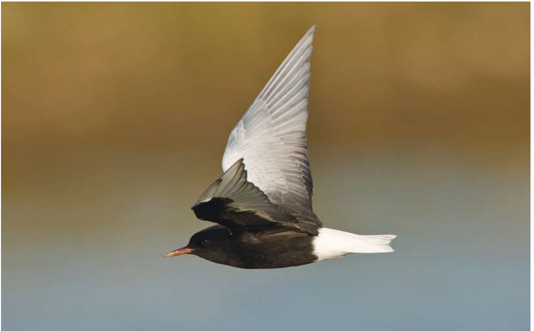
354 Witvleugelstern / White-winged Tern Chlidonias leucopterus , Bichterweerd, Limburg, 11 mei 2008 (Ran Schols)