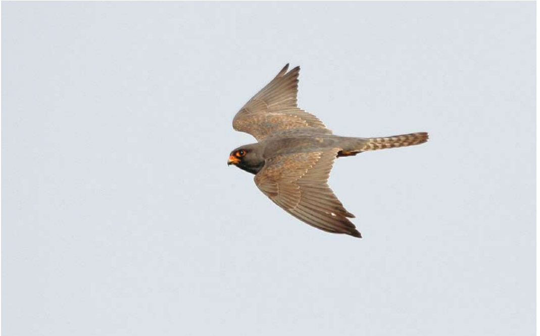
353 Roodpootvalk / Red-footed Falcon Falco vespertinus , tweede-kalenderjaar mannetje, Kalmthout, Antwerpen, 26 mei 2008