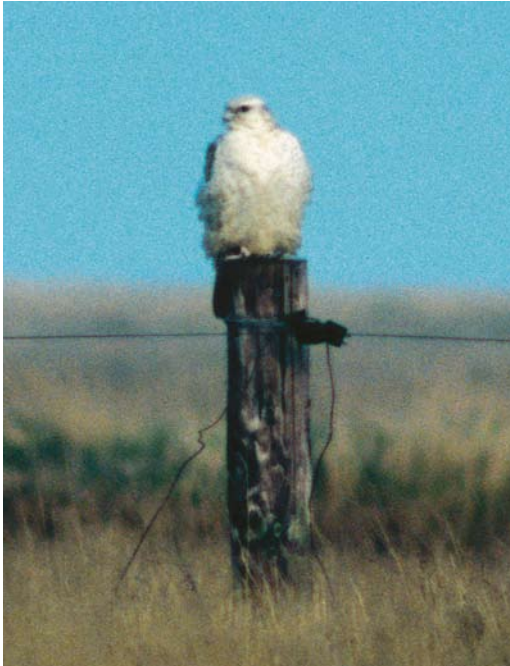
303 Giervalk / Gyrfalcon Falco rusticolus , Kobbe- duinen, Schiermonnikoog, Friesland, 27 maart 1998

Op 5 december vloog een aanvaardbare Grote Pijlstormvogel langs Camperduin. Het jaar eindigde met een twitchbare Hutchins' Canadese Gans op de Korendijkse Slikken, Zuid-Holland.