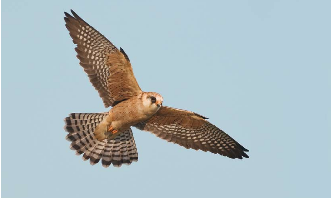
277 Roodpootvalk / Red-footed Falcon Falco vespertinus , adult vrouwtje, Fochteloërveen, Friesland, 15 mei 2008 ( Rein Hofman ). Sommige adulte vrouwtjes vertonen lengtestrepen op ondervleugeldekveren / Some adult females show longitudinal streaks on underwing-coverts. 278 Roodpootvalk / Red-footed Falcon Falco vespertinus , tweedekalenderjaar vrouwtje, Fochteloërveen, Friesland, 13 mei 2008 ( Roef Mulder ). Alle ondervleugeldekveren juveniel met bruine bandering / Second calendar-year female. All underwing-coverts juvenile, with brown barring. 279 Roodpootvalk / Red-footed Falcon Falco vespertinus , adult vrouwtje, Fochteloërveen, Friesland, 19 mei 2008 ( Rein Hofman ). Bruingrijze slagpennen en contrastrijk gebandeerde tertials en bovendelen wijzen op adulte vogel / Adult female. Brown-grey remiges and contrastingly banded tertials and upperparts indicative of adult female.