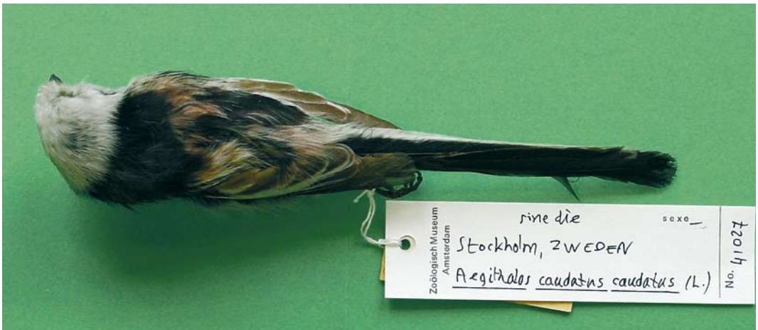
358 White-headed Long-tailed Bushtit / Witkopstaartmees Aegithalos caudatus caudatus , female (collected at Leiden, Zuid-Holland, Netherlands, on 1 November 1859; RMNH 130.852), Nationaal Natuurhistorisch Museum/Naturalis, Leiden, 27 January 2006. Note that this specimen was labelled as europaeus . However, it shows all characters of caudatus , the dark smudges on the head being dirt. 359 White-headed Long-tailed Bushtit / Witkopstaartmees Aegithalos caudatus caudatus (collected at Stockholm, Sweden, without date; ZMA 41027), Zoologisch Museum Amsterdam, Amsterdam, Noord-Holland, Netherlands, 6 March 2003. Note dark tertials with very limited pale fringes, indicating variability of this character in this taxon.

Only adult-type birds were taken into account, ie, adult birds and first-year birds that, from September onwards, had finished their (complete) post-juvenile moult (cf Svensson 1992). Identification in non-adult plumage, if possible at all, is beyond the scope of this paper. Excluded from the research were partially white birds (like, for instance, a bird observed in the autumn of 2003 at Stiffkey, Norfolk, England, with a white head, white tail and other anomalous white patches; Richard Millington in litt).