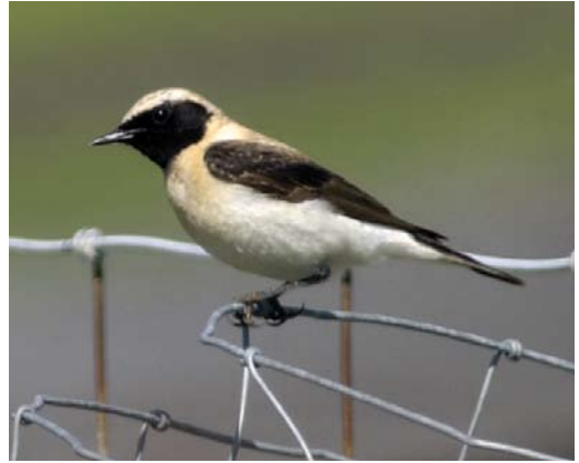
400 Oostelijke Blonde Tapuit / Eastern Black-eared Wheatear Oenanthe melanoleuca , eerste-zomer mannetje, Texel, Noord-Holland, 4 mei 2003