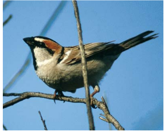
385-386 Saxaul Sparrow / Saxaulmus Passer ammodendri, male, near Sarakhs, Khorassan, Iran, 27 April 2004