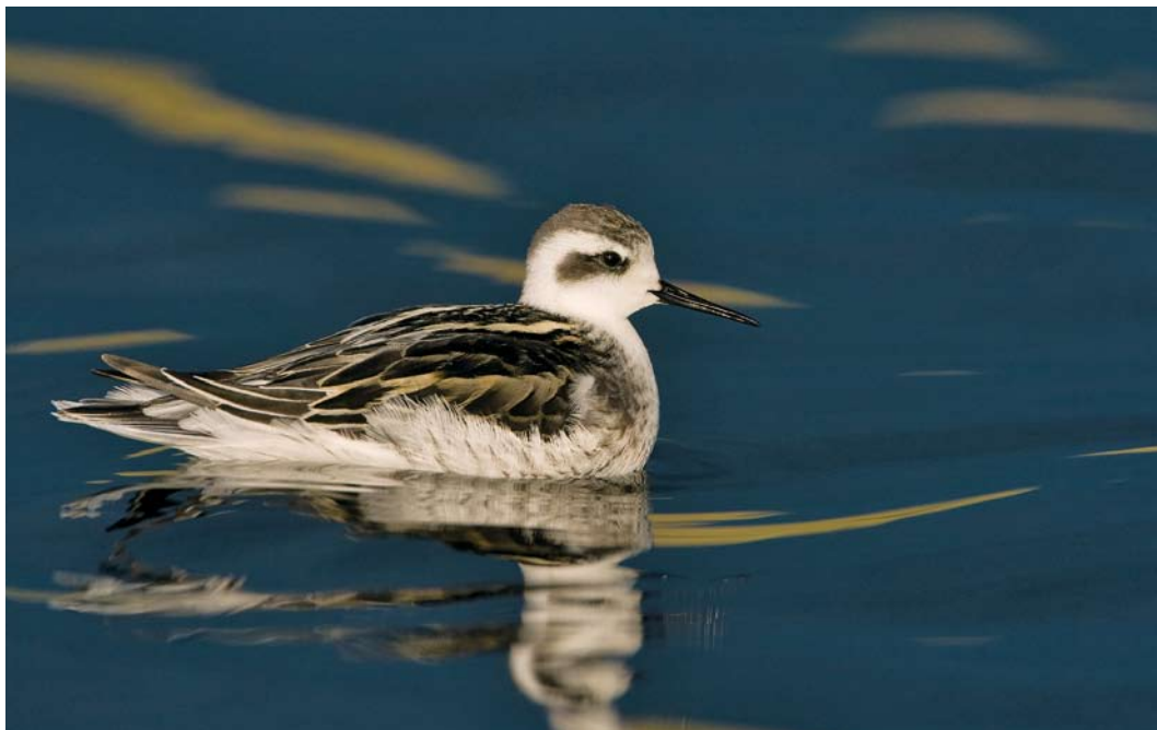
434 Grauwe Franjepoot / Red-necked Phalarope Phalaropus lobatus , juveniel, Terschelling, Friesland, 11 september 2008 (Arie Ouwerkerk)