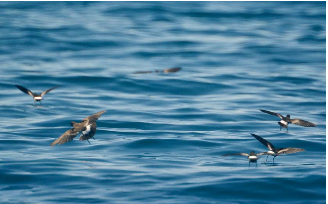
407 Wilson's Storm Petrels / Wilsons Stormvogeltjes Oceanites oceanicus , part of flock of 100, off Portimão, Portugal, 25 August 2008