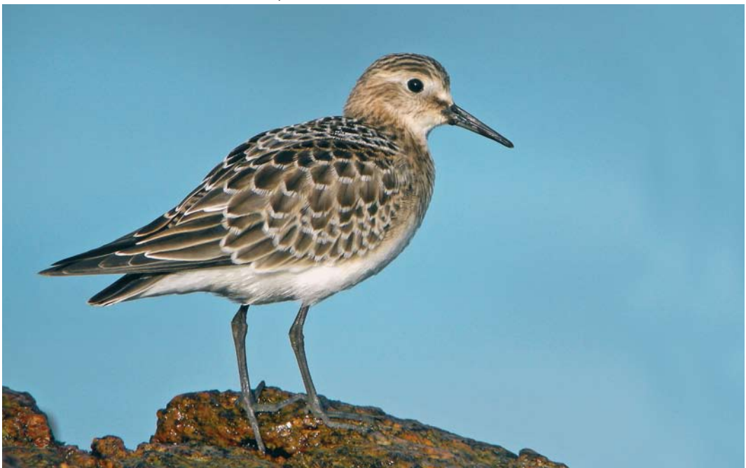
410 Baird's Sandpiper / Bairds Strandloper Calidris bairdii , juvenile, Ouessant, Finistère, France, 13 September 2008