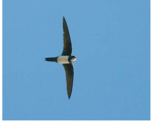
448 Alpengierzwaluw / Alpine Swift Apus melba , Zeebrugge, West-Vlaanderen, 9 mei 2008 (Johan Buckens) cf Dutch Birding 30: 288, 2008

Vorkstaartmeeuwen Xema sabini langs Oostende en één langs De Panne. Reuzensterms Hydroprogne caspia werden waargenomen te Lier-Anderstad op 24 en 30 juli; op de Kraenepoel in Aalter, Oost-Vlaanderen, op 25 juli (vier); in de Bourgoyen bij Gent (twee op 29 en één op 31 juli); op De Kuifeend in Oorderen, Antwerpen, op 5 augustus; bij Mol, Antwerpen, op 9 augustus; en in de IJzermonding in Nieuwpoort op 29 augustus. Een adulte Witwangstern Chlidonias hybrida in zomerkleed verbleef op 5 en 6 juli bij Harchies. Op 28 juli en op 31 augustus pleisterde één adulte Witvleugelstern C leucopterus in de Uiterwaarden bij Kessenich.