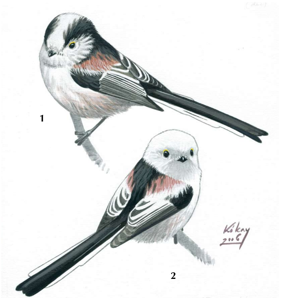
FIGURE 1 Long-tailed Bushtits / Staartmezen Aegithalos caudatus (Szabolcs Kókey). 1 europaeus , 2 caudatus . Both birds closely matching description of type specimens of both subspecies.