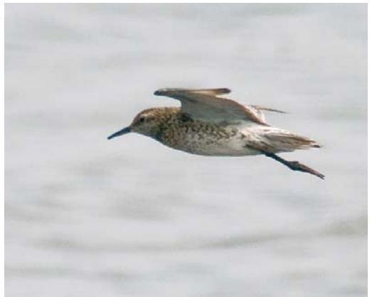
419 Black-winged Pratincole / Steppeworkstaartplevier Glaucola nordmanni , Segerstads fyr, Öland, Sweden, 25 August 2008 ( Christian Cederroth ) 420 Purple Sandpiper Calidris maritima , Longyearbyen, Svalbard, 25 May 2008 ( Edwin Winkel ) 421 Red-necked Stint / Roodkeelstrandloper Calidris ruficollis , Treguéllier, Finistère, France, 3 August 2008 ( Xavier Rozec ) 422 Western Sandpiper / Alaskastrandloper Calidris mauri , Olmex, Galway, Ireland, 13 September 2008 ( Michael Davis ) 423-424 Sharp-tailed Sandpiper / Siberische Strandloper Calidris acuminata , Segerstads fyr, Öland, Sweden, 7 August 2008 ( Christian Cederroth )