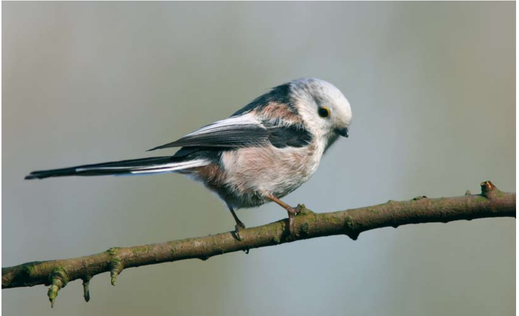
372 Central European Long-tailed Bushtit / Staartmees Aegithalos caudatus europaeus , Leiden, Zuid-Holland, Netherlands, 8 March 2007 ( Herman Berkhoudt ). Intermediate bird. Note limited dark streaking behind eye and indication of breast-band, indicating europaeus . Sharply defined black neck-band more typical for caudatus . 373 Central European Long-tailed Bushtit / Staartmees Aegithalos caudatus europaeus , adult, Melven, Veghel, Noord-Brabant, Netherlands, 14 March 2008 ( Toy Janssen ). Intermediate bird. Head looking almost pure white but still showing some darker spots; black neck-band not sharply defined.