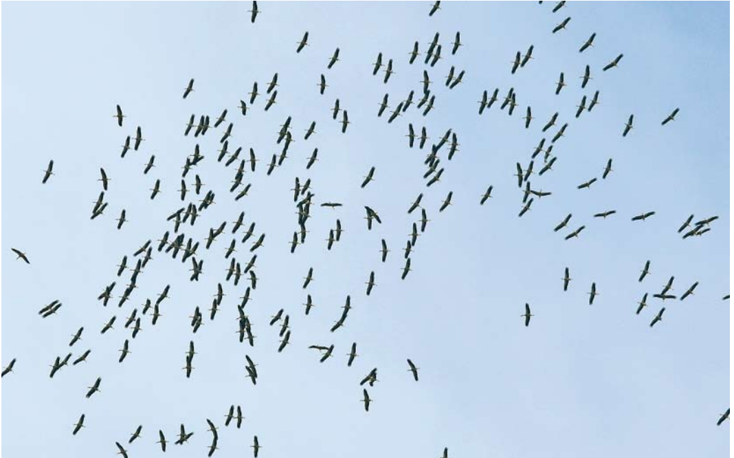
446 Ooievaars / White Storks Ciconia ciconia , Lint, Antwerpen, 16 augustus 2008 (Kris De Rouck)