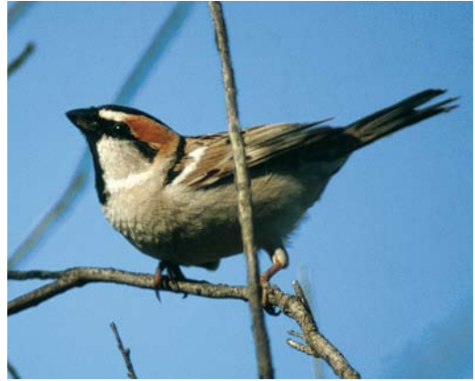
385-386 Saxaul Sparrow / Saxaulmus Passer ammodendri, male, near Sarakhs, Khorassan, Iran, 27 April 2004