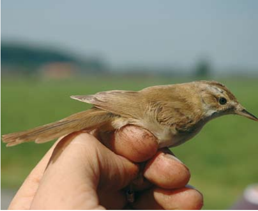
447 Velddrietzanger / Paddyfield Warbler Acrocephalus agricola , Kommer, Oost-Vlaanderen, 31 augustus 2008 (Miguel Demeulemeester)