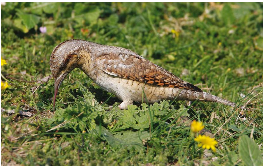
435 Draaihals / Eurasian Wryneck Jynx torquilla , Maasvlakte, Zuid-Holland, 30 augustus 2008