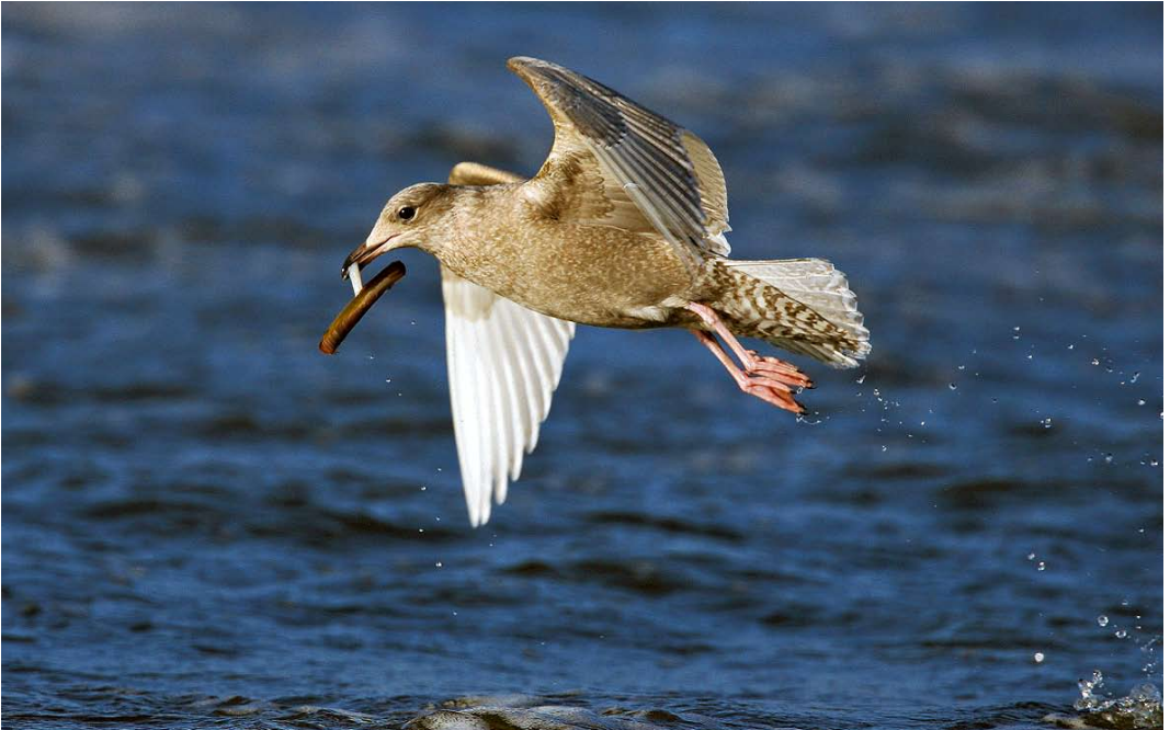
65 Kleine Burgemeester / Iceland Gull Larus glaucooides , eerstejaars, Katwijk aan Zee, Zuid-Holland, 1 december 2007