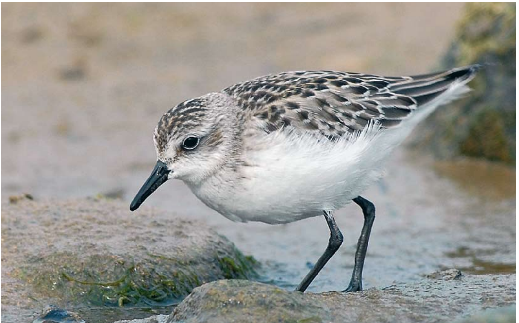
412 Semipalmated Sandpiper / Grijze Strandloper Calidris pusilla , juvenile, Playa de la Espasa, Asturias, Spain, 17 September 2008 (Daniel López Velasco)