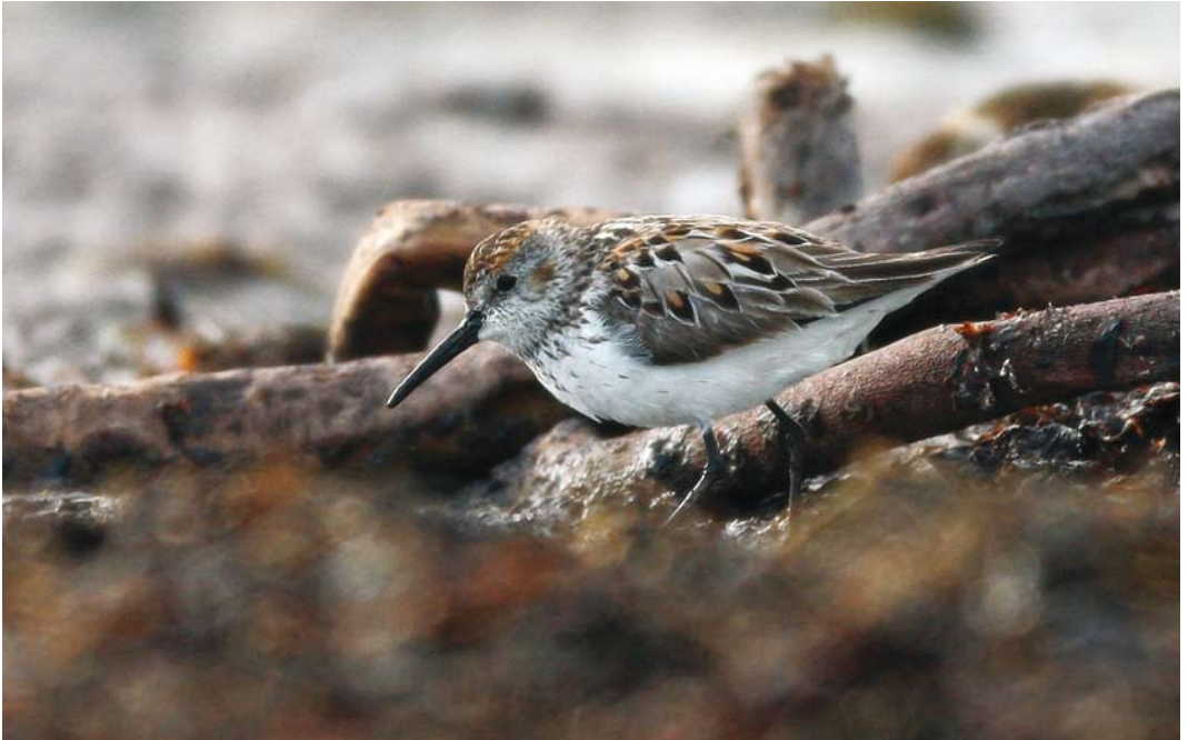
411 Western Sandpiper / Alaskastrandloper Calidris mauri , adult, Klepp, Rogaland, Norway, 13 July 2008 (Christian Tiller) cf Dutch Birding 30: 263, 2008