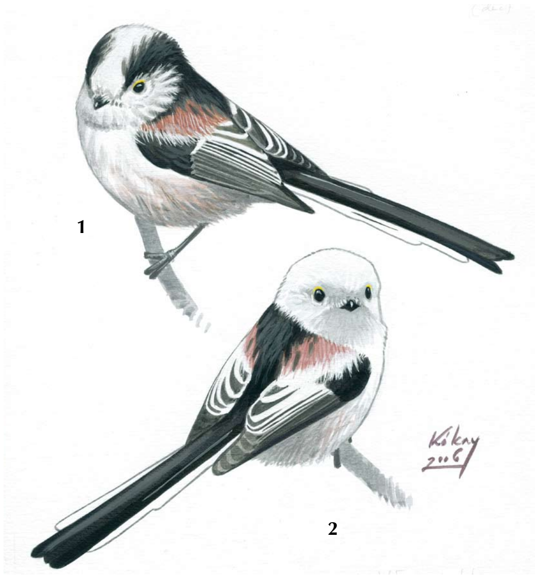
FIGURE 1 Long-tailed Bushtits / Staartmezen Aegithalos caudatus (Szabolcs Kókey). 1 europaeus , 2 caudatus . Both birds closely matching description of type specimens of both subspecies.