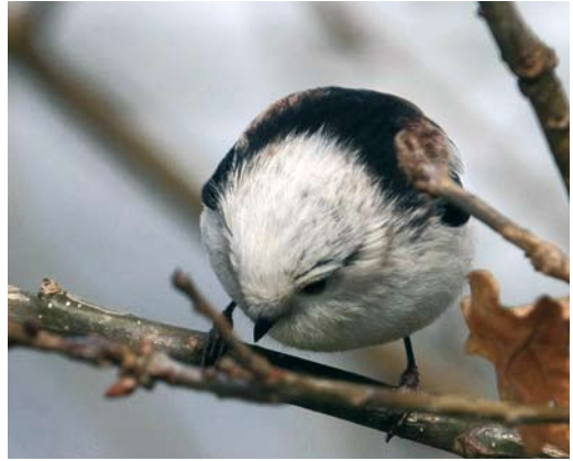
375 Central European Long-tailed Bushtit / Staartmees Aegithalos caudatus europaeus , Stuw Hankate Hellendoorn, Overijssel, Netherlands, 28 March 2008. Intermediate bird. Note brownish spot on neck-side and scattered darker spots on crown and nape.

Tynemouth, Northumberland, in November 1852, now at Hancock Museum (Witherby et al 1938, Galloway & Meek 1978); 2 up to six birds at Westleton Heath and Minsmere RSPB Reserve, Suffolk, from 25 January to 25 February 2004 (Small 2004); and 3 up to three birds at Lewes, Sussex, from 26 January to 17 February 2004 (Cooper et al 2004, Evans 2004). Photographs support the latter two records.