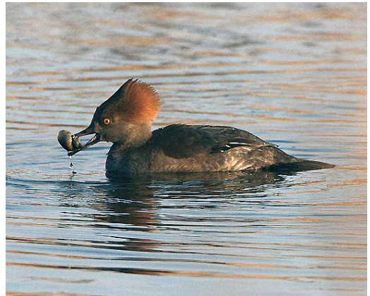
67 Middelste Jager / Pomarine Skua Stercorarius pomarinus , Katwijk, Zuid-Holland, 18 november 2007 ( Menno van Duijn ) 68 Zeearend / White-tailed Eagle Haliaeetus albicilla , Harderwijk, Gelderland, 18 november 2007 ( Roy de Haas/Agami ) 69 Ringsnaveleend / Ring-necked Duck Aythya collaris , vrouwtje, Oost-Maarland, Limburg, 23 december 2007 ( Karel Lemmens ) 70 Kokardezaagbek / Hooded Merganser Lophodytes cucullatus , Biddinghuizen, Flevoland, 14 december 2007 ( Hans Brinks )

28 november overvliegend bij Holysloot, Noord-Holland. In Groningen werden Groenlandse Kolganzen A albirostris flavirostris gemeld op 9 december bij Garrelswaer en op 15 december (mogelijk dezelfde) bij het Schildmeer. Er werden ruim 40 Roodhalsganzen Branta ruficollis gemeld en daarentegen slechts negen 'losse' Witbuikrotganzen B hrota . Zwarte Rotganzen B nigricans verbleven de gehele periode op Wieringen, Noord-Holland (maximaal drie). Daarnaast werden er nog c 10 eenzame exemplaren opgemerkt. Het maximaal aantal Krooneenden Netta rufina op de bekende plas bij het Harderbos, Flevoland, bedroeg 440 op 1 december. De Grote Tafeleend Aythya valisineria was de gehele periode present bij Castricum, Noord-Holland. Er werden niet minder dan 16 Witoog-eenden A nyroca gezien, waaronder tweetallen begin november en begin december bij Windesheim, Overijssel, en op 11 december in de Hazenputten bij Sint-Oedenrode, Noord-Brabant. Op 16 december was een vrouwtje Ring-