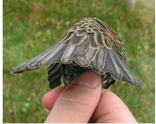
44 Mystery photograph II (November)

hardly visible. However, a rather strong carpal bar and especially a dark blackish bar on the secondaries is still visible. More important, the outermost primaries are rather black, whereas in Lesser Crested these flight-feathers are more greyish. The rather broad and relative short wings also fit Royal better than Lesser Crested.