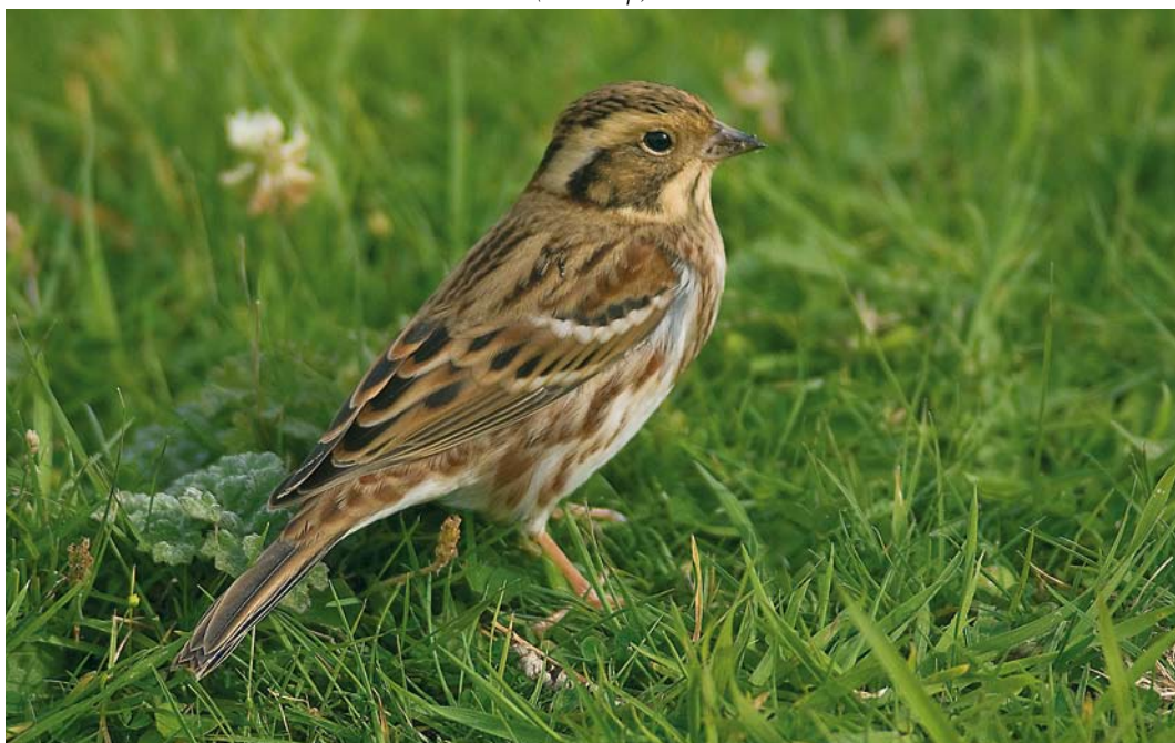
533 Bosgors / Rustic Bunting Emberiza rustica , eerstejaars, Robbenjager, Texel, Noord-Holland, 4 oktober 2008