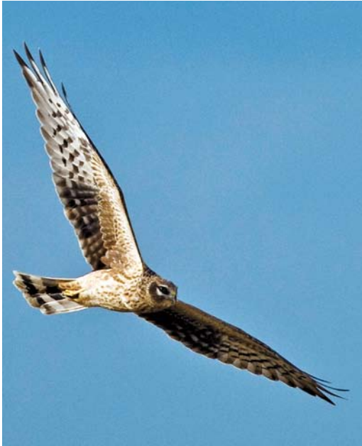
538 Steppiekiekendief / Pallid Harrier Circus macrourus , Burdinne, Liège, 3 september 2008 (Vincent Legrand)