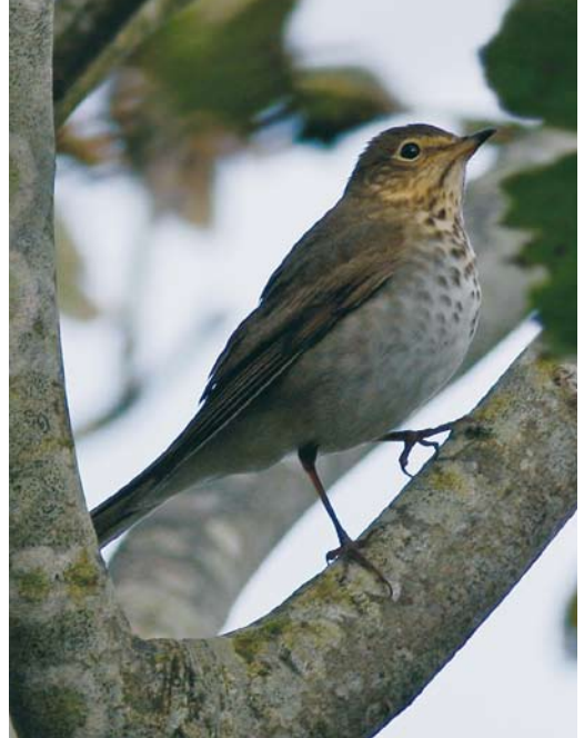
500 Asian Brown Flycatcher / Bruine Vliegenvanger Muscicapa dauurica , first-year, Fair Isle, Shetland, Scotland, 24 September 2008 ( Mark Breaks ) 501 Swainson's Thrush / Dwerglijster Catharus ustulatus , Galley Head, Cork, Ireland, 18 October 2008 ( Paul & Andrea Kelly/irishbirdimages.com ) 502 White-throated Sparrow / Witkeelgors Zonotrichia albicollis , first-year, Cape Clear, Cork, Ireland, 17 October 2008 ( Paul & Andrea Kelly/irishbirdimages.com )