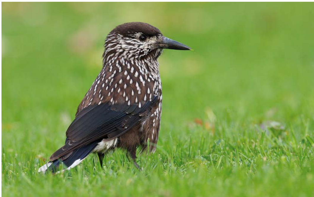
532 Notenkraker / Spotted Nutcracker Nucifraga caryocatactes , Delfzijl, Groningen, 2 november 2008 (Mark Schuurman)