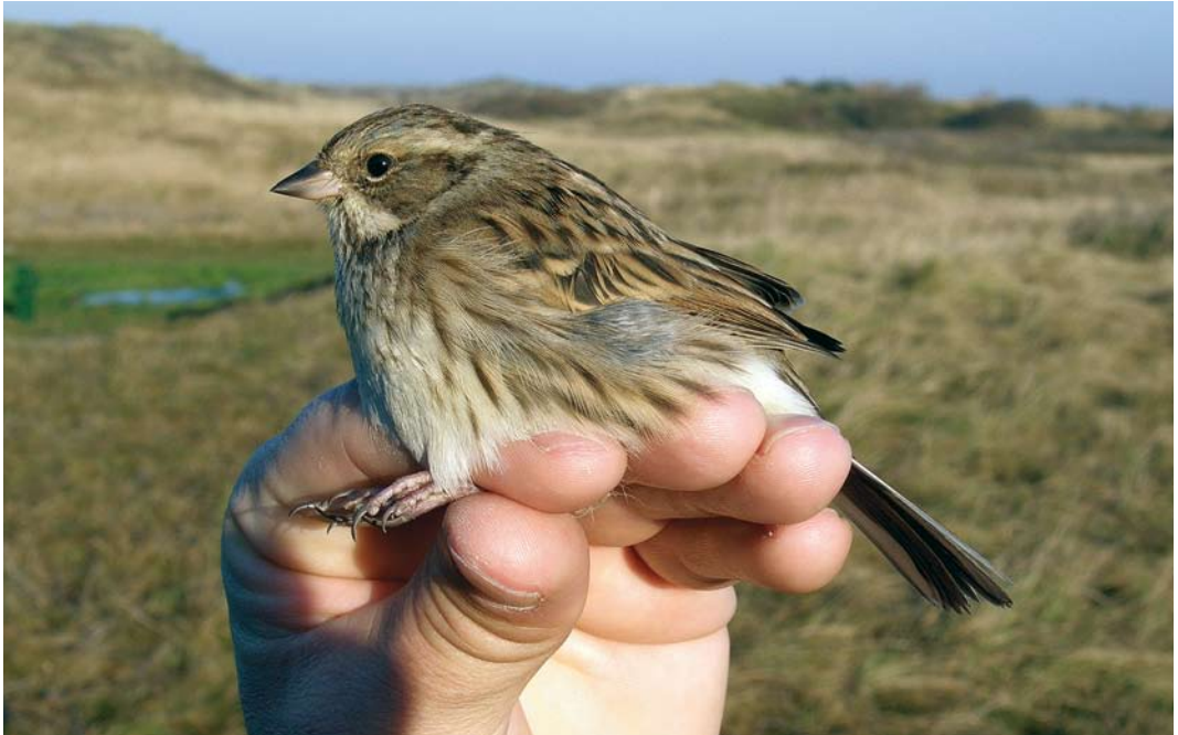
465 Black-faced Bunting / Maskergors Emberiza spodocephala , first-year female, Noordhollands Duinreservaat, Castricum, Noord-Holland, 18 November 2007 ( André J van Loon )

2008, Hargen aan Zee and Schoorl, Bergen , Noord-Holland, minimum of nine (five males and four female-types), photographed, sound-recorded, videoed (J Stok, C Oosterhuis et al; Ebels 2008; Dutch Birding 30: 55, plate 76, 61, plate 80, 62, plate 81-82, 2008).