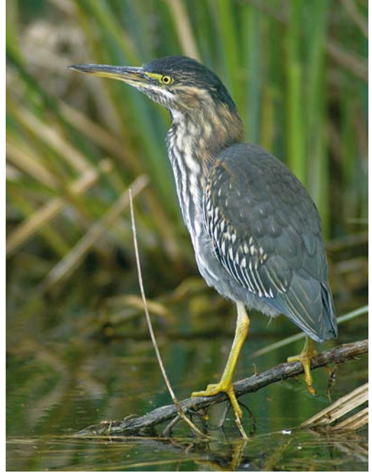
449 Green Heron / Groene Reiger Butorides virescens , third-year, Noorder IJplas, Amsterdam, Noord-Holland, 1 June 2007 450 Green Heron / Groene Reiger Butorides virescens , second calendar-year, Nieuwe Meer, Amsterdam, Noord-Holland, 28 April 2006 451 Squacco Heron / Ralreiger Ardeola ralloides , Julianadorp, Noord-Holland, 2 August 2007