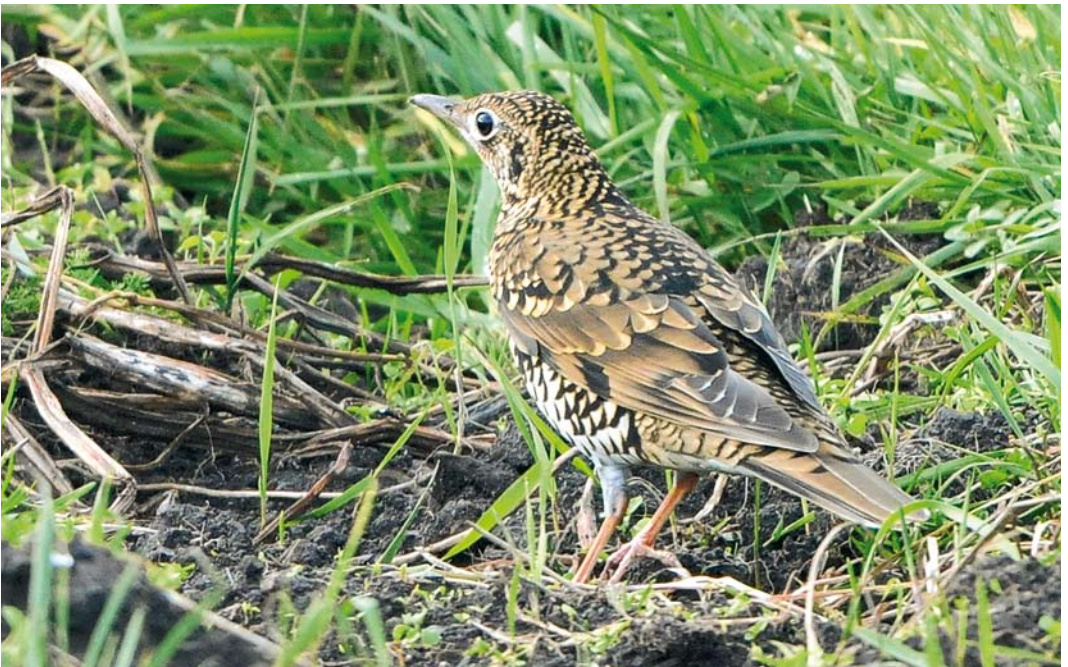
497 White's Thrush / Goudlijster Zoothera aurea , Fair Isle, Shetland, Scotland, 8 October 2008 (Rebecca Nason)