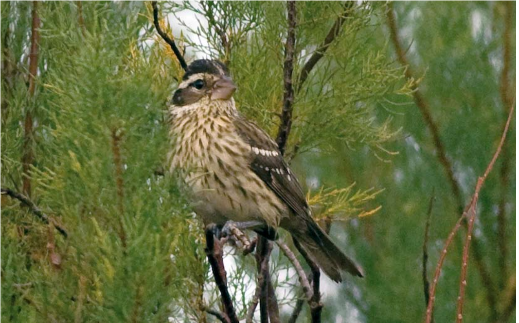
521 Rose-breasted Grosbeak / Roodborstkardinaal Pheucticus ludovicianus , Corvo, Azores, 17 October 2008 (David Monticelli)