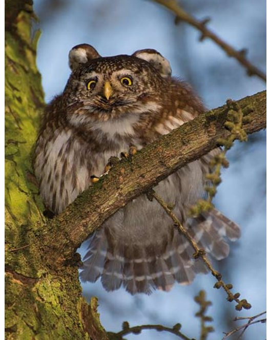
476 Dwerguil / Eurasian Pygmy Owl Glaucidium passerinum , Valkenswaard, Noord-Brabant, 11 februari 2008

De periode 2004-08 was lijsttechnisch interessant omdat er diverse soorten niet of beperkt werden gezien door de toplijsters. Absolute blockers als Grijsz Gors, Steenortolaan en Huisgierzwaluw werden alleen door vogelaars gezien die hun lijst niet bijhouden op de