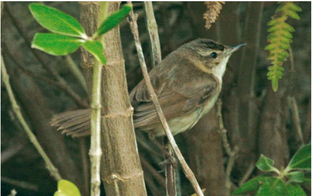
493 Paddyfield Warbler / Veldrietzanger Acrocephalus agricola , Sein, Finistère, France, 14 October 2008