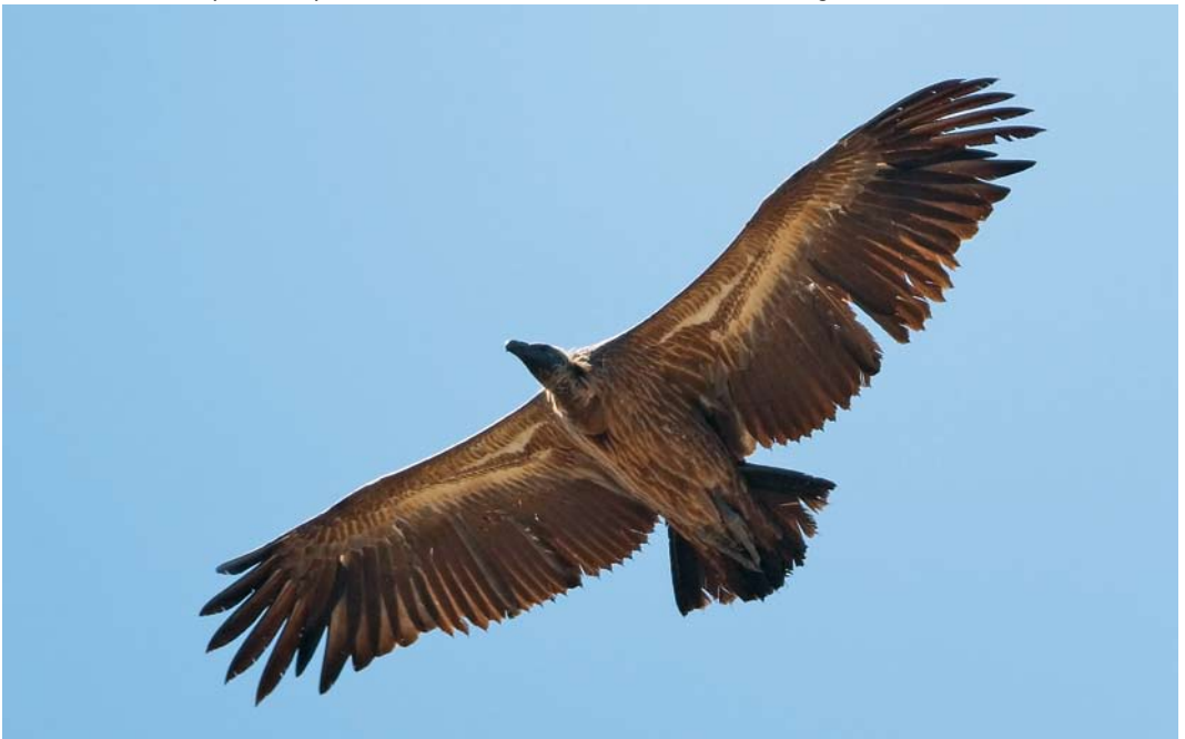
484 African White-backed Vulture / Afrikaanse Witrugulier Gyps africanus , second calendar-year, Tarifa, Cádiz, Spain, 7 September 2008 cf Dutch Birding 30: 347, 2008