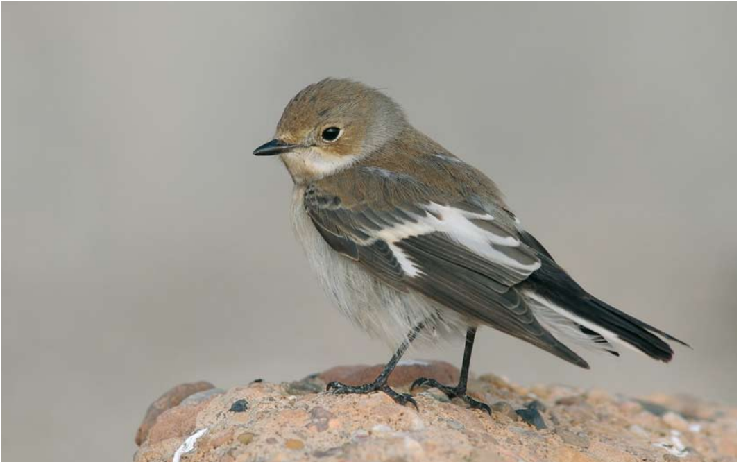
492 Collared Flycatcher / Withalsvliegenvanger Ficedula albicollis , female, Helgoland, Schleswig-Holstein, Germany, 27 September 2008