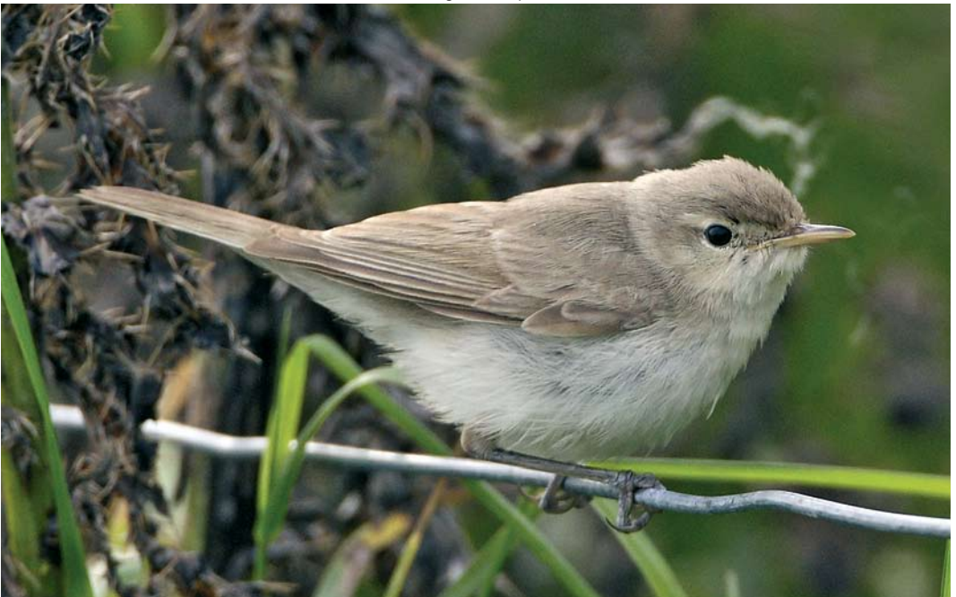
495 Sykes's Warbler / Sykes' Spotvogel Acrocephalus rama , Sumburgh, Shetland, Scotland, 25 September 2008