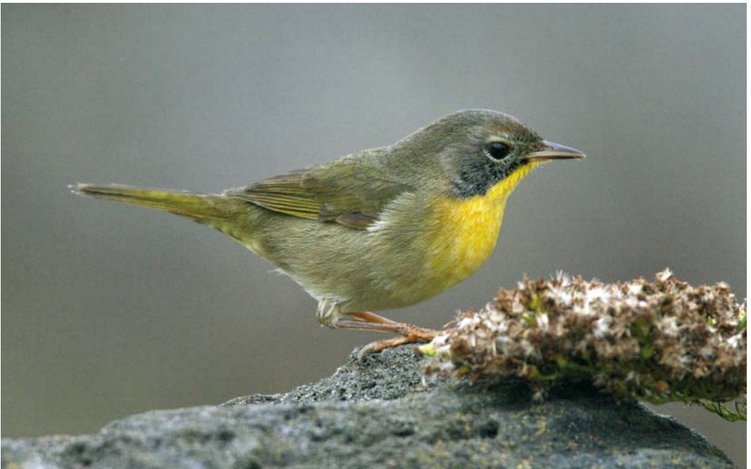
522 Common Yellowthroat / Gewone Maskerzanger Geothlypis trichas , Corvo, Azores, 30 October 2008