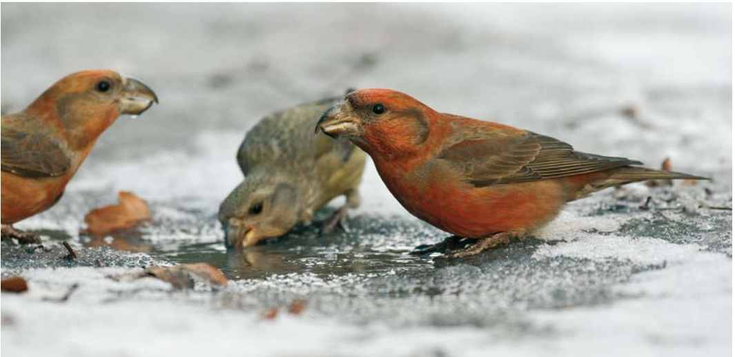
461 Eastern Crowned Warbler / Kroonboszanger Phylloscopus coronatus , Katwijk aan Zee, Zuid-Holland, 5 October 2007 462 Mongoolse Pieper / Blyth's Pipit Anthus godlewskii , Woerden, Utrecht, 24 January 2007 463 Parrot Crossbills / Grote Kruisbekken Loxia pytyopsittacus , Schoorl, Noord-Holland, 4 January 2008

photographed, sound-recorded (S Bot, M Gal, S Wytéma et al); 9 October, Eemshaven, Eemsmond , Groningen, ringed, photographed (L Tervelde); 8-12 December, Amsterdamse Bos, Amsterdam , Noord-Holland, photographed, sound-recorded (R Heemskerck). 2006 18 October, Eemshaven, Eemsmond , Groningen, sound-recorded (R Cazemier); 28 October Eemshaven, Eemsmond , Groningen, photographed, sound-recorded (R Cazemier); 3 November, Den Oever, Wieringen , Noord-Holland, photographed (J Garvelink); 9 November to 25 February 2007, Huizen , Noord-Holland, photographed, sound-recorded.