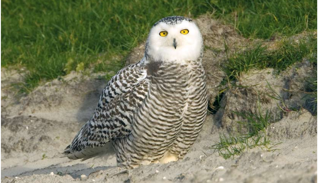
544 Sneeuwuil / Snowy Owl Bubo scandiacus , eerstejaars, Texel, Noord-Holland, 17 november 2008 (Roland Jansen)

gens lastig om de aanwezigheid van ringen met zekerheid uit te sluiten.