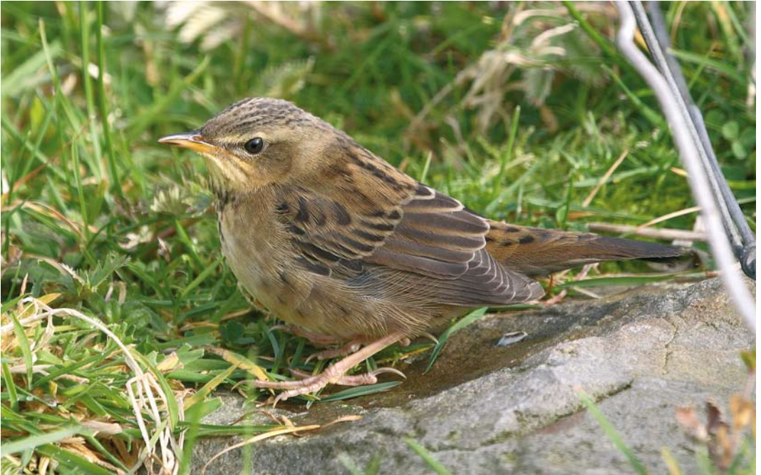
496 Pallas's Grasshopper Warbler / Siberische Sprinkhaanzanger Locustella certhiola , Fair Isle, Shetland, Scotland, 1 October 2008 (Mark Breaks)