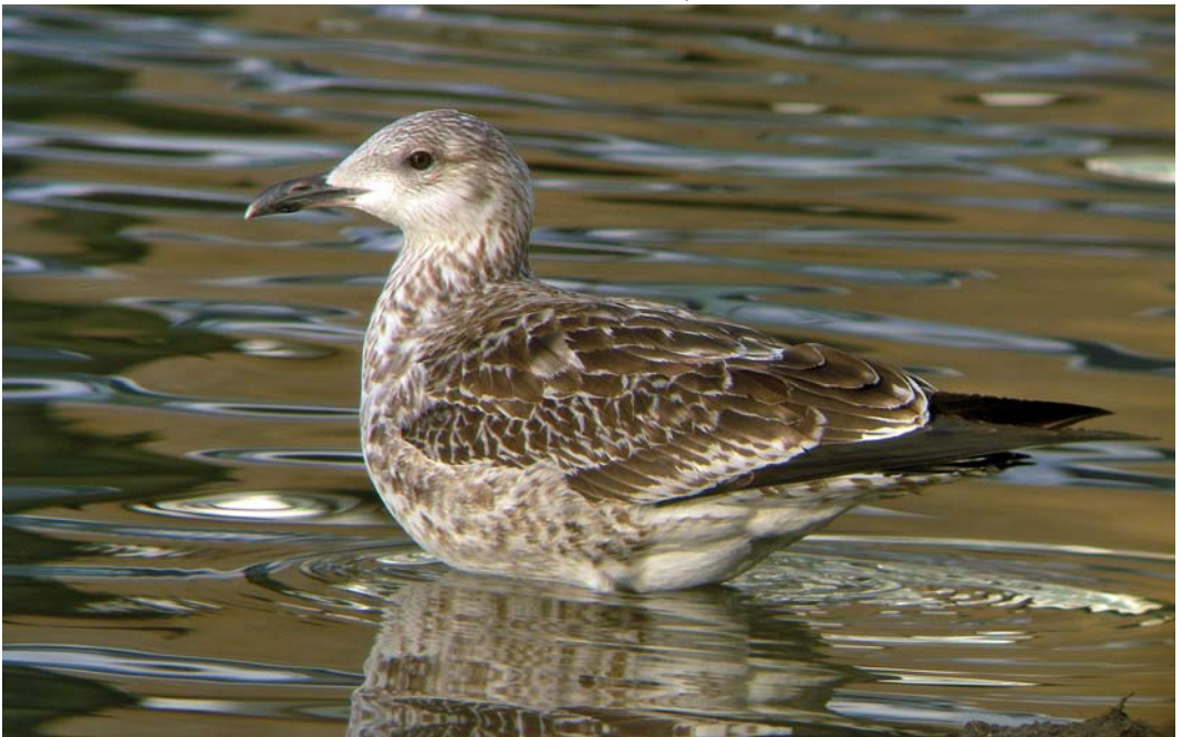
455 Baltic Gull / Baltische Mantelmeeuw Larus fuscus fuscus , first-year, Vinkhuizen, Groningen, Groningen, 19 December 2006