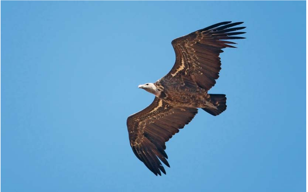
483 Rüppells Vulture / Rüppells Gier Gyps rueppellii , Tarifa, Cádiz, Spain, 7 September 2008 cf Dutch Birding 30: 347, 2008