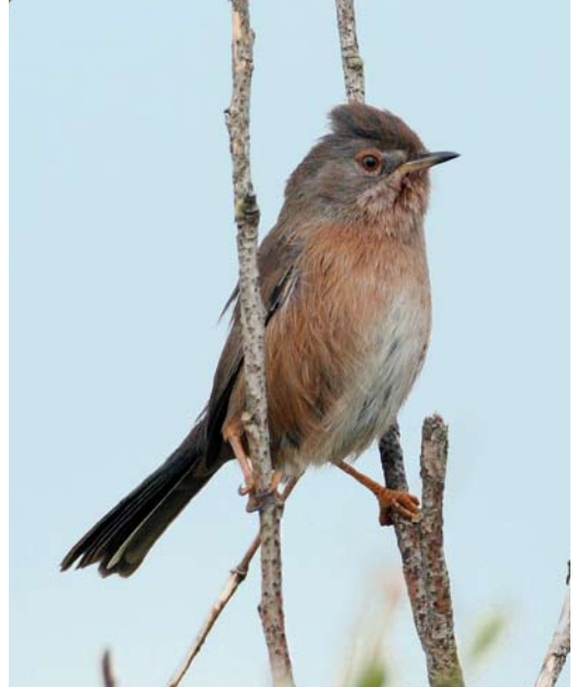
539 Provençaalse Grasmus / Dartford Warbler Sylvia undata , Heist, West-Vlaanderen, 18 oktober 2008 (Patrick Beirens)

tober verbleef er één in de Kalkense Meersen en bij Uitbergen, Oost-Vlaanderen; van 18 tot 31 oktober pleisterden er twee in de Achterhaven van Zeebrugge en van 24 tot 29 oktober werden er tot twee vogels gezien op de reigerslaapplaats in Harchies, Hainaut. De hoogste tellingen van Kleine Zilverreigers Egretta garzetta betroffen 19 in de IJzervallei in Woumen op 9 en 17 oktober. De grootste concentratie Grote Zilverreigers Casmerodius albus hield zich weer op in de Dijlevallei en telde maximaal 31 exemplaren in het Grootbroek in Sint-Agatha-Rode, Vlaams-Brabant, op 11 en 17 oktober. In Zonhoven, Limburg, waren er 20 op 20 oktober en bij Genk 10 op 22 oktober. Tussen 1 en 20 september werden in totaal nog 36 Purperreigers Ardea purpurea waargenomen. In oktober volgden er nog vier, waarvan de laatste op 19 oktober in Sleidinge, West-Vlaanderen, en op 29 oktober in Flemalle, Liège. Er werden in de eerste helft van september nog 106 Zwarte Ooievaars Ciconia nigra gezien waarvan 18 over de telpost van Torgny, Luxembourg. Op 10 oktober volgde een late vogel over Attenhoven, Vlaams-Brabant. Op 10 september vloog de grootste groep Ooievaars C. ciconia van de periode, 127 exemplaren, over het Groot Schietveld in Brecht, Antwerpen.