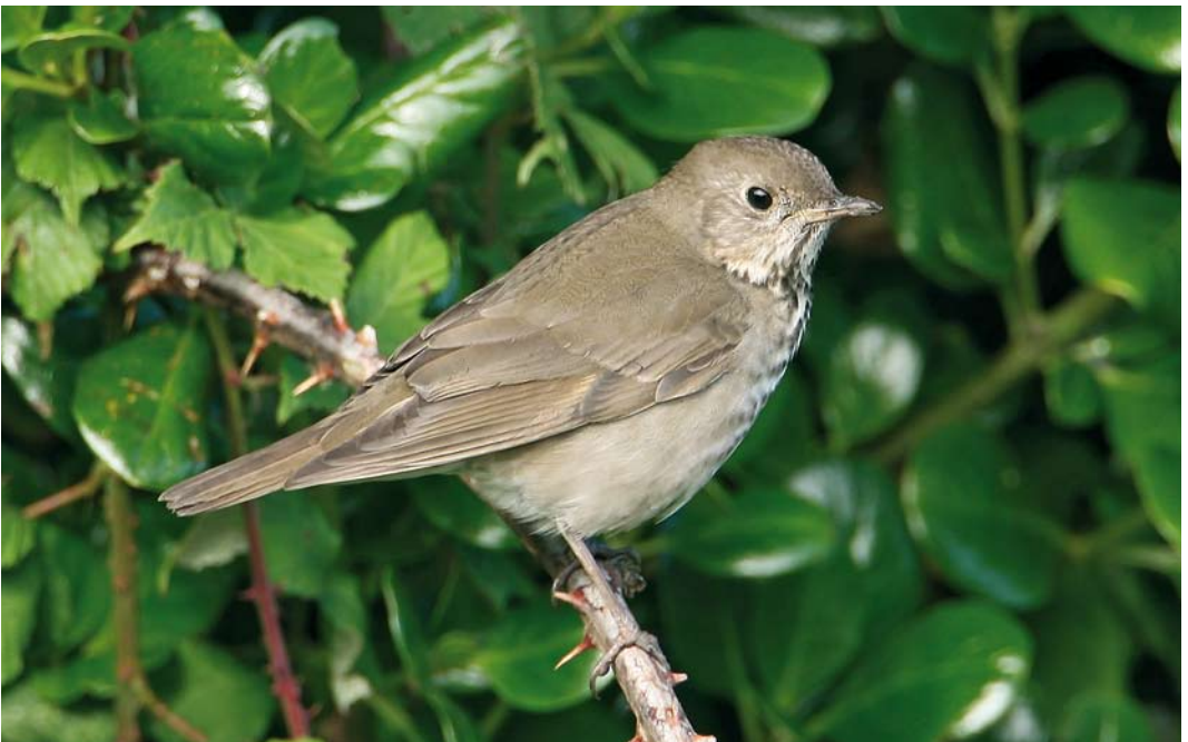
491 Grey-cheeked Thrush / Grijswangdwerglijster Catharus minimus , St Agnes, Scilly, England, 18 October 2008