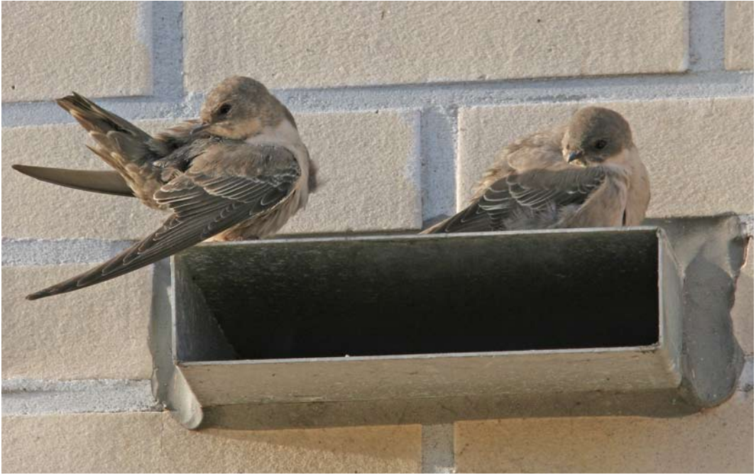
473 Rotszwaluwen / Eurasian Crag Martins Ptyonoprogne rupestris , Hoorn, Noord-Holland, 18 november 2006